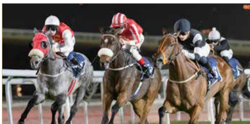
لقطة من السباقات الأسبوعية

الشوط السابع: كأس شركة المنيوم البحرين "البا" - المنيوم للعالم، لسباق التوازن (مستورد)، لمسافة 1000 متر. الجياد المشاركة: ويسترن، إدوارد كورنيلوس، وات أرنس، كوفر بوينت، بلو دي، دريم أوت لاود. الشوط الثامن والأخير: كأس شركة المنيوم البحرين "البا" للتميز للجياد المبتدئات (إنتاج البحرين)، لمسافة 1200 متر مستقيم. الجياد المشاركة: عز البحرين، غاشام، مهو، سنجان، بدجت، بودفا، فحال، فواز، جناحي، ميعاد، قالا، ريد سي، سيوف، أنفال، برلين، باليمب سيس، برنسس أوف موناكو.