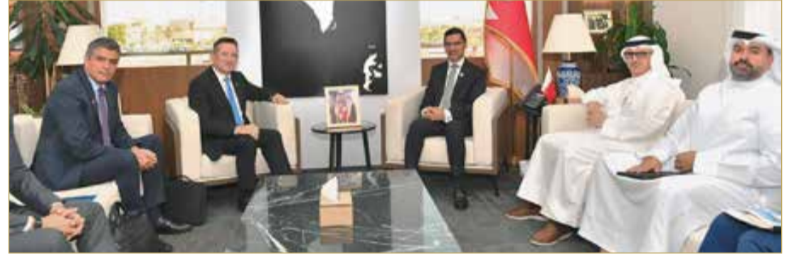
المنامة - وزارة شؤون البلديات والزراعة