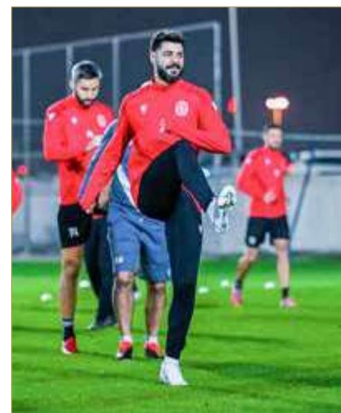
لقطة سابقة لتدريب المحرق

تعادل الأهلي القطري مع أنديجان الأوزبكي من جهة أخرى، أما خسارة الخالدية فإنه يفادير البطولة. حيث الخالدية يحتل المركز الثاني برصيد (6 نقاط) ومنافسه اليوم لديه (4 نقاط)، بينما يتصدر المجموعة الأهلي القطري (7 نقاط)، الذي سيواجه اليوم أيضاً أنديجان