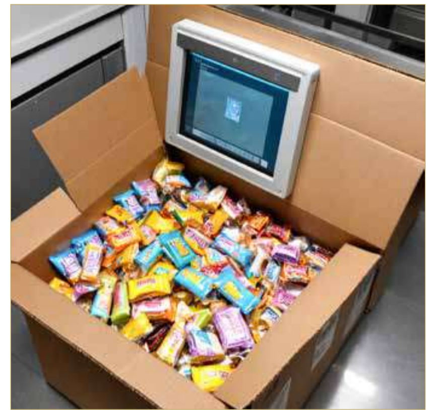
صورة تعبيرية مولدة بالذكاء الاصطناعي

البلاد لم يكن طرد قادم عبر الشحن الجوي، معاً بمواد غذائية وحلويات، كما بدا للوهلة الأولى؛ إذ أخفى داخله مواد مخدرة كشفت عنها إجراءات التفتيش الدقيقة في مطار البحرين الدولي، لتبدأ على إثر ذلك تحقيقات موسعة كشفت عن تورط سيدة بحرينية أربعينية في استيراد المواد المخدرة وحيازتها وتعاطيها. وتشير تفاصيل الواقعة إلى أنه أثناء ما كان ضابط الجمارك بمطار البحرين الدولي على واجب عمله في قسم تفتيش الأمتعة لمعاينة الطرود القادمة من إحدى الدول الأوروبية في حوالي الساعة 2:00 مساءً، اشتبه بأحد الطرود يحمل اسم المتهمه، وبعد تمريره على جهاز الأشعة اشتبه بمحتوياته؛ إذ تبين وجود كثافة عالية داخل الطرد، وعلى إثر ذلك قام بفتح الطرد ومعاينته، وتبين له وجود مواد غذائية وحلويات وعدد من الأكياس والعلب بداخلها مادة عسبية ذات رائحة مشتبته بأنها مادة مخدرة تزن 194.15 جرام، إذ تمت تحبستها داخل المواد