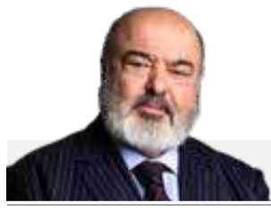
د. الشيخ خالد بن محمد آل خليفة