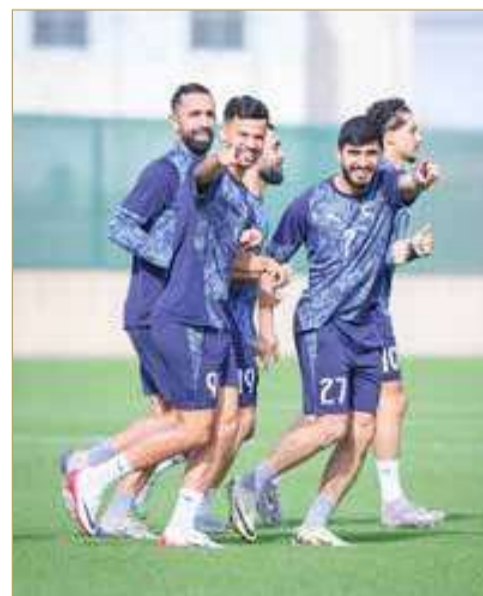
لقطة سابقة لتدريب الخالدية