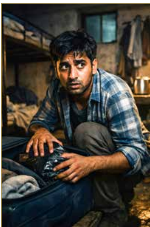
صورة تعبيرية مولدة بالذكاء الاصطناعي

البلاد أوقفت الجهات الأمنية متهمين اثنين يشتبه في تورطهما ضمن شبكة منظمة للاتجار بالمخدرات والمؤثرات العقلية، بعد ورود معلومات سرية تفيد بقيامهما باستيراد المواد المخدرة وترويجها باستخدام أسلوب البريد المبيت.