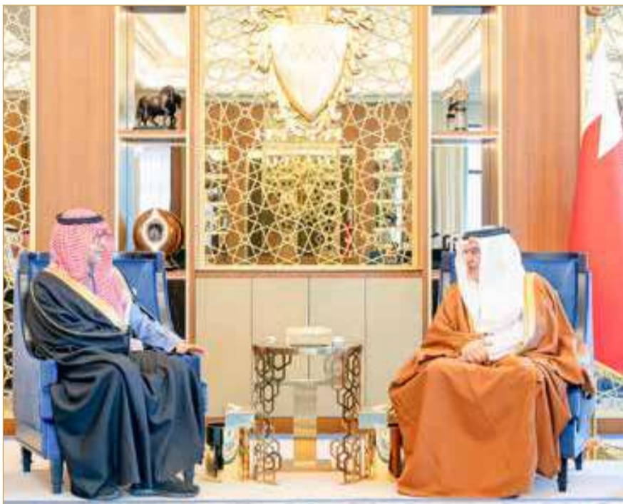
سمو ولي العهد رئيس الوزراء مستقبلاً رئيس مجلس إدارة مجموعة "إس تي سي"

تكريم الجهات الداعمة لإنجاح برامج ومبادرات المحافظة... سمو الشيخ خليفة بن علي: