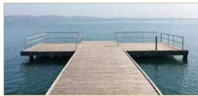
صورة تعبيرية مولدة بالذكاء الاصطناعي