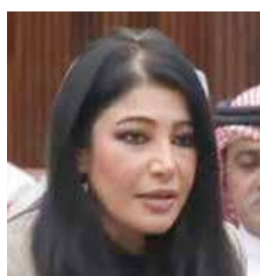
النائب د. مريم الظاعن

منها تنظيم الأعياد الوطنية الخاصة بدول الخليج، إضافة إلى حاجتنا لتطوير الوسائل الإعلامية والرقمية، وتقديم الهوية الوطنية بصيغة تفاعلية قريبة من الشباب، دون الإخلال بالمضامين". وزادت "الكثير من البرامج تعتمد الآن على الذكاء الاصطناعي؛ ما يعني أننا نستطيع توظيف الكثير من الشباب لاستثمار البرامج والمسلسلات القديمة، بحيث يتم عرضها مرة أخرى بتقنيات جديدة، وهو ما سيحقق إيرادات لوزارة الإعلام".