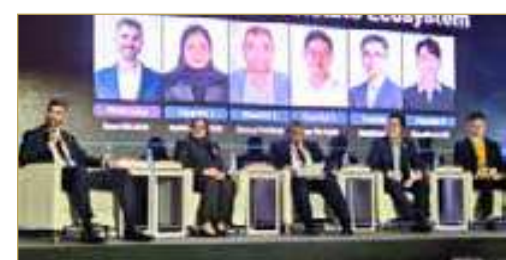
رئيس "التخطيط" بوكالة "الفضاء": شركات استراتيجية طويلة المدى لبناء بنية تحتية فضائية متقدمة