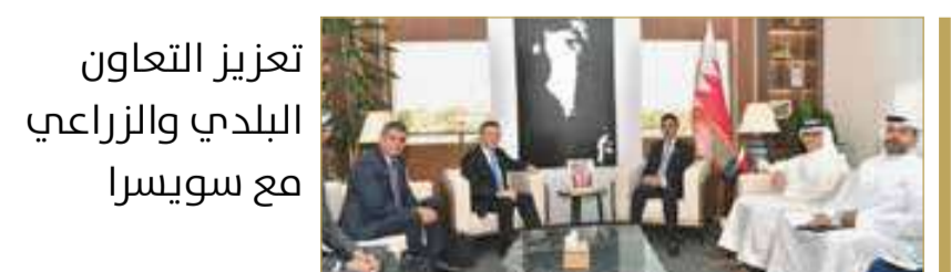
تعزيز التعاون البلدي والزراعي مع سويسرا

طرد حلويات مسموم يوقع أربعينية متعاطية في الفخ