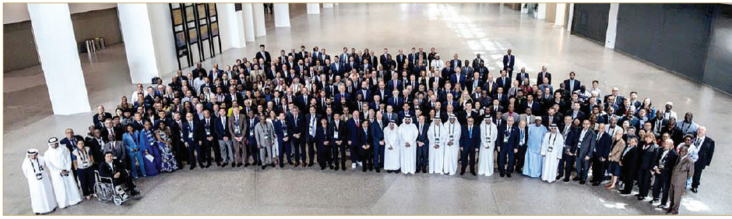
البحرين تبهر العالم باستضافة كونغرس السلة