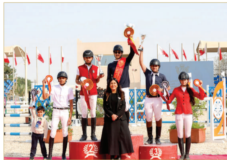
لقطات من التتويج