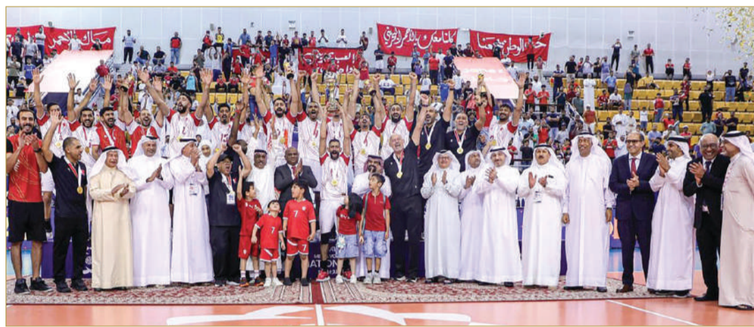
كأس الأمم الآسيوية للطائرة

المنشآت، وقدرة المملكة على استضافة البطولات الكبرى في وقت قياسي، وسط توقعات بمنافسات قوية تعيد للبطولة العربية بريقها الفني والجماهيري.