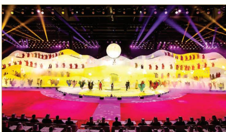
استضافة تاريخية لدورة الألعاب الآسيوية للشباب