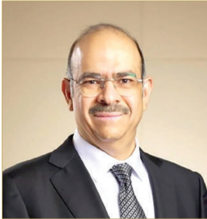
وزير العمل ووزير الشؤون القانونية

وبالتنسيق مع هيئة المعلومات والحكومة الإلكترونية، عملت الوزارة على تعزيز القدرة التقنية للمنصة الوطنية للتوظيف لاستيعاب الأعداد الكبيرة من المستفيدين يوميًا، ودعم خدمات المفتاح الإلكتروني والإشعارات الحكومية، بما يضمن استدامة الخدمة وتجذب أي خلل أو إرباك تقني. كما بادرت الشركات الحكومية التي تمتلك الحكومة كامل رأسمالها أو حصصاً فيه إلى إدراج شواغرها الوظيفية في المنصة، تعزيزاً لدورها في دمج الكوادر الوطنية في سوق العمل.