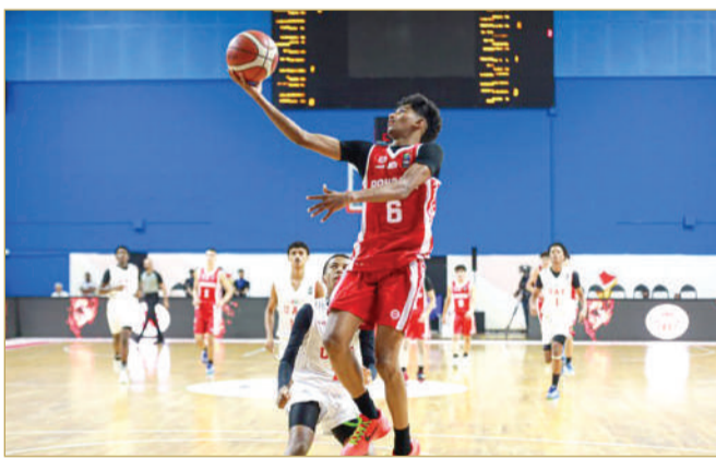
البطولة الخليجية لكرة السلة للناشئين