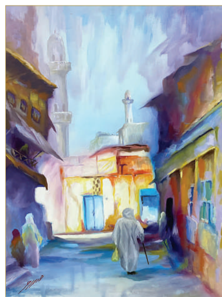
مساء الفرجان لآسدر