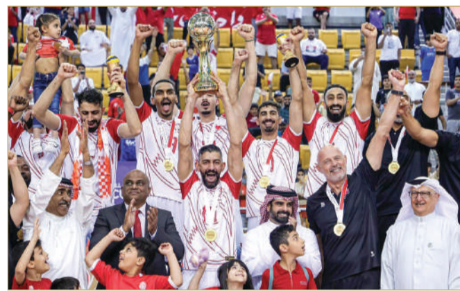
كأس الأمم الآسيوية للطائرة