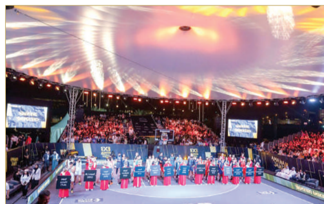
نهائي استثنائي لبطولة 3x3 العالمية