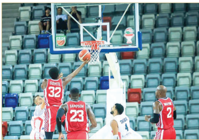
تنظيم مميز للبطولة العربية لكرة السلة للرجال