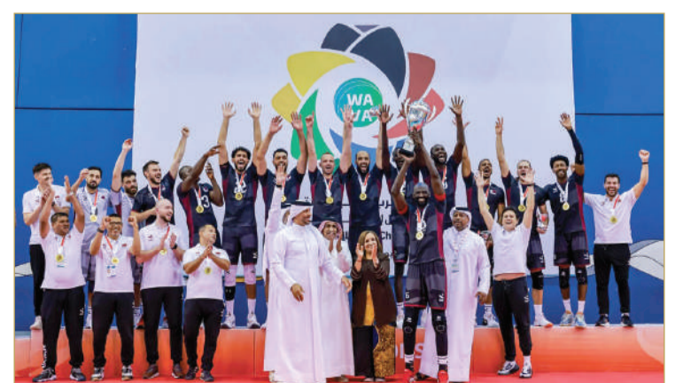
بطولة غرب آسيا للطائرة