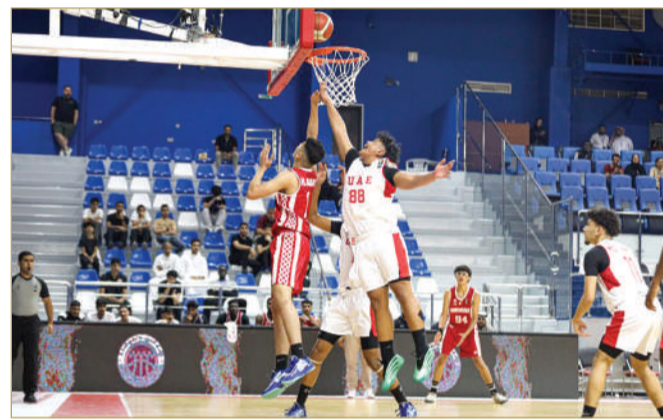
البطولة الخليجية لكرة السلة للناشئين