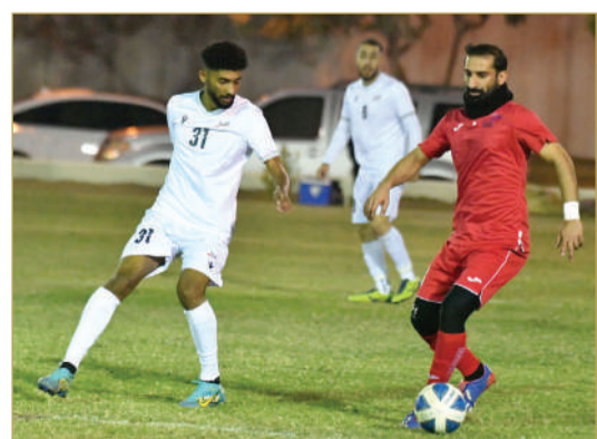
من لقاء الفريقين الموسم الماضي