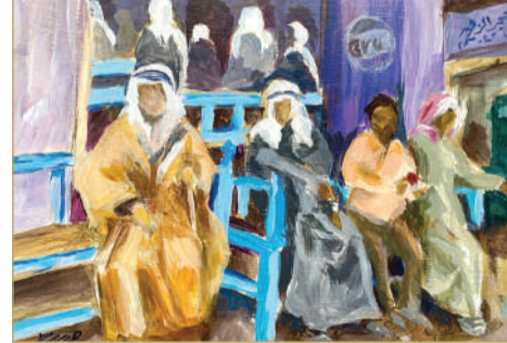
في رحاب المقهى العتيق