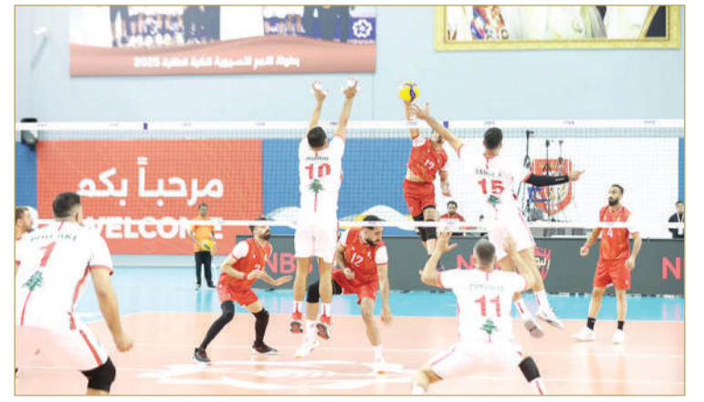
المملكة تستضيف النسخة الأولى لبطولة غرب آسيا للطائرة

محطات دولية وقارية رسخت الثقة العالمية بقدرة المملكة على تنظيم أكبر الأحداث