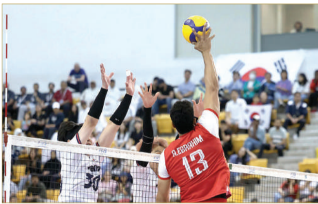
كأس الأمم الآسيوية للطائرة

عكس عام 2025 صورة متكاملة للبحرين كعاصمة رياضية قادرة على احتضان مختلف الأحداث، من القارية العملاقة إلى البطولات المتخصصة، في تأكيد جديد على أن الاستثمار في الرياضة بات ركيزة أساسية في المشروع الوطني، وواجهة مشرقة تعكس طموح المملكة ومكانتها المتقدمة على الخارطة الرياضية العالمية.