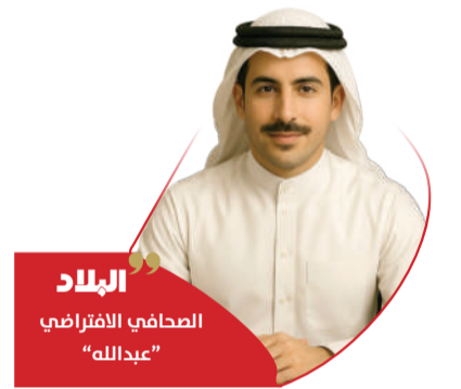
البلاد الصحافي الافتراضي "عبدالله"

رغم مرور أكثر من ثلاثة عقود على إعلان الانفصال، لا تزال "أرض الصومال" تفتقر إلى الاعتراف الدولي كدولة مستقلة. فالأمم