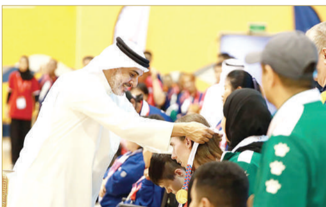
البطولة العالمية لتحدي البوتشيا 2025