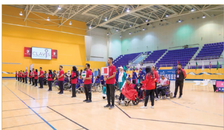
حفل افتتاح البطولة العالمية لتحدي البوتشيا