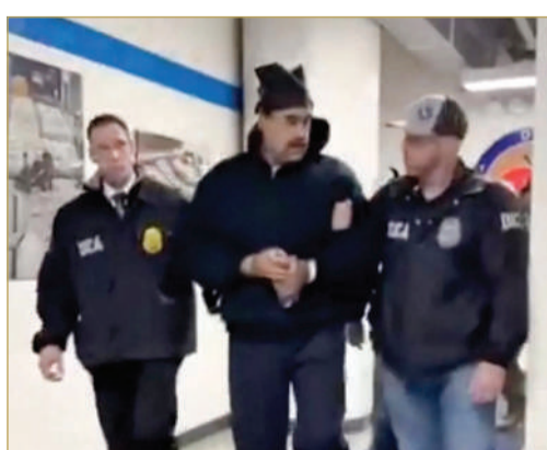
مادورو يُقتاد رهن الاحتجاز "رويتز"

العيون تراقب من بعيد، لا تبحث عن مشهد كبير، بل عن التفاصيل الصغيرة: طريق يُسلك كل مساء، باب يُغلق في توقيت ثابت، ورجل يبذل مكان نومه كلما اشتد التوتر. منذ أغسطس الماضي، بدأ العذّ التنازلي بعيداً عن الأضواء. أجهزة الاستخبارات الأميركية تابعت نيكولاس مادورو كما يُتأقظ ظلّ لا يُمسك به: أين يعيش، إلى أين ينتقل، ماذا يأكل، وكيف يحاول الإفلات من الرصد.