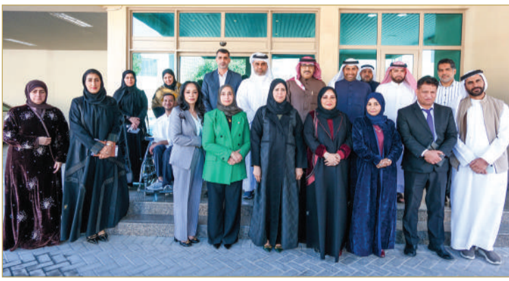
وزير التربية والتعليم يلتقي عددا من أولياء أمور الطلبة ذوي الهمم

لجنة استشارية للطلبة ذوي الهمم للتباحث بشكل مستمر في تطوير العملية التعليمية لتكون أكثر شمولية.