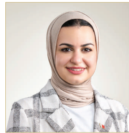
وزيرة شؤون الشباب

وأضافت وزيرة شؤون الشباب أن كرنفال السيارات يأتي ضمن سلسلة من المبادرات والفعاليات التي ستنتهجها الوزارة بمناسبة يوم الشباب البحريني،