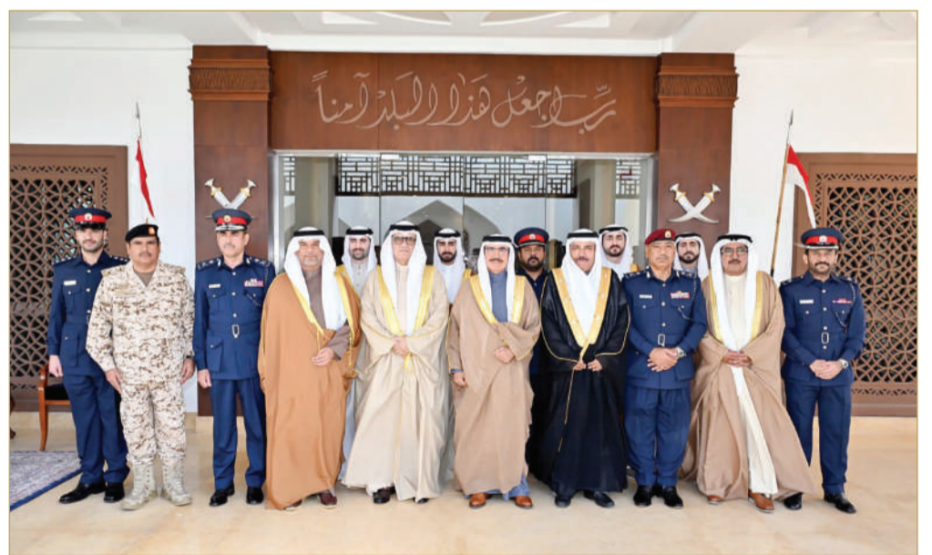
وزير الداخلية يستقبل أفراد عائلتي بن دينه والعريفي

استقبل وزير الداخلية الفريق أول الشيخ راشد بن عبد الله آل خليفة، أمس، عدداً من أفراد عائلتي بن دينه والعريفي، يتقدمهم راشد محمد بن دينه، حيث أعربوا عن شكرهم وتقديرهم على التعازي التي قدمها للعائلتين.