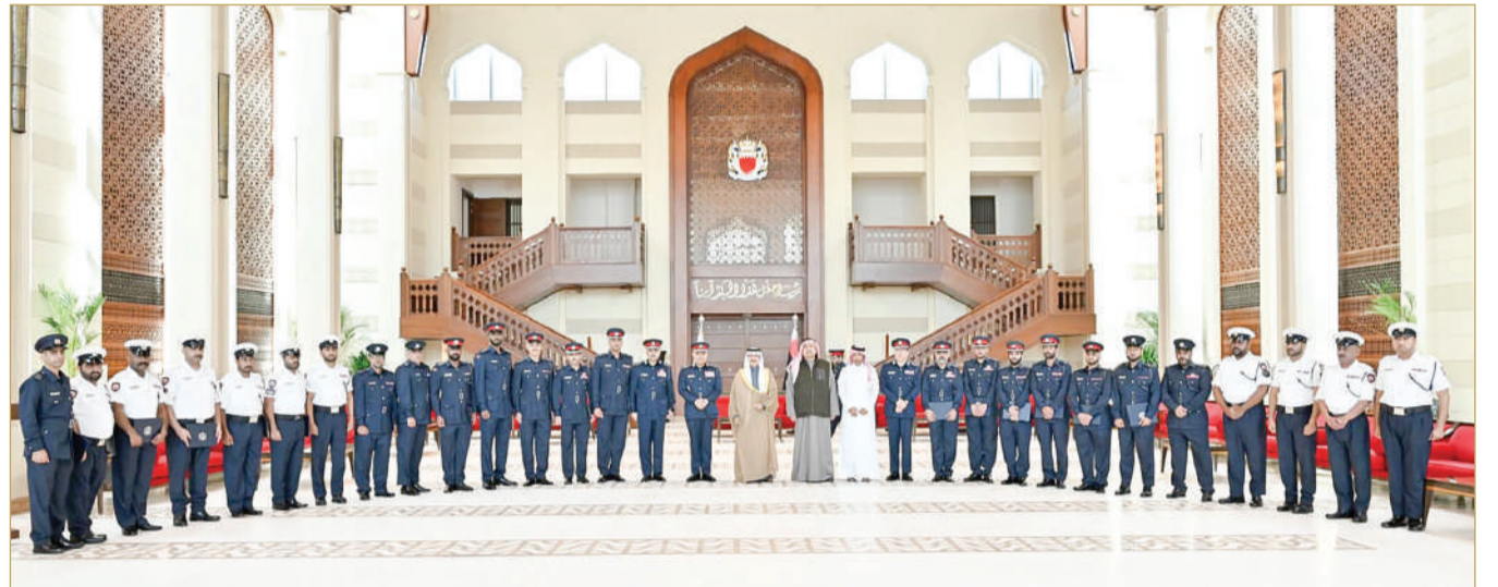
وزير الداخلية يكرم أعضاء الفرق الأمنية من "المباحث والأدلة الجنائية"

وأشاد الوزير بالجهوية والاحترافية العالية التي أبدتها المكرومن من الضباط وضباط الصف، وما أبدوه من شجاعة وسرعة استجابة في التعامل مع الحوادث والقضايا الأمنية، بمهنية عالية، وبما يحفظ أمن وسلامة الجميع.