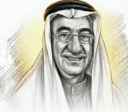
إبراهيم بن محمد زينل مجموعة ترافكو