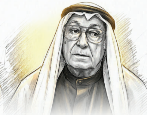
تقي بن محمد البحراني عائلة محمد بن مكي البحراني