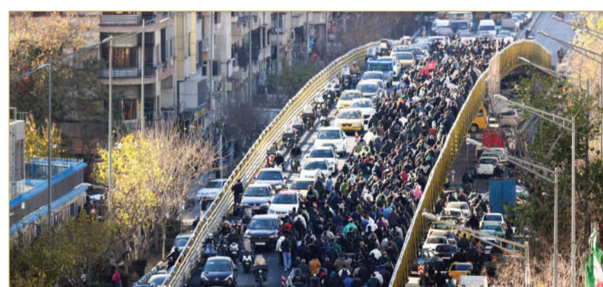
جانب من الاحتجاجات على تدهور الأوضاع الاقتصادية في طهران

لكن نطاقها وحجمها اتسع ليمتد إلى مدن عدة في أنحاء البلاد. وفرضت السلطات الإيرانية قيوداً على الوصول إلى الإنترنت، إذ انخفضت حركة البيانات بنسبة 35%، وفق بيانات شركة تكنولوجيا المعلومات الأميركية "كلودفلير". وتحدثت تقارير على منصات التواصل الاجتماعي عن اضطرابات "شديدة"، ومخاوف من احتمال انقطاع خدمة الإنترنت الدولية بشكل كامل تقريباً.