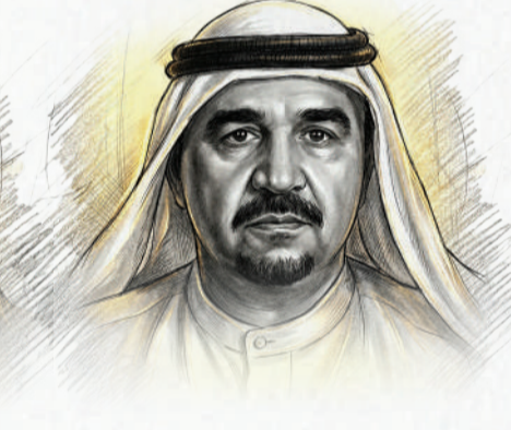
عبدالرزاق بن محمود آل محمود عائلة الشيخ محمود آل محمود