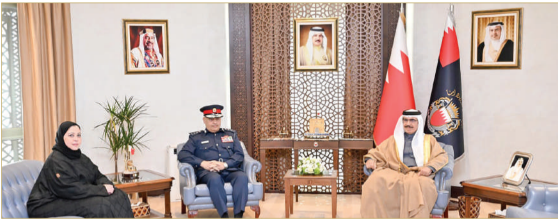
وزير الداخلية يستقبل الرئيس التنفيذي للمركز الوطني للتحريات المالية

استناداً إلى الأسس التشريعية والقانونية، منها دور المركز الوطني للتحريات المالية في وضع الخطط والآليات التنفيذية وتعزيز الجهود الوطنية اللازمة في هذا الشأن. وأثنى على دور وجهود الشبيخة مي بنت محمد آل خليفة، والتي تتولى حالياً منصب نائب رئيس مجموعة العمل المالي لمنطقة الشرق الأوسط وشمال أفريقيا (مينافاتف) وما يعكسه ذلك من ثقة بدور المملكة ومكانتها في تعزيز الجهود الدولية وحماية النظام المالي، مؤكداً أن التعاون البناء بين مملكة البحرين والمجموعة الدولية، يسهم في تعزيز الثقة الدولية والسمة المتميزة لمركز البحرين المالي والمصرفي.