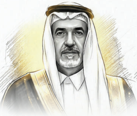
هشام بن عبدالرحمن الريس شركة هشام بن عبدالرحمن جعفر