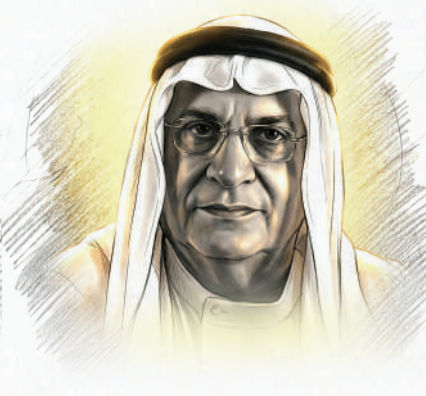
فؤاد بن إبراهيم كانو عائلة إبراهيم بن خليل كانو