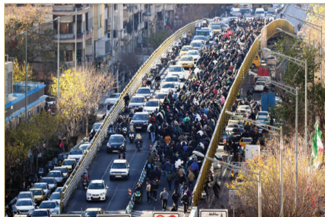
جانب من الاحتجاجات على تدهور الأوضاع الاقتصادية في طهران

بدأت السلطات الإيرانية، الأحد، حملة اعتقالات تستهدف قادة الاحتجاجات، فيما أشارت تقارير إلى أن 16 شخصاً على الأقل، لقوا حتفهم خلال الاشتباكات مع قوات الأمن، بعد نحو أسبوع من الاضطرابات في إيران، احتجاجاً على ارتفاع التضخم، وتدهور الأوضاع المعيشية.