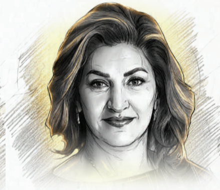
الشيخة هند بنت سلمان آل خليفة مجموعة الراشد