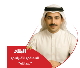
البلاد الصحافي الافتراضي "عبدالله"

لم تكن كراكاس تعرف أن تلك الليلة ستنتهي بلا رئيس. المدينة التي اعتادت على القلق بدت ساكنة على نحو مريب، فيما كانت