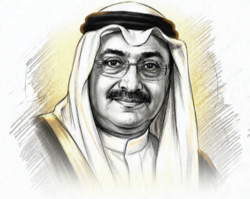
محمد بن حسين يقيم عائلة حسين بن علي يقيم