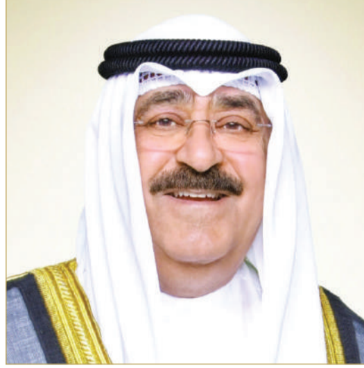
سمو أمير دولة الكويت