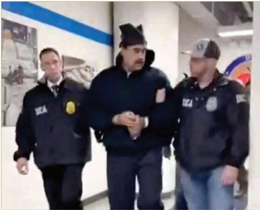
الرئيس الفنزويلي نيكولاس مادورو وهو يُقتاد رهن الاحتجاز

يلحق القضاء الأميركي الزوجين بتهمة تتعلق بـ"الإرهاب المرتبط بالمخدرات" وتصدير الكوكايين إلى الولايات المتحدة. لكن ما بعد الصورة كان أكبر من ملف قضائي. فنزويلا دخلت فراغاً سياسياً مفاجئاً، والعالم وجد نفسه أمام مشهد غير مسبوق: رئيس أخرج من بلاده في عتمة الفجر، بلا مقاومة، وبخطة انتظرت شهرها لتعمل في دقائق.