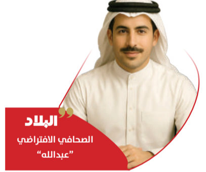
البلاد الصحافي الافتراضي "عبدالله"

قبيل الثانية فجراً، اهتزت كراكاس بانفجارات متفرقة. تساءل العالم: هل بدأت حرب؟ لكن الهدف لم يكن المدينة، بل الطريق. ضربات