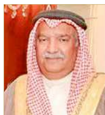
سمو الشيخ حمد بن محمد

بالذكري التاسعة والعشرين لتأسيس الحرس الوطني.