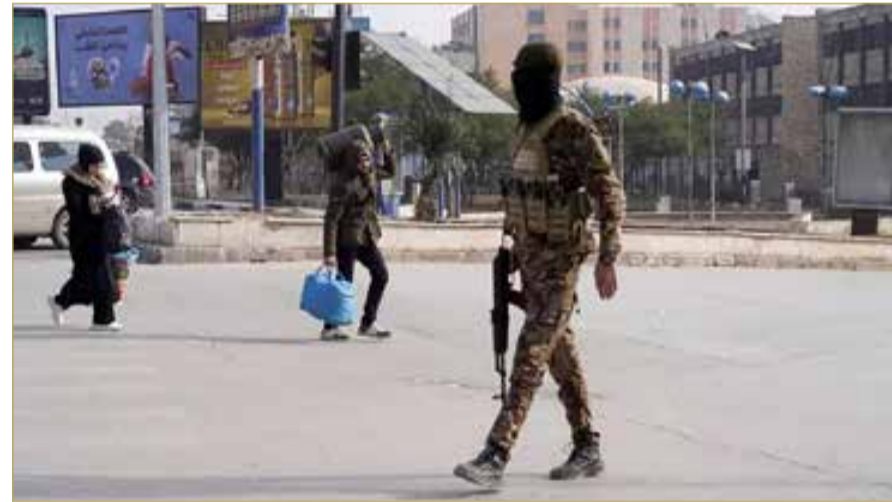
قوات من الجيش السوري في حلب

وقد أسفرت الشهر الماضي، عن مقتل أكثر من 20 مدنياً وإصابة أكثر من 150 آخرين، بالإضافة إلى مقتل أكثر من 25 جندياً، فضلاً عن تعطيل الحياة اليومية والتجارة في المدينة. وأكد أن العملية ستستند إلى قرار محلي ومطلب شعبي من سكان حلب، وتهدف إلى وقف القصف المستمر ونيران القناصة وهجمات الطائرات المسيرة، واستعادة الأمن، وإعادة فتح طريق حلب-عزاز، وحماية المدنيين.