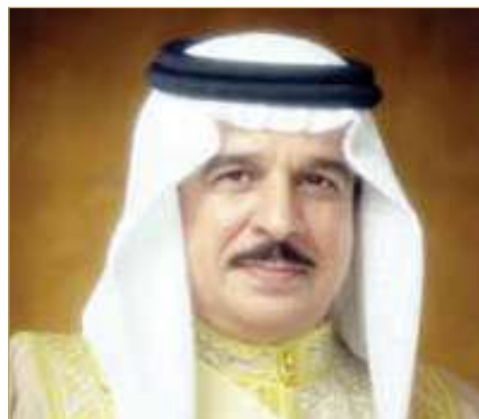
ملك البلاد المعظم

والعشرين لتأسيس الحرس الوطني. وتلقى ولي العهد نائب القائد الأعلى للقوات المسلحة رئيس مجلس الوزراء صاحب السمو الملكي الأمير سلمان بن حمد آل خليفة، برفقة خليفة، برفقة سمو ولي العهد رئيس مجلس الوزراء، سمو الشيخ علي بن خليفة آل خليفة، رفع فيها إلى مقام جلالته السامي خالص التهاني والتبريكات بمناسبة الاحتفال بالذكرى التاسعة والعشرين لتأسيس الحرس الوطني.