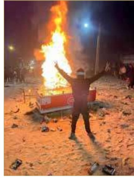
اتساع رقعة الاحتجاجات في إيران

عن مزيد من التفاصيل، وفق ما نقلت وكالة الأنباء الإيرانية الرسمية (إرنا). علماء أن المنطقة تشهد منذ عقدين اشتباكات بين تنظيمات بلوشية مسلحة وقوات الشرطة والحرس الثوري وحرس الحدود الإيرانية. وكان السوق الكبير في طهران أو ما يعرف بـ "ال بازار الكبير" شهد مواجهات بين محتجين من التجار والأمن الذي أطلق قنابل الغاز المسيل للدموع نحو المتظاهرين. يذكر أن الاحتجاجات المستمرة منذ 28 ديسمبر الماضي (2025)، كانت بدأت بإضراب نفذه أصحاب محال في بازار طهران احتجاجاً على الأوضاع المعيشية، ثم اتسع نطاقها إلى مناطق أخرى، خصوصاً في غرب البلاد، وبدأت ترفع مطالب سياسية. هذا وتُعد هذه الاحتجاجات الأكبر في إيران منذ التحركات التي اندلعت في سبتمبر 2022 واستمرت أشهراً، إثر وفاة الشابة مهسا أميني بعد اعتقالها على يد شرطة الأخلاق بتهمة انتهاك قواعد اللباس الصارمة المفروضة على النساء في إيران.