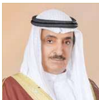
الشيخ سلمان بن عبدالله

العمري الشيخ سلمان بن عبدالله بن حمد آل خليفة، رفع فيها إلى مقام جلالته السامي خالص التهاني والتبريكات بمناسبة الاحتفال بالذكرى التاسعة والعشرين لتأسيس الحرس الوطني.