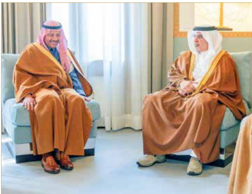
سمو ولي العهد رئيس الوزراء يستقبل سفير المملكة العربية السعودية لدى مملكة البحرين