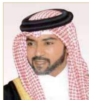
سمو الشيخ فيصل بن راشد

خالص التهاني والتبريكات بمناسبة الاحتفال بالذكرى التاسعة والعشرين لتأسيس الحرس الوطني.