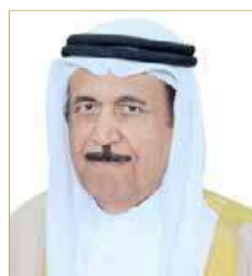
الشيخ عبدالرحمن بن محمد

بالذكري التاسعة والعشرين لتأسيس الحرس الوطني.