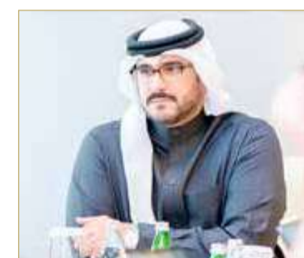
سمو وزير ديوان رئيس مجلس الوزراء

جاء ذلك لدى ترؤس سموه اجتماع مجلس إدارة صندوق العمل (تمكين)، إذ اعتمد سموه