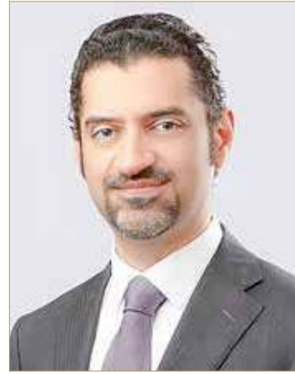
وزير شؤون البلديات والزراعة

تضم جميع الأطراف ذات العلاقة، تتولى مراجعة ودراسة طلبات الإعلانات المقدمة وإبداء الرأي الفني بشأنها، كما يتم تمرير بعض الطلبات للجهات الخدمية للدراسة. وتجدر الإشارة إلى أن الوزارة، وفي إطار التزامها بتطوير منظومة الإعلانات، قد شرعت في تقديم مشروع تعديل للقانون الحالي إلى السلطة التشريعية، ليتناسب مع الواقع الحالي مع تغير طبيعة النشاط التجاري والإعلاني، بما يضمن تحسين المظهر العام للمدن وتسهيل إجراءات التراخيص بشكل منظم وسريع، كما بشكل خطوة تطوير شاملة لتنظيم النشاط الإعلاني في المملكة، بما يتماشى مع التطور العمراني والتجاري الحالي.