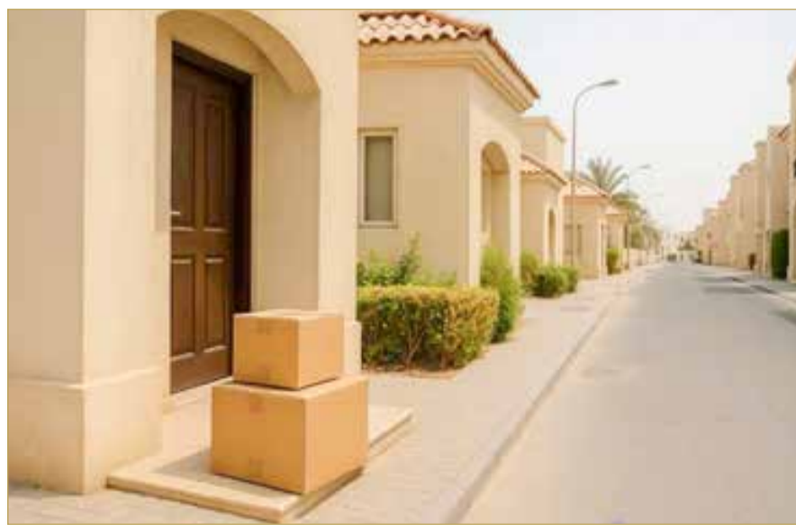
صورة تعبيرية مولدة بالذكاء الاصطناعي

وبعد بريد البحرين جزءاً من شؤون النقل البري والبريد التابعة لوزارة المواصلات والاتصالات، ويعمل على تقديم خدمات بريدية متكاملة، موثوقة، ميسرة، وقليلة التكاليف على المستويين المحلي والعالمي، مع تنظيم وتقديم الخدمات البريدية الشاملة لكافة قطاعات المجتمع.