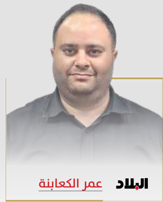
البلاد عمر الكعابتة

لم يكن فجر السبت الماضي حدثاً عادياً في تاريخ فنزويلا والعالم، ولا في سجل التحوّلات الأميركية في العالم، ففي ساعات قليلة، انتقلت العلاقة المتوترة بين واشنطن وكراكاس من مستوى العقوبات والضغط السياسية والاقتصادية إلى مستوى غير مسوق من العمل العسكري المباشر، تُوجّح باعتقال رئيس دولة وهو على رأس سلطته، داخل عاصمته، وبقوة السلاح، مشهد أعاد إلى الواجهة أسئلة قديمة حول حدود القوة، ومعنى السيادة، ومصير الدول التي تحاول الخروج من العباءة الأميركية في نظام دولي يتجه على نحو متسارع نحو القوض وتآكل القواعد.