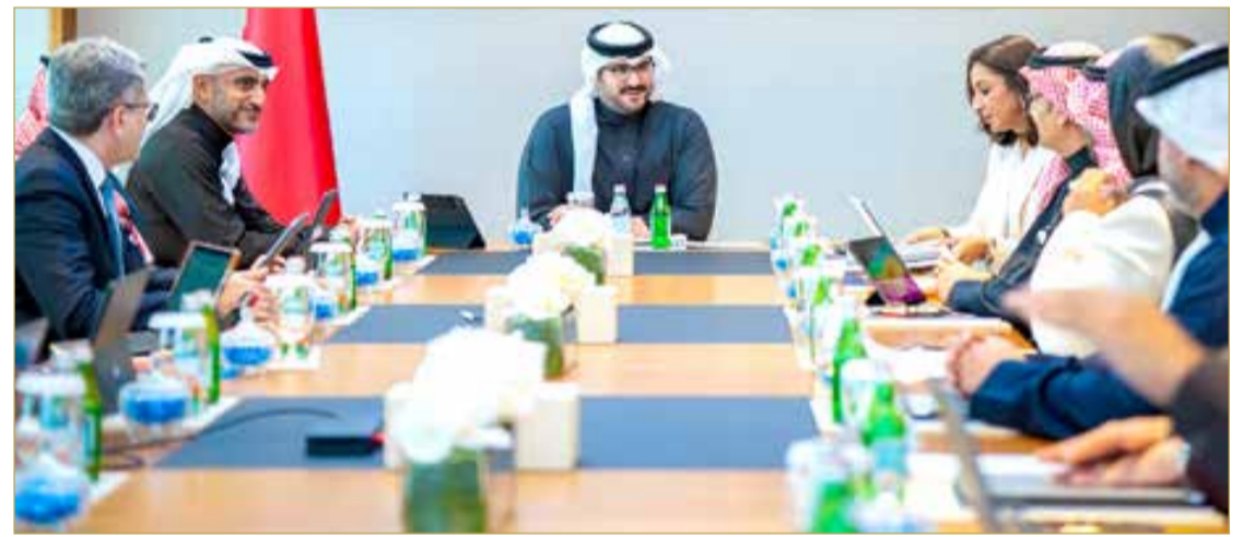
سمو وزير ديوان رئيس مجلس الوزراء يترأس اجتماع مجلس إدارة صندوق العمل

الحالية والمستقبلية؛ الأمر الذي يعكس التزام "تمكين" بتوفير البرامج والمبادرات الداعمة التي تتماشى مع التوجهات الوطنية ومتطلبات سوق العمل.