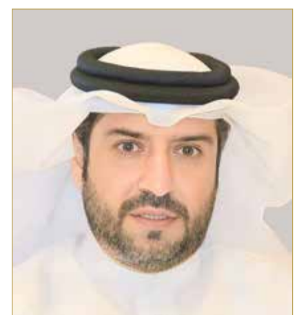
وكيل شؤون الزراعة والثروة الحيوانية

يذكر أنه في إطار الجهود الحكومية المتواصلة لتطوير الخدمات الحكومية وإعادة هندستها، تم توثيق وترجمة ونشر أكثر من 1,300 خدمة حكومية، شهدت نحو 800 خدمة منها عمليات تطوير وإعادة هندسة في مختلف القطاعات الحكومية، استناداً إلى المقترحات والملاحظات الواردة بشأن الخدمات الحكومية عبر النظام الوطني للمقترحات والشكاوى (تواصل)، وملاحظات المستثمرين، وتقارير المتسوق السري لتقييم الخدمات الحكومية، فضلاً عن إطلاق أدلة إرشادية واتفاقيات مستوى خدمة، بما يسهم في رفع كفاءة الإجراءات، وتحسين جودة الخدمات المقدمة، وتعزيز تجربة المستخدمين، ودعم مسار التحول الرقمي الحكومي.