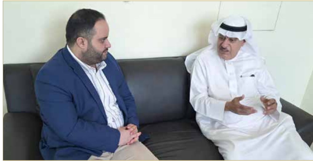
نائب الرئيس التنفيذي الأسبق لغرفة تجارة وصناعة البحرين متحدثاً لـ ”البلاد“

ثانياً: شعور البعض بأن الأمور محسومة وأن هناك وجوهاً معينة ستفوز دائماً. ثالثاً: سمعنا مقولة ”الغرفة ما فيها فائدة“ منذ عقود، وهذا شعور سلبي ينتقل بين الأجيال. (اقرأ الحوار كاملاً بالموقع الإلكتروني)