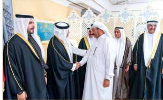
سمو ولي العهد رئيس الوزراء يزور مجلس المرحوم محمد بن عبدالله المناعي

يرافقه سمو الشيخ محمد بن سلمان بن حمد آل خليفة، وعدد من كبار المسؤولين، مجلس عائلة العريض،