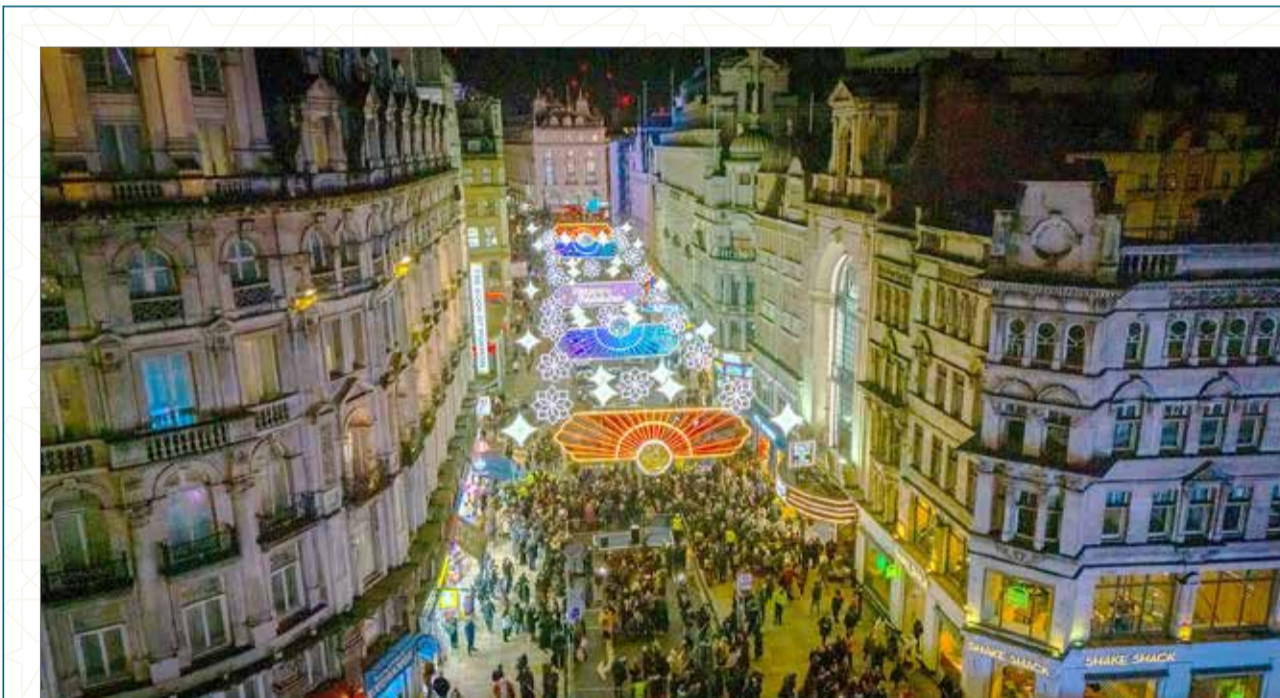
تألقت منطقة بيكاديللي سيركس في قلب لندن بأضواء رمضان هذا العام بحلة أوسع، في مشهد يجسد قيم التنوع والانفتاح.

احمسي البصل والثوم والفلفل الرومي والجزر على نار هادئة لمدة 7 دقائق، ثم أضيفي الدجاج المقطع، ثم أضيفي الملح وبقية البهارات والصلصة وقلبي حتى ينضج الدجاج، ثم أضيفي كوبي ماء حتى ينغمر وغطيه مدة 20 دقيقة، ثم أضيفي الرز وحركي واتركيه مدة 15 دقيقة تقريباً أو حتى ينضج. * طريفة السلطنة: طماطم مقطعة، خيار، خس، ملعقة طحينية سائلة، وملعقة زبادي ورشة ملح، وبالغافية.