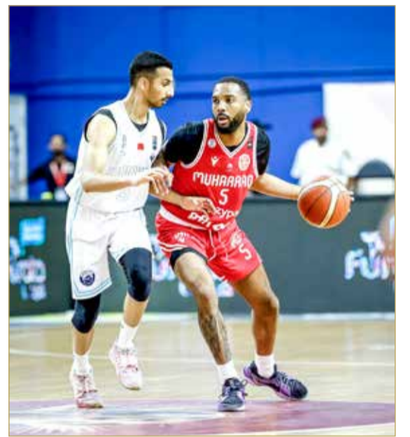
من منافسات كأس خليفة بن سلمان السابقة

وتكتسب البطولة أهمية خاصة في روتنامة الموسم الرياضي؛ إذ تُعد إحدى أبرز المسابقات المحلية وأكثرها قيمة فنية ومعنوية؛ فهي لا تمثل مجرد لقب يُضاف إلى خزائن الأندية، بل تشكل محطة تنافسية مختلفة بحساباتها، إذ تُحسم المواجهات بنظام خروج المغلوب؛ ما يضاعف عنصر الإثارة ويجعل هامش الخطأ محدوداً للغاية. كما تمنح البطولة الفرق فرصة لإثبات الذات