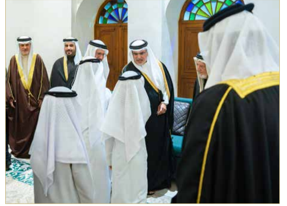
سمو ولي العهد رئيس الوزراء يزور مجلس عائلة إسحاق بن عبدالرحمن ومصطفى بن عبداللطيف

ومجلس عائلة إسحاق بن عبدالرحمن ومصطفى بن عبداللطيف، ومجلس المرحوم محمد بن عبدالله المناعي، حيث تبادل سموه التهاني والتبريكات مع أصحاب المجالس والحضور بمناسبة حلول شهر رمضان المبارك.