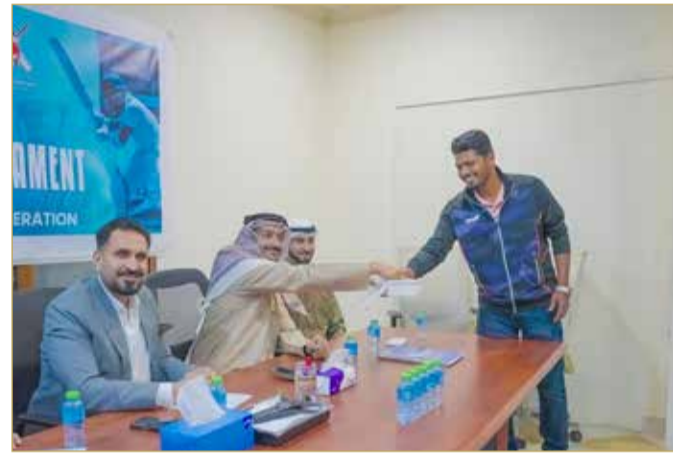
إجراء قرعة الكريكت