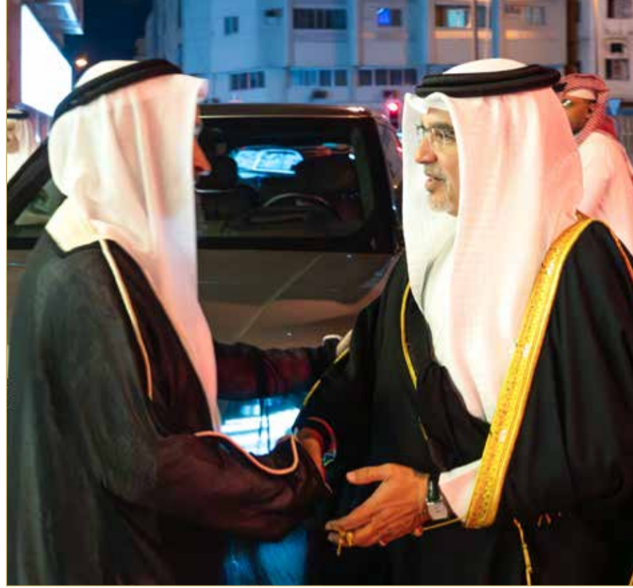
سمو ولي العهد رئيس الوزراء يزور مجلس عائلة إسحاق بن عبدالرحمن ومصطفى بن عبداللطيف