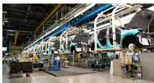
البلاد | طارق البحار

ومنذ عهد الرئيس الأميركي ترامب، شهدت الصناعة اضطرابات بسبب الرسوم الجمركية والتغييرات السياسية التي أثرت في سوق السيارات الكهربائية، ولاسيما بعد إلغاء الحوافز الفيدرالية في كندا والولايات المتحدة؛ ما أدى إلى تراجع حاد في المبيعات. (اقرأ الموضوع كاملا بالموقع الإلكتروني).