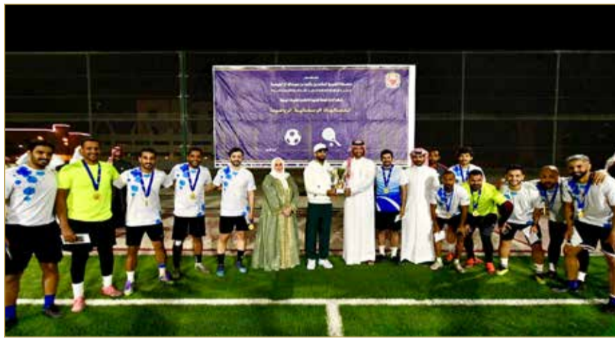
جانب من تكريم الفائزين