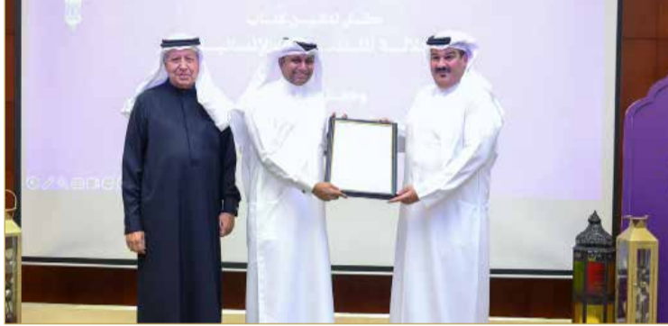
بالإنابة عن عصام بن عبدالله فخرو