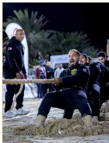
منافسات شد الحبل