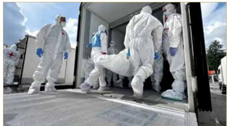
تبادل جنث بين روسيا وأوكرانيا

قد أعلنت في وقت سابق أن موسكو سلمت، منذ يونيو 2025، أكثر من 12 ألف جنثة لجنود من القوات المسلحة الأوكرانية لكيف، واستلمت من كييف جنث أكثر من 200 جندي روسي، مضيفة أنه تم إطلاق سراح أكثر من 4 آلاف شخص نتيجة 17 جولة من عمليات تبادل أسرى الحرب والمعتقلين بين روسيا وأوكرانيا، بوساطة الإمارات العربية المتحدة خلال العامين 2024 و2025.