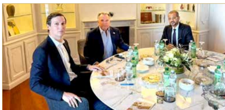
وزير الخارجية العماني بدر البوسعيدي يلتقي بالمبعوثين الأميركيين ستيف ويتكوف وجاريد كوشنر

واستمرت نحو 3 ساعات، قبل توقف لساعات لإجراء مشاورات، واستؤنفت المفاوضات مساء الخميس وانتهت بعد نحو ساعة ونصف.