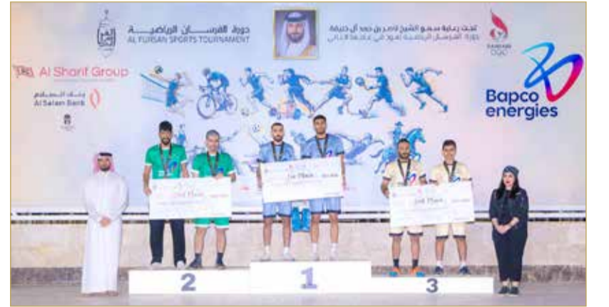
تتويج أبطال التيك بول