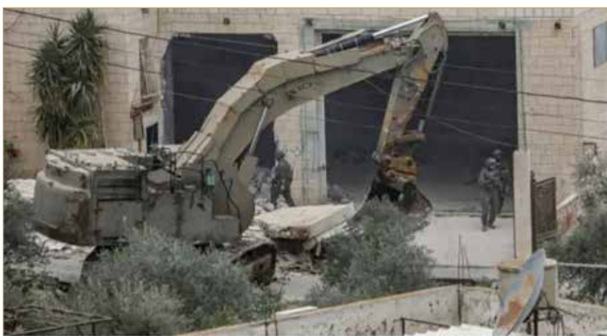
جنود إسرائيليون يهدمون منزلاً في الضفة الغربية المحتلة

في حين نددت بعثات 85 دولة في الأمم المتحدة بهذه الإجراءات التي وصفها منتقدوها بأنها ضم فعلي للأراضي الفلسطينية، وتقويض لحل الدولتين. وكانت أنشطة الاستيطان المستمرة منذ سنة 1967، تسارعت بشكل كبير في ظل حكومة بنيامين نتنياهو الحالية التي تعد من أكثر الحكومات يمينية في تاريخ إسرائيل، خاصة منذ بدء حرب غزة في 7 أكتوبر 2023.