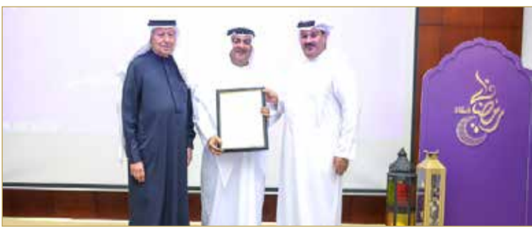
بالإنابة عن إبراهيم بن محمد زينل