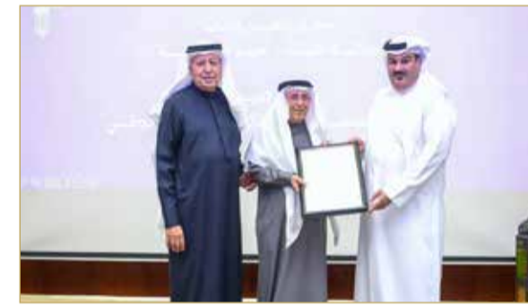
بالإنابة عن محمد بن فاروق المؤيد