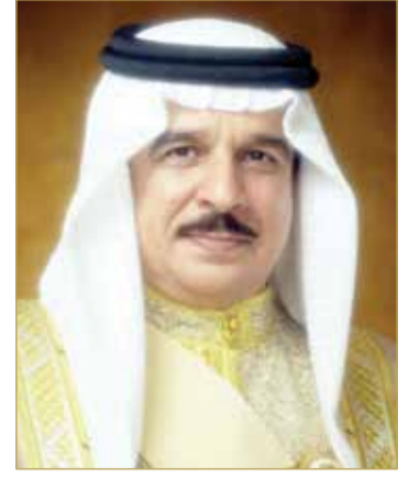
ملك البلاد المعظم