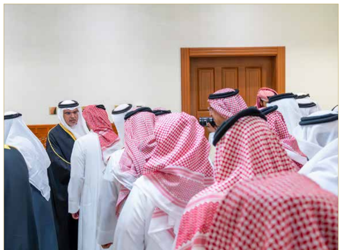
سمو ولي العهد رئيس الوزراء يزور مجلس غانم بن فضل البوعينين