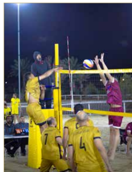
منافسات الكرة الطائرة