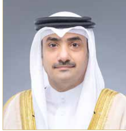
الشيخ عبدالله بن خليفة

وأضاف: "واصلت شركات النمو الرقمي توسيع نطاق أعمالها من خلال الابتكار المستهدف والشراكات الإستراتيجية. فقد عززت Beyon Cyber دمج تقنيات الذكاء الاصطناعي عبر محفظة خدماتها المدارة، وتكثفت هذه الجهود بإطلاق Orpyx AI، وهي منصة عمليات أمنية ذاتية التشغيل تم تطويرها في مختبرات Beyon Cyber. كما عززت Beyon Connect دورها في تمكين