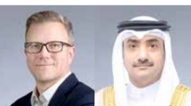
الشيخ عبدالله بن خليفة أندرو كالمسيث