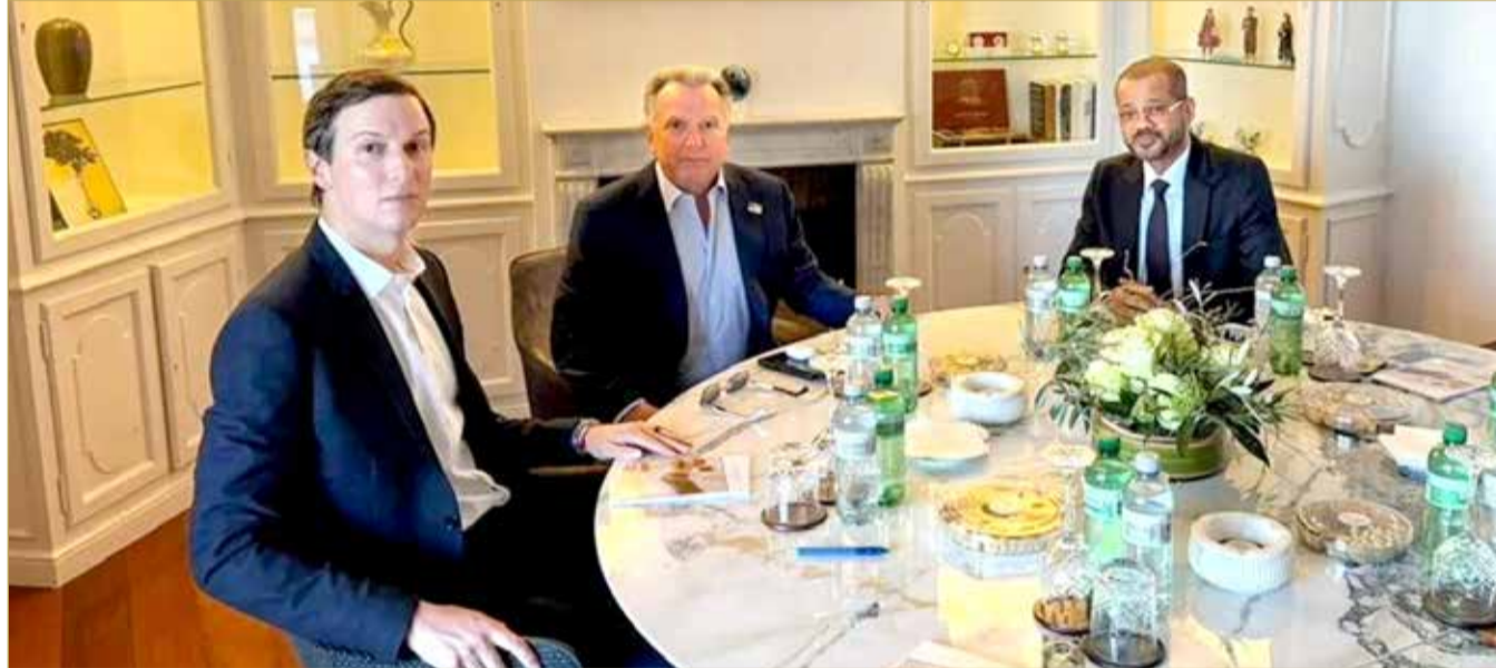
وزير الخارجية العماني بدر البوسعيدي يلتقي بالمبعوثين الأميركيين ستيف وبتكوف وجاريد كوشنر

عن مخزونها البالغ نحو 10 آلاف كيلوغرام من اليورانيوم المخصب. وأشارت المصادر إلى أن واشنطن أبدت استعداداً لإظهار قدر من المرونة بشأن مطلب طهران الاحتفاظ بحق تخصيب اليورانيوم، شرط إثبات عدم وجود مسار نحو تصنيع سلاح نووي وفقاً لموقع "أكسيوس". من جهتها، ذكرت شبكة "سي إن إن"، أن المحادثات ركزت على ردم الفجوات بشأن ملف التخصيب. وقال مصدر مطلع للشبكة إن المفاوضات الأميركية أصروا خلال الجولة غير المباشرة في جنيف الخميس على تقييد تخصيب إيران لليورانيوم، مع ضمان آليات تحقق طويلة الأمد لبرنامجها النووي. ووفق المصدر، قدمت إيران مقترحات مفصلة لمعالجة المخاوف الأميركية بشأن أنشطتها النووية، إلى جانب أفكار تستجيب لمطالب واشنطن. ونقلت "سي إن إن" من مصادر مطلعة أن طهران كانت تستعد لطرح مقترح يقضي بتعليق التخصيب بين ثلاث وخمس سنوات، يعقبه انضمام إلى اتحاد إقليمي للتخصيب منخفض المستوى، مع السماح لمفتشين دوليين بمراقبة الانشاز. كما أشارت الشبكة إلى أن مسؤولين أميركيين أعربوا عن عدم وضوح موقف طهران في عدد من النقاط، وتساؤلات بشأن ما إذا كان المرشد الإيراني علي خامنئي سيوافق على أي صيغة اتفاق. وأوضحت "سي إن إن" أن المسؤولين الإيرانيين يدركون أن أي تفاهم يجب أن يسمح لترامب بإعلان تحقيق إنجاز يتجاوز اتفاق 2015، وهو ما يفسر طرح أفكار تتضمن تعاوناً اقتصادياً وإتاحة فرص استثمار وشراء سلع أميركية.