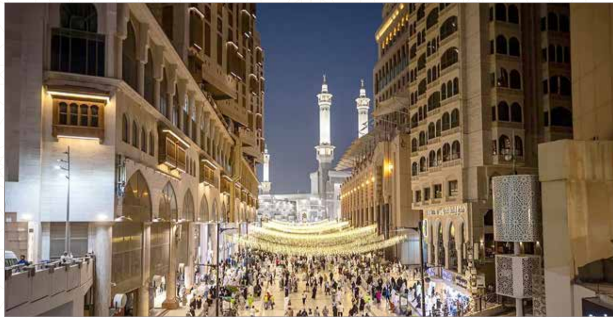
تستقبل شوارع مكة شهر رمضان المبارك بأجواء إيمانية مهيبه، تترنن فيها الأناور وتعالى روحانية المكان احتفاءً بقدم الشهر الفضيل. "واس"