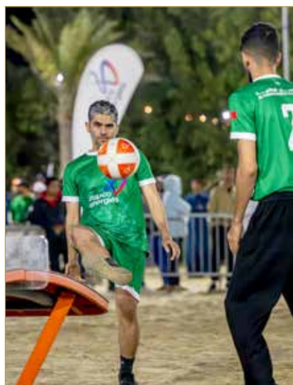
منافسات التيك بول