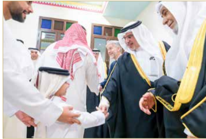
سمو ولي العهد رئيس الوزراء يزور مجلس غانم البوعيين