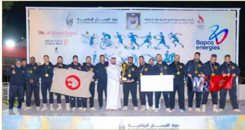
تتويج بطل شد الحبل