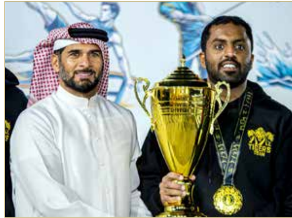
تتويج بطل شد الحبل