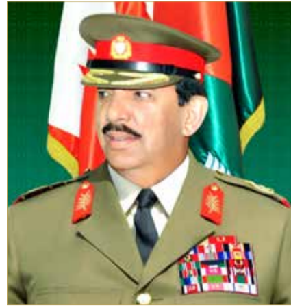
القائد العام لقوة دفاع البحرين

وقال: إن ما نشاهده من دقة واحترافية في سحق الهجمات المعادية، ليس إلا جزءا يسيرا من فيض القدرات الرادعة التي تمتلكها قوة دفاع البحرين، ونطمئن أهلنا في هذا الوطن العزيز، بأن سماءكم محاطة بدرع عصي على الاختراق، وبسواعد رجال لا تقمض لهم عين، استطاعوا تحويل صواريخ