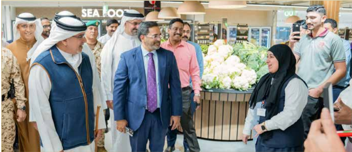
سمو ولي العهد رئيس الوزراء يقوم بزيارات ميدانية للأسواق التجارية