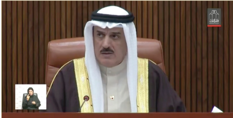
رئيس مجلس النواب

وسجل المجلس بالغ التقدير للموقف الشعبي المشرف والالتفاف الوطني حول راية الوطن وقيادته الحكيمة، وما أبداه المواطنون والمقيمون من روح وطنية عالية وتعاون مسؤول مع الجهات المعنية.