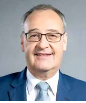
رئيس الاتحاد السويسري