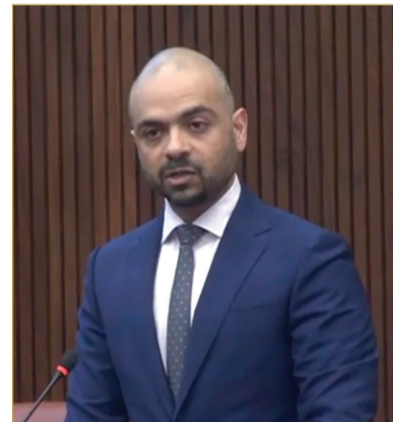
وزير التنمية الاجتماعية

وزير التنمية الاجتماعية أسامة العلوي، ردًا على سؤال النائب هشام العوضي بشأن المعايير التي تحدد نسب علاوة الغلاء والدعوم، أن جميع مستفيدي برنامج الضمان الاجتماعي بفئاتهم المحددة بموجب القانون يستفيدون تلقائيًا من الدعم المالي (علاوة الغلاء)، مبيّنًا أن معظمهم ضمن فئة 130 دينارًا شهريًا، إضافة إلى ما يستحقونه من مبالغ الضمان الاجتماعي. وأوضح أن أي تعديل على الفئات الثلاث لعلاوة الغلاء ينعكس تلقائيًا على مستفيدي الضمان الاجتماعي، مشيرًا إلى أن آخر زيادة كانت في ديسمبر 2025، إذ أصبحت الفئات 130 دينارًا و97 دينارًا و75 دينارًا شهريًا، وسبقها زيادة أخرى في يناير ضمن برامج الدعم. وبين أن قيمة المساعدة الاجتماعية ينظمها القانون رقم (18) لسنة 2006 وتعديلاته، الذي يهدف إلى تقديم مساعدات نقدية شهرية للأسر والأفراد