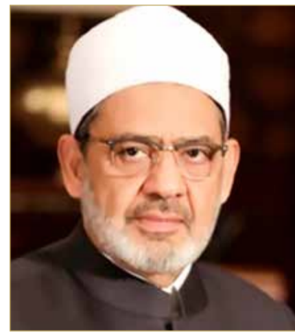
شيخ الأزهر الشريف