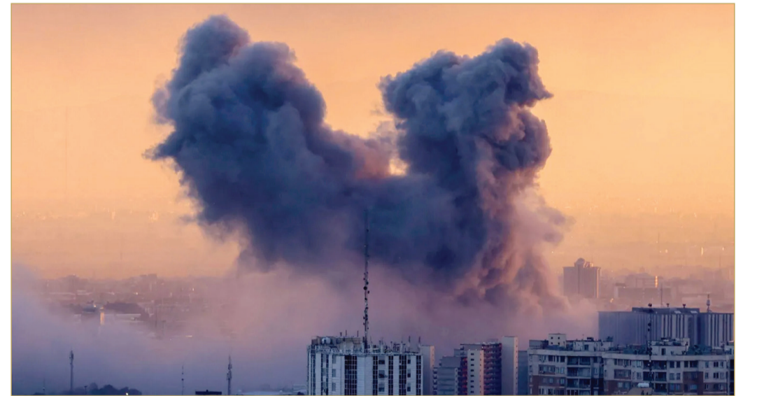
أعمدة الدخان تصاعدت بعد ضربة جوية على العاصمة الإيرانية طهران الثلاثاء "أ.ف.ب"

مشيراً إلى أنه لم يتضح بعد عدد أعضاء المجلس البالغ عددهم 88 الذين كانوا داخل المبنى لحظة الاستهداف، ولا حجم الأضرار التي لحقت به. وأضاف: "أردنا منهم من اختيار مرشد أعلى جديد. ويُعد مجلس خبراء القيادة الجهة المخولة داخل النظام الإيراني باختيار المرشد الأعلى، إذ يصوّت أعضاؤه من رجال الدين على قائمة مختصرة من المرشحين تُعدّها لجنة سرية أصغر. وكان المرشد الأعلى السابق علي خامنئي قد اغتيل، السبت، في الموجة الأولى من الضربات الإسرائيلية، إلى جانب عشرات من كبار القادة الإيرانيين.