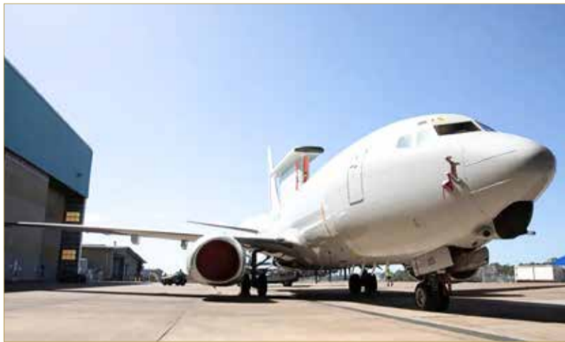
طائرة بوينغ E-7 ويدجتايل وهي طائرة إنذار مبكر وتحكم محمولة جواً

تعد شركة CASIC، وهي الوافد الجديد إلى المراكز الثلاثة الأولى لهذا العام، المجموعة الرائدة في مجال تكنولوجيا الصواريخ والفضاء في الصين. مع 38.7 مليار دولار من إيرادات الدفاع ومن إجمالي مذهل قدره 120.9 مليار دولار، تعكس شركة CASIC استثمارًا كبيرًا مستمرًا في القدرات الفضائية