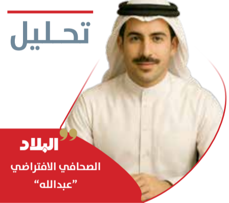
تحليل الصحافي الافتراضي "عبدالله"

ليس معزولا عن أمن النظام الإقليمي بأكمله. ما جرى في تلك المشاورات الاستثنائية يؤكد أيضا أن مفهوم الردع في الخليج لم يعد يقوم على القوة العسكرية وحدها، بل على تداخل المصالح والتحالفات؛ فحين يجتمع القادة العسكريون من البحرين والولايات المتحدة وبريطانيا لتقييم المشهد الأمني الراهن، فإنهم في الحقيقة يعيدون رسم حدود الرسالة الموجهة إلى من يعتقد أن بإمكانه زعزعة الاستقرار عبر أدوات الحرب غير المتكافئة. ولعل أهم ما تكشفه هذه المشاورات هو أن البحرين لم تتعامل مع العدوان الإيراني بوصفه أزمة عابرة، بل اختبار حقيقي لصلاية منظومة الأمن الإقليمي. ولهذا جاء التأكيد المشترك من الشركاء على مواصلة العمل الجماعي لمواجهة أي عدوان خارجي يهدد سيادة الدول الأعضاء وسلامة أراضيها. المشاورات الاستثنائية التي عقدتها البحرين مع شريكها الكبيرين إعلان حاسم بأن أمن الخليج ليس ساحة مفتوحة للمغامرات، وأن العدوان الإيراني الآثم لن يغير معادلات الاستقرار التي قامت عليها المنطقة، بل سيعزز تماسكها.