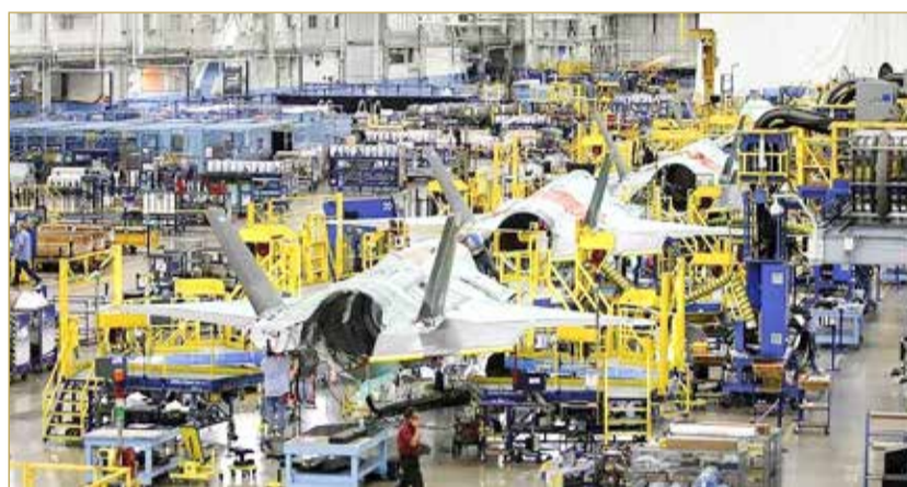
مصنع لوكهيد مارتن الرائدة في صناعة الطائرات

العقود العسكرية - حوالي 48% من إجمالي الإيرادات. ينتج الذراع الدفاعي للشركة طائرات مقاتلة وناقلات وطائرات هليكوبتر وأنظمة إطلاق فضائية، مما يوفر حلفاء عالميين متعددين. تظل برامج مثل ناقلة النفط KC-46A Pegasus وطائرة الدورية P-8 Poseidon أساسية لهوية بوينغ الدفاعية.