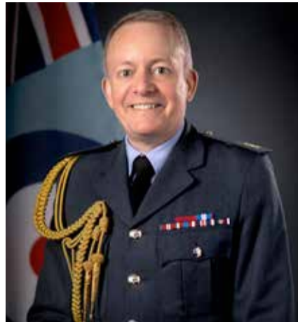
الفريق أول جوي السير ريتشارد نايتون