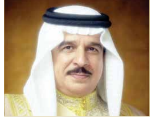
جلالة الملك المعظم

تلقي ملك البلاد المعظم حضرة صاحب الجلالة الملك حمد بن عيسى آل خليفة، حفظه الله ورعاه، اتصالاً هاتفياً من مسرور بارزاني رئيس وزراء إقليم كردستان العراق. وأعرب رئيس وزراء إقليم كردستان العراق خلال الاتصال عن تضامنه الكامل مع مملكة البحرين، ورفضه وإدانته للاعتداء الإيراني الذي استهدف أراضي المملكة، مؤكداً مساندة لمملكة البحرين في كل ما تتخذه من إجراءات وتدابير