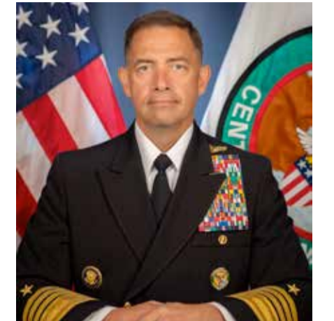
الأميرال براد كوبر

بالشراكة الاستراتيجية الفُرسخة في إطار اتفاقية "C-SIPA"، التي تُكرّس جملة من الالتزامات المشتركة الرامية إلى تعزيز التعاون الأمني والردع الجماعي في مواجهة التحديات الخارجية. وجدد الشركاء تأكيد الالتزام بمواصلة العمل المشترك لمواجهة أي عدوان خارجي يُهدد سيادة أي من الأعضاء وسلامة أراضيها، بما يعكس عمق الروابط التي تجمع الدول الأعضاء وتوافق رؤاها بشأن التدابير الأمنية الكفيلة بصون السلام والاستقرار في المنطقة.