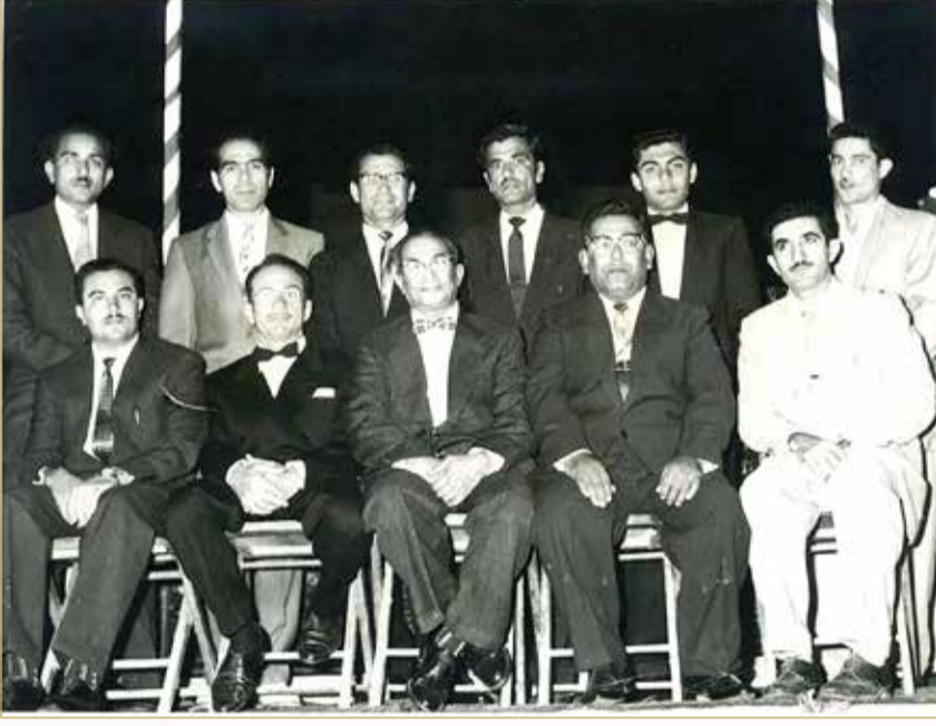
مجلس ادارة نادي الفردوسي