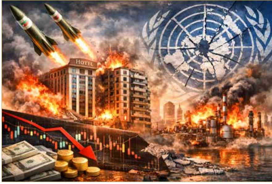
صورة تعبيرية بالذكاء الاصطناعي

وفي حالة البحرين، فإن الرسالة التي يبعثها هذا الحدث واضحة: الاعتداءات قد تحدث، لكن الدول التي تبني قوتها على الاستقرار والمؤسسات القوية قادرة دائمًا على احتواء الأزمات ومواصلة مسيرتها بثقة وثبات.