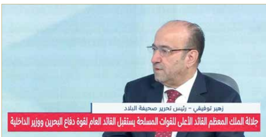
رئيس تحرير صحيفة "البلاد"

صاحب السمو الملكي الأمير سلمان بن حمد آل خليفة، الإدارة العامة للدفاع المدني بوزارة الداخلية، وعدها رسالة طمأنة للمواطن والمقيم، تؤكد حرص القيادة على توفير الأمن والأمان عبر التواصل المباشر مع مختلف القطاعات والمرافق، بما في ذلك مجمع السلمانية الطبي وأسواق "اللولو هايبر ماركت" في مجمع الدانة التجاري بمحافظة العاصمة؛ للتأكد من استقرار حركة الأسواق المركزية وضمان سير الحياة الطبيعية في المملكة. واختتمت توفيقى حديثه مؤكدا حرص المواطنين على الالتفاف حول القيادة الرشيدة في ظل الظروف الاستثنائية التي تمر بها المملكة نتيجة العدوان الإيراني الآثم، مشددا على تلاحم الجميع من أجل حماية الوطن وصون أمنه واستقراره.