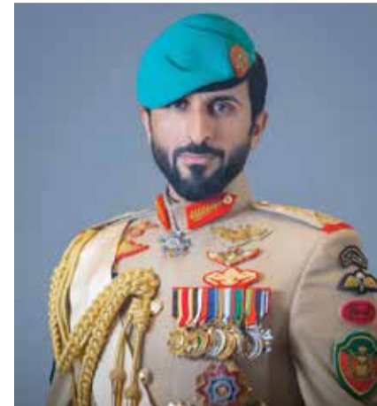
سمو الفريق الركن الشيخ ناصر بن حمد