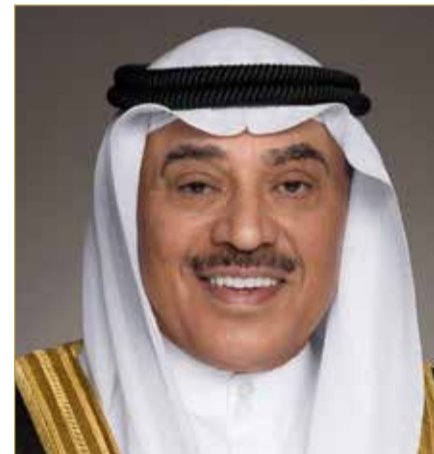
سمو ولي عهد دولة الكويت