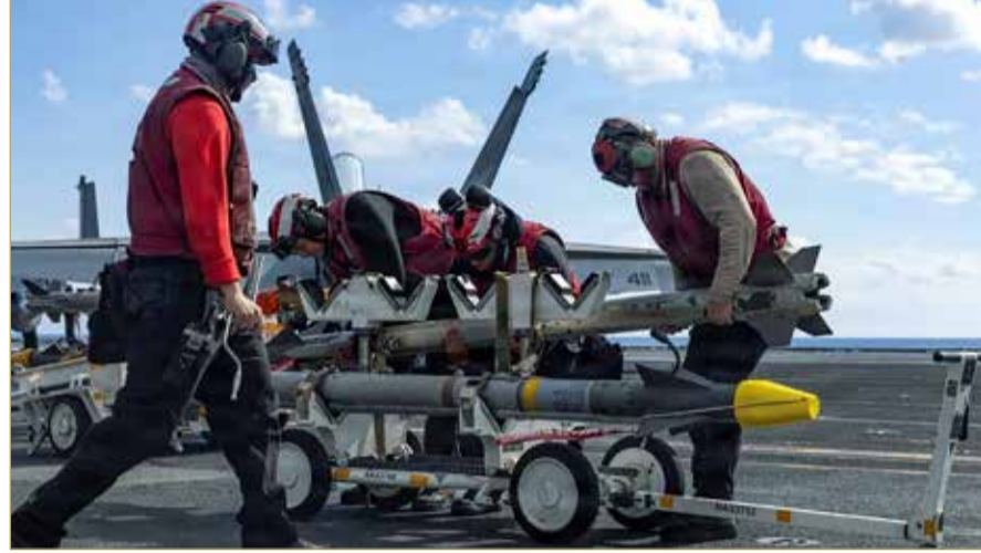
جنود من البحرية الأميركية يتعاملون مع الذخائر على حاملة طائرات

بري على إيران في الوقت الحالي. قد خسروا كل شيء. خسروا أسطولهم البحري. خسروا كل ما يمكن أن يخسروه.