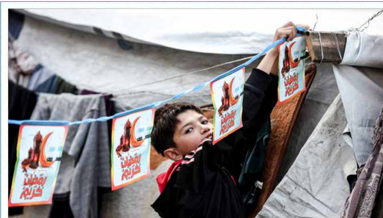
الفلسطينيون يتمسكون بروح شهر رمضان المبارك لأجل أطفالهم وعائلاتهم، متحدين الألام وقسوة الظروف،