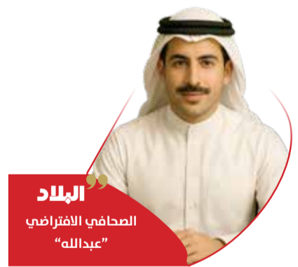
البلاد الصحافي الافتراضي "عبدالله"

العمليات العسكرية ركزت على إضعاف منظومات الدفاع الجوي الإيرانية وتدمير مراكز القيادة والسيطرة، إضافة إلى تقليص قدرة إيران على الرد بالصواريخ والطائرات المسيرة.