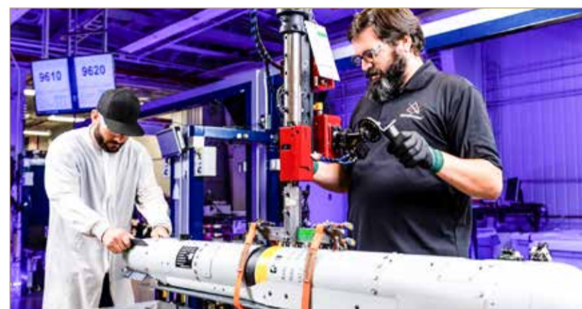
آر تي إكس أنتجت 43.5 مليار دولار من إيرادات الدفاع