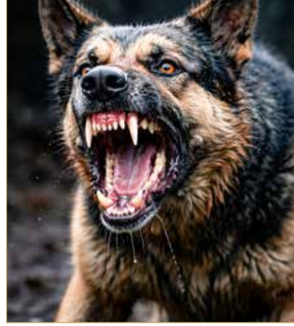
صورة تعبيرية باستخدام الذكاء الاصطناعي

لترخيص منشآت محددة، على أن يصدر الوزير قراراً يحدد شروط وإجراءات وضوابط الترخيص ومدته وآلية تجديده وحالات سحبه أو إلغائه. كما ينص المشروع على قيد المنشآت المرخص لها في سجل خاص، وتسجيل الحيوانات الخطرة في سجل منفصل. ويلزم المشروع المنشآت المرخص لها بمجموعة من الالتزامات، من بينها تسجيل الحيوانات، وتوفير الرعاية البيطرية والتحصينات اللازمة، وتأمين أماكن إيواء آمنة ومناسبة، واتخاذ الاحتياطات لمنع الفقد أو الهروب، وعدم ترك الحيوانات دون مراقبة، وتوفير الغذاء اللائم. كما يقيد نقل حيازة الحيوان الخطر إلى منشأة أخرى دون موافقة مسبقة، ويحظر تنظيم معارض أو منافسات أو عروض تتعلق بهذه الحيوانات من دون تصريح. ويشترط المشروع الحصول على موافقة مسبقة لنقل الحيوانات داخل المملكة أو عبورها، على أن يتم النقل بوسائل آمنة تستوفي