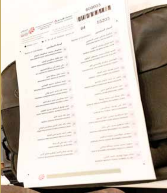
نموذج من ورقة التصويت

وجود فحص مادي ويؤدي للأوراق قبل إدخالها للأجهزة للتأكد من خلوها من أي كتابة أو علامات، بالإضافة إلى برمجة الأجهزة للتأكد من صحة الأوراق.