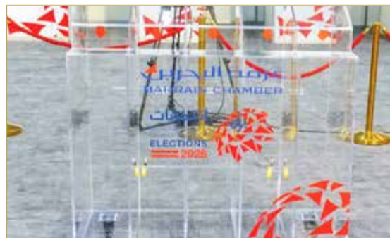
صندوق الاقتراع جاهز

البلاد | علي الفردان