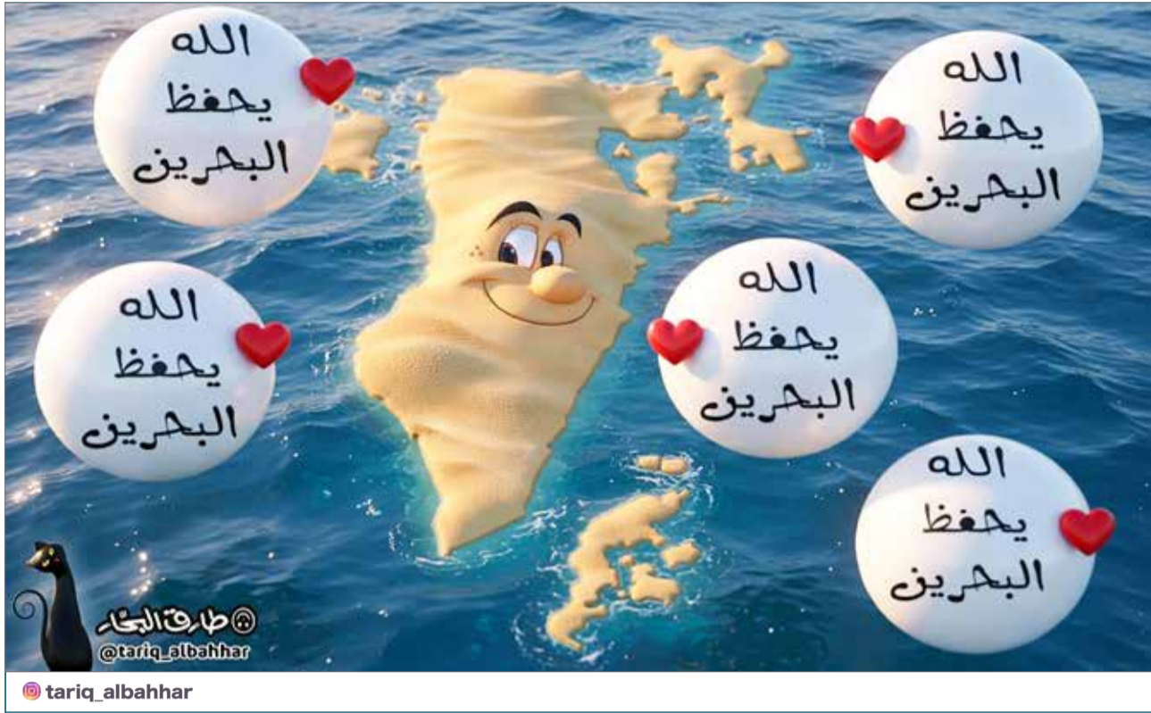
البلاد | كاريكاتير طارق البحار

فيبعد ظهورها المهيب فوق برج إيغل في افتتاح أولمبياد باريس 2024، تزايدت المؤشرات التي تؤكد أن النجمة الكندية باتت على أعتاب عودة كاملة للمواجهة المباشرة مع جمهورها.