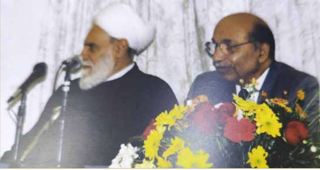
الشيخ محمد شمس الدين بمحاضرة في نادي العروبة بأكتوبر 1999