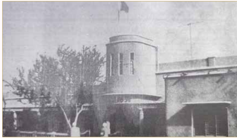
واجهة المقر السابق لنادي العروبة

البلاد عندما نستعرض تاريخ الأندية البحرين وبدايات تأسيسها، علينا أن نقسمها إلى قسمين: قسم رياضي، وقسم أدبي واجتماعي. وحسب ما جاء في وثائق ذكرها تقي محمد البخارنة في كتبه الثلاثة: نادي العروبة: خمسون عاما (1939 - 1989م) - نادي العروبة: ستون عاما في خدمة الثقافة والمجتمع (1939 - 1999م) - 75 عاما من العطاء فإن هذه الكتب الثلاثة تمثل كنزا من المعلومات الفنية والنادرة. وكما نتمنى أن يطلع عليها طلبة الجامعات، خصوصا دارسي التربية الرياضية؛ لما تمثله من مادة علمية مهمة قد تسهم في دراساتهم العليا بشأن تاريخ الأندية في البحرين.