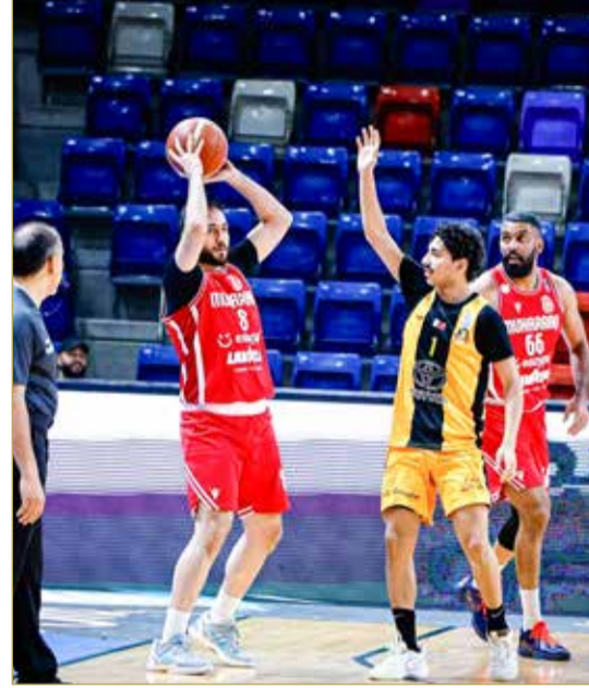
لقاء المحرق والأهلي

الفريق يفقد توازنه سريعًا، الأمر الذي صعب عليه مجاراة إيقاع المحرق.