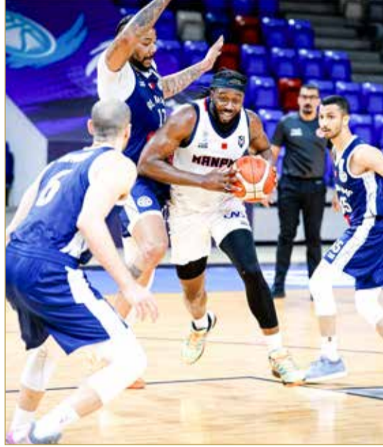
لقاء المنامة والنجمة

ومع انتقال السلسلة إلى الجولة الثانية، تبدو صورة المواجهتين مختلفة، فالمحرق يملك أفضلية واضحة تقربه من النهائي، بينما يبقى الصراع بين النجمة والمنامة مفتوحًا على كافة السيناريوهات.