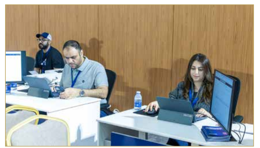
عملية تسجيل الناخبين قبل استلام أوراق التصويت

للمجلس إدارة غرفة تجارة وصناعة البحرين، أن التاجر أو صاحب السجل التجاري مطالب فقط بإحضار البطاقة الشخصية لإثبات الهوية؛ إذ تم سابقا إعلان السجلات التي يحق لها التصويت، خصوصا المسددين لعضويتهم. وذكر أن ممثلي الشركات المساهمة، الذين يكونون في الغالب من أعضاء مجلس الإدارة، يحضرون بصفتهم ممثلين قانونيين لاستلام الأوراق والتصويت.