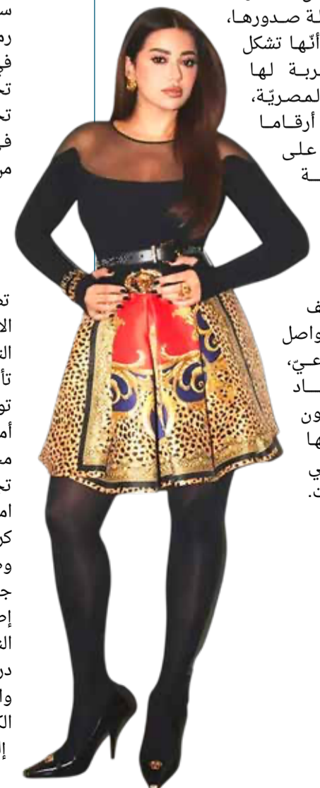
البلاد | طارق البحار

حققت شارة مسلسل "حكاية نرجس" بعنوان "تستتوا ايه" للنجمة العراقية رحمة رياض، انتشاراً لافتاً منذ لحظة صدورها، خصوصاً أنها تشكل أول تجربة لها باللهجة المصرية، مسجلة أرقاماً مرتفعة على منصة "يوتيوب" وزخماً واسعاً عبر مختلف منصات التواصل الاجتماعي، إذ أعاد المستخدمون استعمالها بكثرة في الفيديوهات.