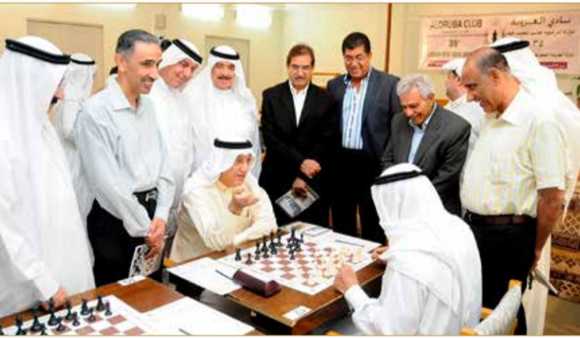
من فعاليات نادي العروبة