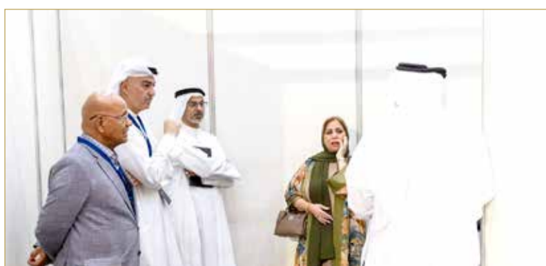
لجنة الانتخابات في نقاش مع جمعية الشفافية

وتغطي داخل القاعة وخارجها منذ انطلاق التصويت حتى نهايته في الساعة العاشرة مساء. (اقرأ الموضوع كاملا بالموقع الإلكتروني).