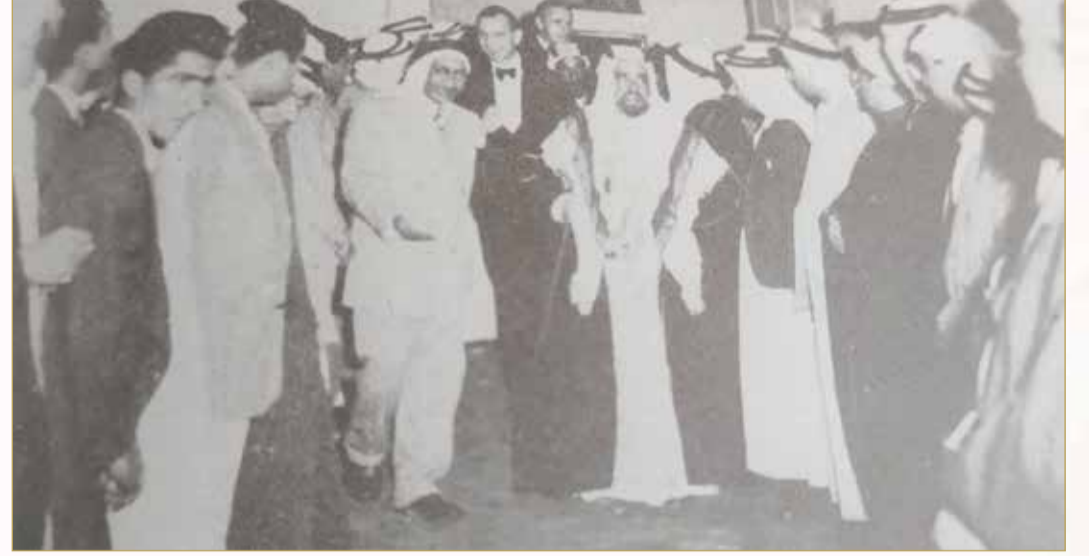
صاحب العظمة المغفور له الشيخ سلمان بن حمد آل خليفة ممتنحا مقر نادي العروبة في العام 1954