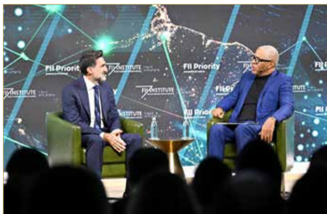
محافظ صندوق الاستثمارات العامة يتحدث في جلسة حوارية بقمة ميامي

وتطرق الرميان إلى دور الذكاء الاصطناعي، مؤكداً أنه يمثل أداة لتعزيز الكفاءة وليس هدفاً بحد ذاته، مشيراً إلى أن المملكة تمتلك مقومات قوية للاستفادة من هذه التقنية، تشمل توفر الطاقة والبنية التحتية والبيئة التنظيمية الداعمة.