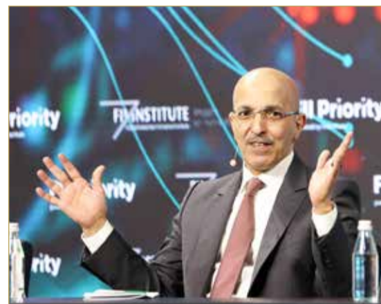
وزير المالية السعودي يتحدث في جلسة حوارية بقمة ميامي

”الرميان: صندوق الاستثمارات يرسخ استراتيجية طويلة الأجل ويستعد لمرحلة جديدة“