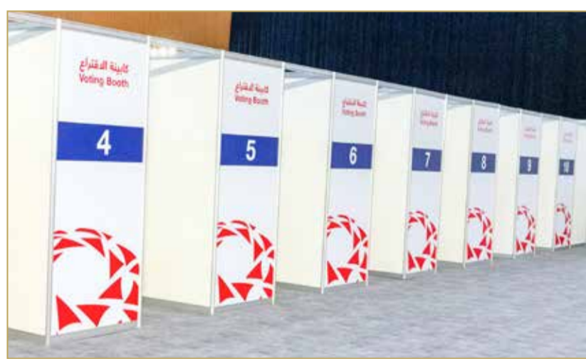
عدد كبير من كابينات الاقتراع

وأشار إلى التعاون المستمر مع الجمعية البحرينية للشفافية التي تشرف على العمل، والاعتماد على فريق المتطوعين المنظمين الذين تم توجيههم وتوزيعهم على القاعات الثلاث ضمن العملية الانتخابية، لافتا إلى أن جزءا كبيرا منهم يمتلك خبرة من العمل في الدورة السابقة قبل أربع سنوات، وختم مؤكدا حضور وزارة التجارة وجمعية المحامين للإشراف على العملية بأكملها.