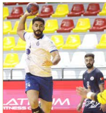
لقاء الديبر والتضامن

هذا الفوز يعد الرابع عشر للأهلي والذي رفع من خلاله رصيده إلى (44 نقطة) في المركز الثالث، أما