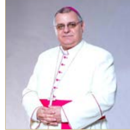
المطران آدو بيراردي

وفي ذات السياق، يتجلى في هذه الزيارة تقدير سموه للجالية الكاثوليكية المقيمة في البحرين، وفي هذا الجانب يقول المطران بيراردي: "سموه أكد دعم البحرين لإقامة القديس والأنشطة الدينية في الكنائس، علاوة على أهمية الصلاة من أجل السلام والاستقرار والتعايش الأخوي في المنطقة، في ظل ما يشهده العالم من تحديات تتطلب مزيداً من التقارب بين الشعوب والثقافات"، فيما جاء مسك ختام الزيارة بتعبير القائمين على الكنيسة عن امتنانهم لسموه على هذه اللقطة الكريمة التي جسدت اهتمام القيادة في البحرين بكل مكونات المجتمع، ورسخت رسالة المملكة القائمة على الحوار والتعايش والاحترام بين الأديان.