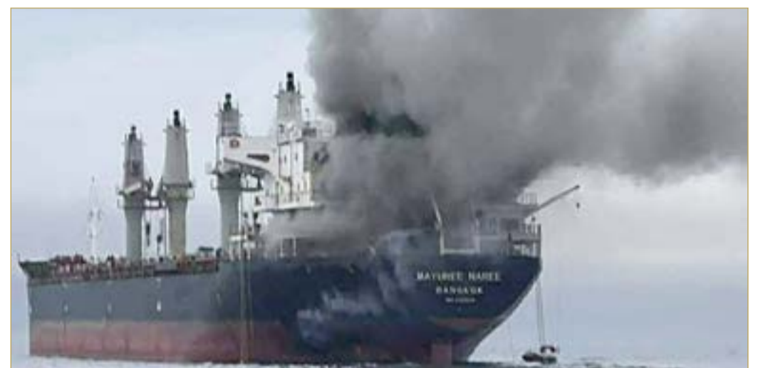
دخان يتصاعد من ناقله تالاندية تعرضت لهجوم بمضيق هرمز

أعلنت "المنظمة البحرية الدولية"، الخميس، عقد اجتماع طارئ، الأسبوع المقبل، لمناقشة التهديدات التي تواجه الملاحة في الشرق الأوسط، ولا سيما في مضيق هرمز.