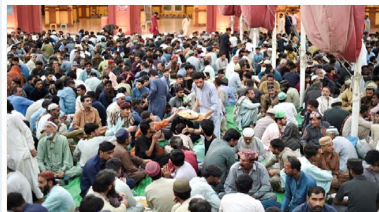
آلاف المسلمين يحتشدون في مسجد 'هامين' لتناول وجبة الإفطار، حيث يقوم المتطوعون بتوزيع الوجبات في شهر رمضان المبارك.

تتحول المماشي والسواحل والحدائق العامة في مختلف محافظات مملكة البحرين خلال شهر رمضان المبارك إلى وجهة رئيسية للأهالي والزوار، حيث يرتسم مشهد حضاري يعكس تنامي الوعي المجتمعي بأهمية النشاط البدني. ومع حلول ساعات المساء، وقبل أذان المغرب، نشاهد في مسارات المشي في "دوحة عراد" بساحل المحرق، وممشى "ساحل الاستقلال"، وكورنيش الفاتح وسترة، الممارسين من مختلف الفئات العمرية، في ظاهرة صحية تجمع بين تعزيز اللياقة البدنية والاستمتاع بالأجواء الرمضانية البحرينية التي