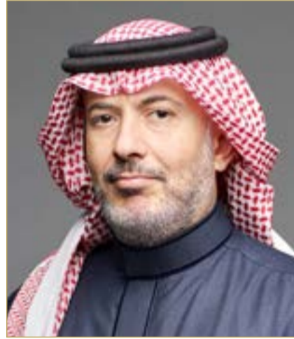
الشيخ خليفة بن إبراهيم