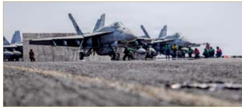
تواصل مجموعة حاملة الطائرات أبراهام لينكولن دعم عملية الغضب الملحمي

الجوية والبحرية على السواء. ولفتا إلى أن طهران لا تملك أية منظومة مضادة للطائرات. هذا وأكد قبل ذلك أمس أيضاً أنه "لم يعد هناك شيء لاستهدافه في الداخل الإيراني"، غير أنه استبعد توقف الحرب في الوقت الحالي، مشدداً على وجوب الانتهاء بشكل مضمون من التهديد الإيراني في المنطقة.