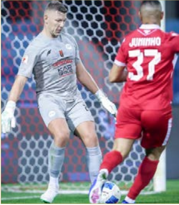
لقاء المحرق والرفاع