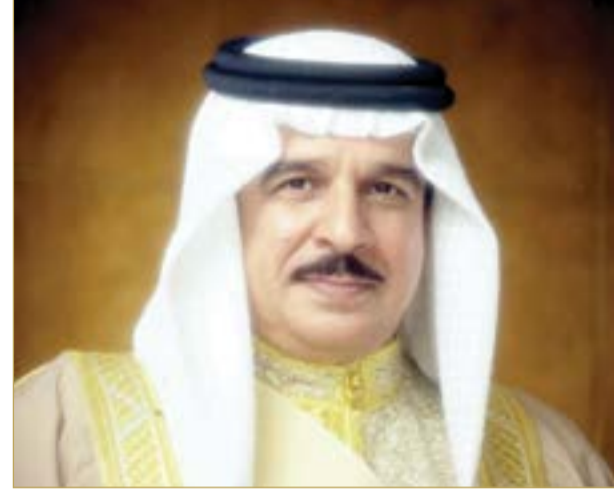
جلالة الملك المعظم