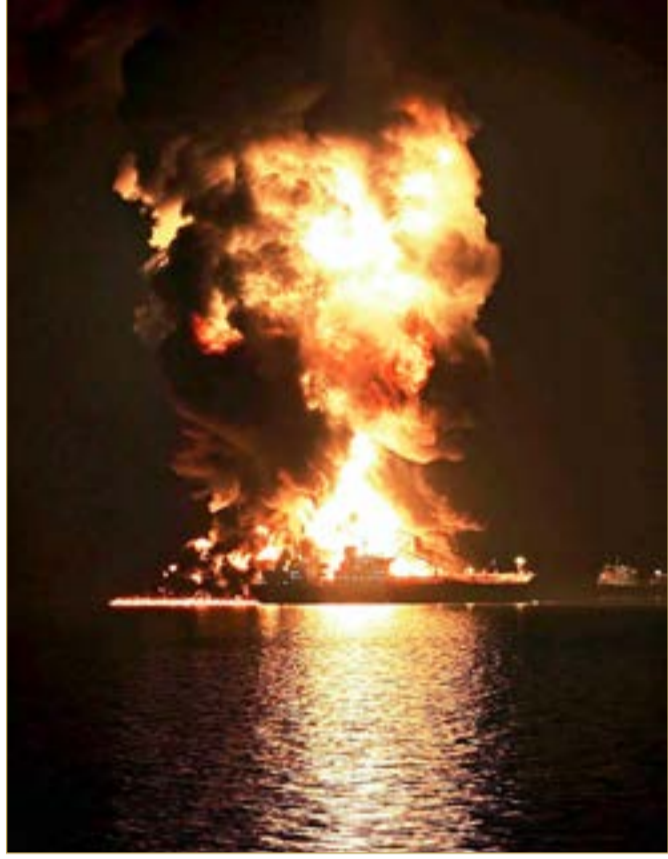
النيران تشب في ناقلة نفط بعد تعرضها لهجوم إيراني بميناء خور الزبير قرب البصرة بالعراق "أ.ب"

العسكرية. وقال رئيس الوزراء الإسرائيلي بنيامين نتنياهو إن إيران لم تعد كما كانت بعد الضربات الأميركية الإسرائيلية المشتركة، مشيراً إلى أن البنية العسكرية الإيرانية تلقت ضربات موجعة خلال الأيام الماضية، كما امتد التصعيد إلى الساحة اللبنانية، حيث شن الجيش الإسرائيلي غارات على بيروت، وأعلن اغتيال قيادي في قوة الرضوان التابعة لحزب الله، في وقت لُوحت فيه إسرائيل بإمكانية توسيع عملياتها العسكرية داخل لبنان. اقتصادياً، حذرت وكالة الطاقة الدولية من أن الحرب الجارية تسببت في أكبر اضطراب لإمدادات النفط في تاريخ السوق العالمية، مشيرة إلى أن إنتاج دول الخليج انخفض بما لا يقل عن 10 ملايين برميل يومياً نتيجة تعطل بعض طرق الشحن والتوترات الأمنية.