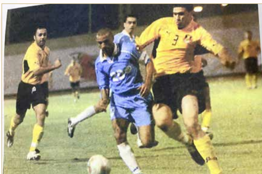
"الرفاع" ضد "الأهلي" في كأس ولي العهد 2004 - 2005