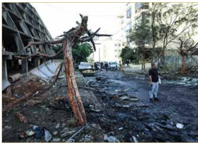
رجل يقف في موقع غارة إسرائيلية في بيروت

واستهدفت المقاتلات الإسرائيلية منزلاً في المنطقة بين بلدي كفرا وصرين قرب مركز للهيئة الصحية الإسلامية مما أدى إلى اشتعال سيارة إسعاف كانت بجانب المنزل دون وقوع إصابات، واستهدفت غارة بلدة برعشيت الجنوبية، كما استهدفت غارة مماثلة بلدة صريفا، وقامت طائرات مروحية إسرائيلية من نوع أباتشي بتمشيط ساحل بلدة البيضاء بالأسلحة الرشاشة وأطلقت صواريخ باتجاه المنطقة، حسب ما أعلنت "الوكالة الوطنية للإعلام" اللبنانية الرسمية. (اقرأ الموضوع كاملاً بالموقع الإلكتروني)