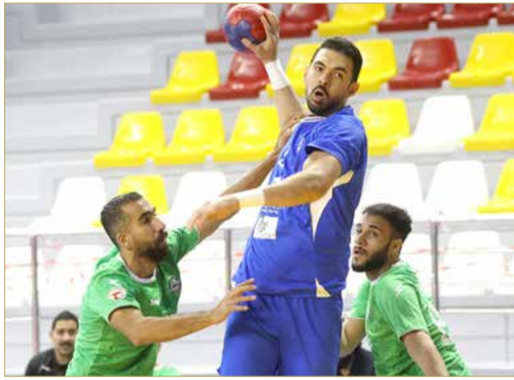
لقاء الدير والبحرين

نقطة) في المركز الأول، والتضامن صار رصيده (34 نقطة) في المركز السادس.