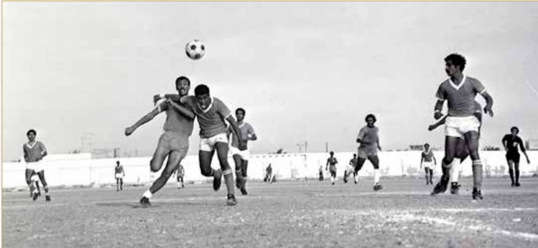
مباراة لكرة القدم بين نادي الرفاع ونادي الحالة في ديسمبر 1975م