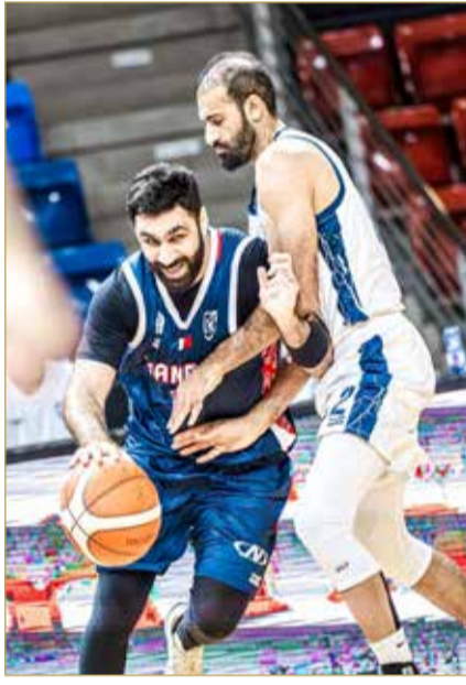
لقاء سابق بين المنامة والنجمة