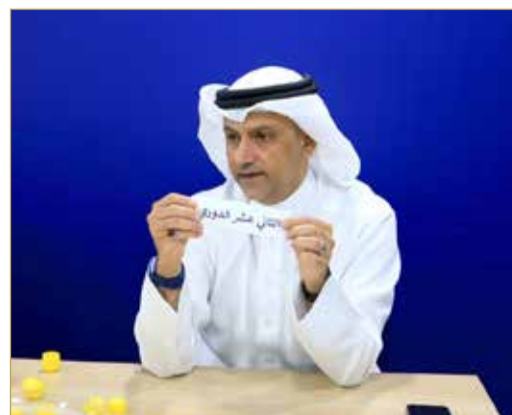
جانب من مراسم القرعة

الطائرة ونظراً للظروف الراهنة في الوقت الحالي ومشاركة منتخبنا بدورة الألعاب الخليجية بشهر مايو المقبل تم اعتماد نظام إخراج المغلوب لجميع