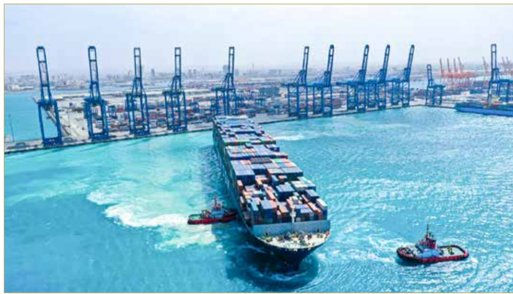
ميناء جدة الإسلامي

وتعكس هذه التحركات تكامل الأدوار بين الموانئ والقطاع اللوجستي، في وقت تتحول فيه السعودية إلى محور رئيس لإمدادات الخليج، مدعومة ببنية تحتية متطورة وسياسات تشغيلية مرنة، قادرة على امتصاص صدمات الأزمات الإقليمية وإعادة توجيه حركة التجارة بكفاءة عالية.