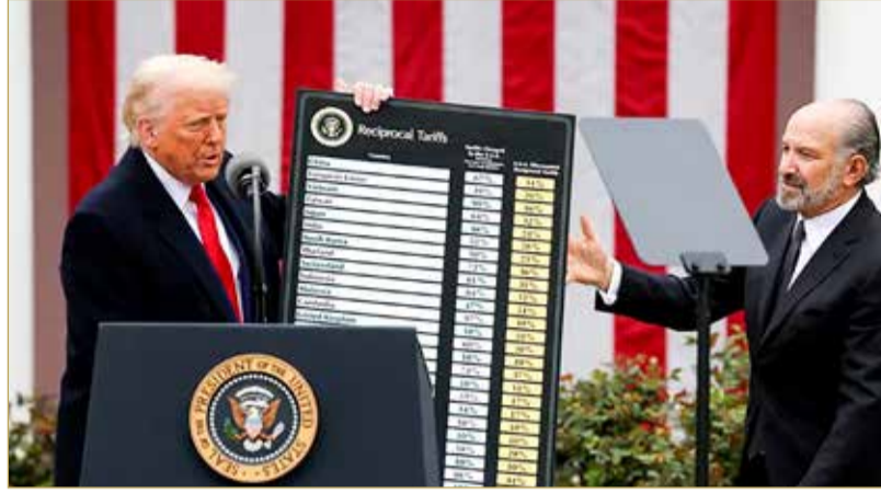
الرئيس الأمريكي دونالد ترامب ولائحة الرسوم الجمركية (أرشيفيه)

من قانون التجارة لعام 1974، على أن تطبق هذه النسبة على الأسعار التي يدفعها العملاء الأميركيون. ولم يتضح على الفور كيف سيتم تحديد سعر البيع والرسوم الناتجة عنه. وقال المسؤول إن بعض المستوردين كانوا يدعون قيمة منخفضة للواردات لتقليل تكاليف الرسوم الجمركية. وتشمل التغييرات التي أعلن عنها المسؤول في إدارة ترامب إلغاء الرسوم الجمركية السابقة البالغة 50% على المنتجات المشتقة المصنوعة من الصلب والألمنيوم والنداس إذا كان محتوى المنتج من المعادن أقل من 15% من حيث الوزن.