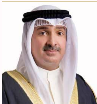
سمو الشيخ خالد بن محمد