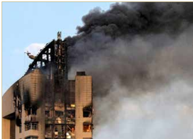
الدخان يتصاعد من أحد المباني في الكويت جراء الهجمات الإيرانية

وقال مكتب أبوظبي الإعلامي، في بيان، أن الحادث أسفر عن وفاة شخص من الجنسية المصرية أثناء عملية إخلاء الموقع، إضافة إلى إصابة 4 أشخاص