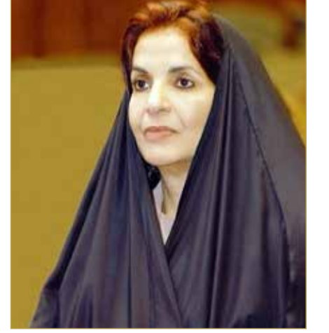
صاحبة السمو الملكي الأميرة سبيكة بنت إبراهيم