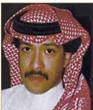
الشيخ عبدالله بن عيسى