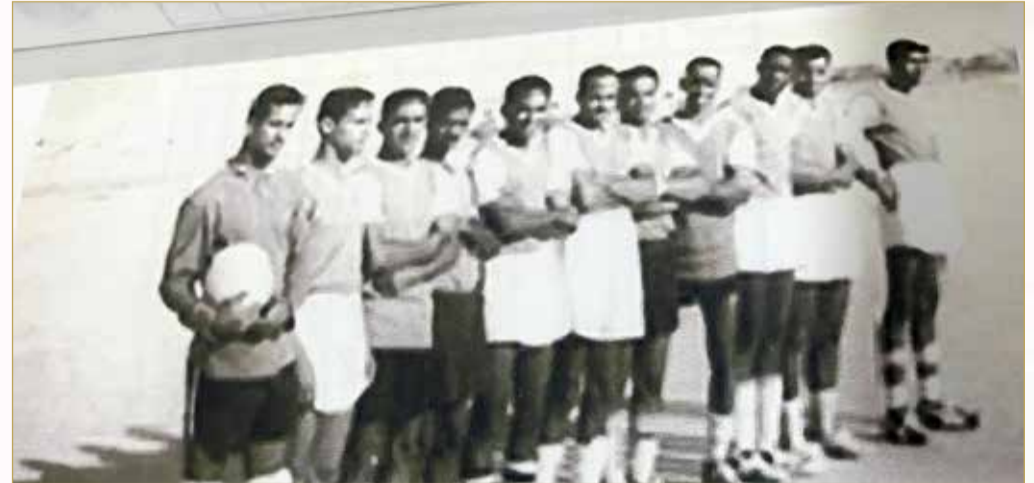
الفريق الأول لنادي الرفاع بالعام 1963م