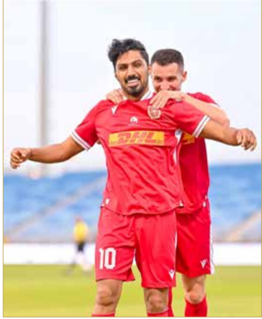
فرحة المالدو بهدف الثاني للمحرق