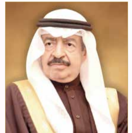
سمو الأمير الراحل خليفة بن سلمان