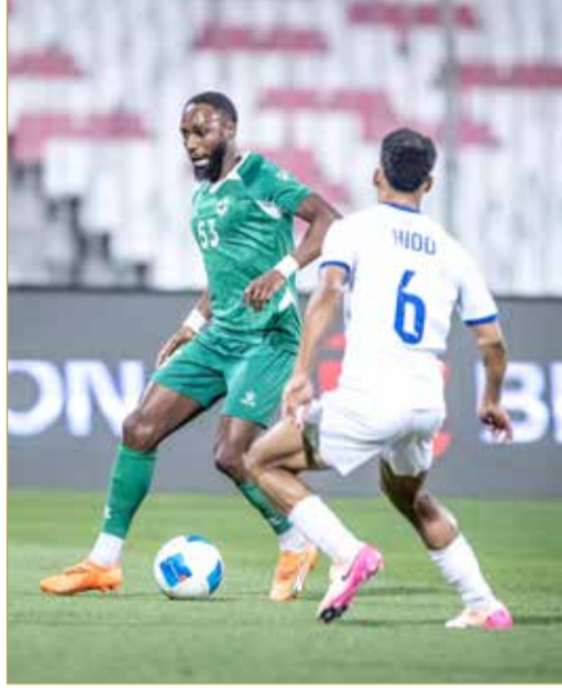
مباراة الحدوالبديع من الجولة 17

مدينة خليفة الرياضية. ففي اللقاء الأول المرتقب، يستهدف كلا الفريقين نقاط الفوز ولا سواها، حيث الخالدية برصيد (39 نقطة) يريد ذلك لمواصلة صدارة الترتيب وخصوصاً أن التعثر في هذه المراحل الأخير بمثابة مفترق طرق وخصوصاً أن ملاحظته يتربصون بموقعه المتقدم، والرفاع الذي يمتلك (34 نقطة) هو الآخر الفوز اليوم يعني له الكثير وقد يبقيه في دائرة المنافسة على لقب الدوري، فيما الخسارة تبعده كثيراً عن منافسيه المتصدر والوصيف.