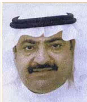
الشيخ خالد بن خليفة