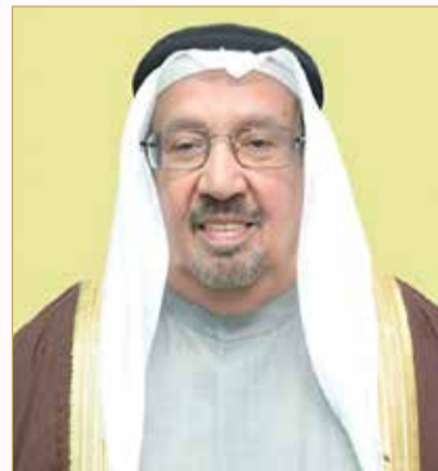
سمو الشيخ إبراهيم بن حمد