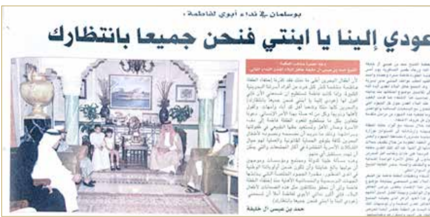
خبر صحفي في سبتمبر 2002 لاستقبال جلالة الملك المعظم لعائلة الطفلة فاطمة