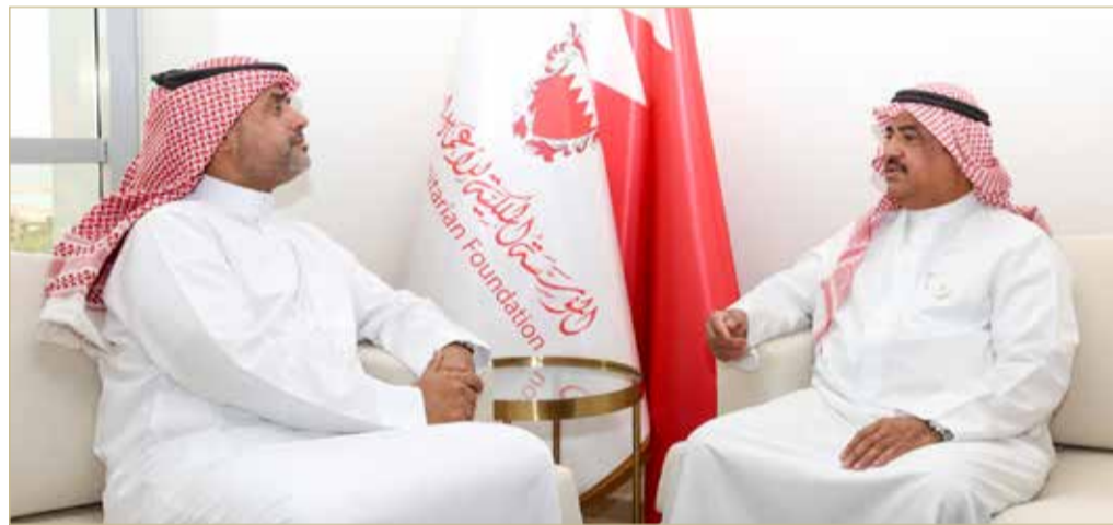
القائم بأعمال الأمين العام للمؤسسة الملكية للأعمال الإنسانية متحدثاً لـ «البلاد»

ومن أبرز هذه المبادرات مشاركة الفريق في إعداد مائدة الإفطار الجماعي للمقيمين في أحد مراكز الإيواء في مملكة البحرين، حيث تناولوا الإفطار معهم في أجواء إنسانية تعكس روح التكافل والتراحم المجتمعي خلال شهر رمضان المبارك. كما قامت سموها بتقديم مجموعة من الهدايا للأطفال المتواجدين في مركز الإيواء، بهدف إدخال البهجة والسرور إلى قلوبهم ومشاركتهم الأجواء الرمضانية. (اقرأ الموضوع كاملاً بالموقع الإلكتروني)