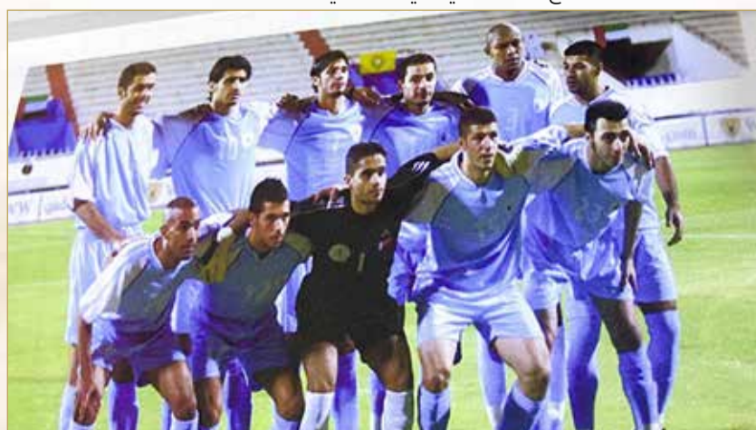
الفريق الأول لنادي الرفاع بالعام 2005