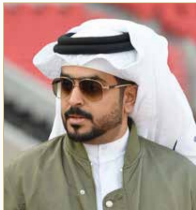
الشيخ عبدالله بن خالد