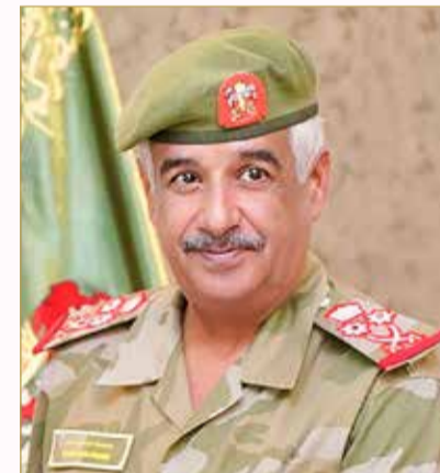
سمو الشيخ محمد بن عيسى