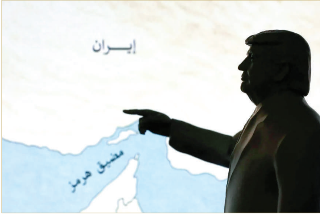
نموذج مصغر مطبوع بتقنية الطباعة ثلاثية الأبعاد يصور ترامب مع خريطة توضح مضيق هرمز

«إذا لم تفتح طهران مضيق هرمز بنهاية المهلة سنستهدف محطات الكهرباء والجسور