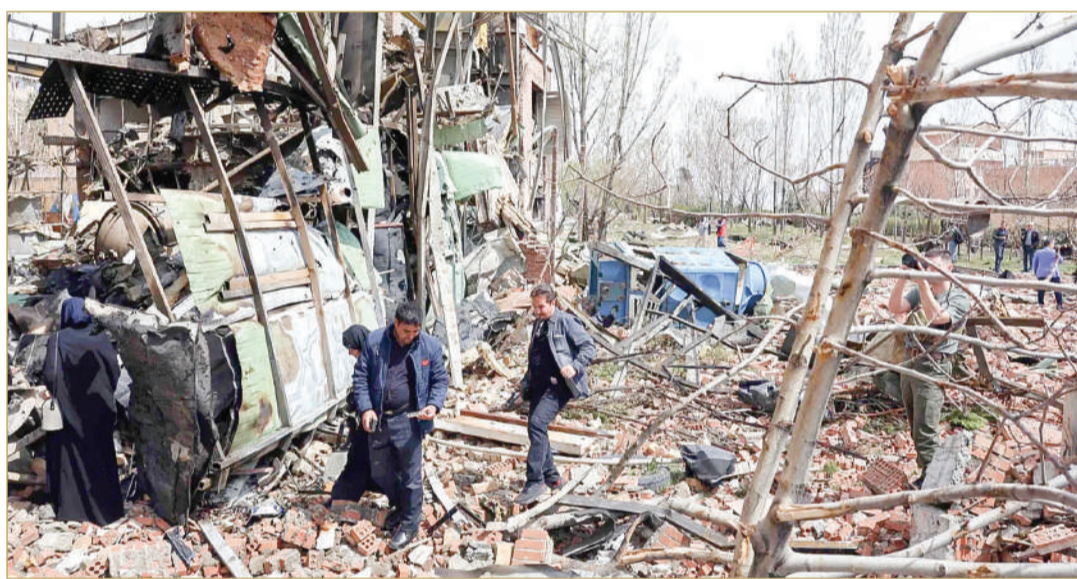
مباني مدمرة حول مبنى جامعة شهيد بهشتي في طهران

ملاحقة القادة الإيرانيين وقتلهم، واستهداف المنشآت الحيوية، في حال واصلت إيران هجماتها على إسرائيل. وقال كاتس في بيان مصور "طالما استمر إطلاق الصواريخ واستهداف المدنيين الإسرائيليين، ستدفع إيران ثمناً باهظاً سيؤدى... إلى شل البنية التحتية الوطنية وقدرات النظام التشغيلية". كما أضاف أن إسرائيل "ستواصل، في الوقت نفسه، ملاحقة وتحييد القادة، وضرب الأهداف الأمنية والموارد الاستراتيجية في جميع أنحاء إيران".