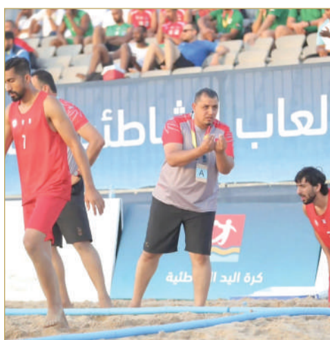
مدرب منتخبنا الوطني لكرة اليد الشاطئية

مؤكداً أن المنافسة في هذه المرحلة ستكون أكثر صعوبة، خصوصاً مع وجود منتخبات بارزة في المجموعة الأخرى مثل قطر وعمان والأردن وباكستان، وهي منتخبات تمتلك خبرات كبيرة في اللعبة؛ ما يجعل المواجهات معها مفتوحة على جميع الاحتمالات.