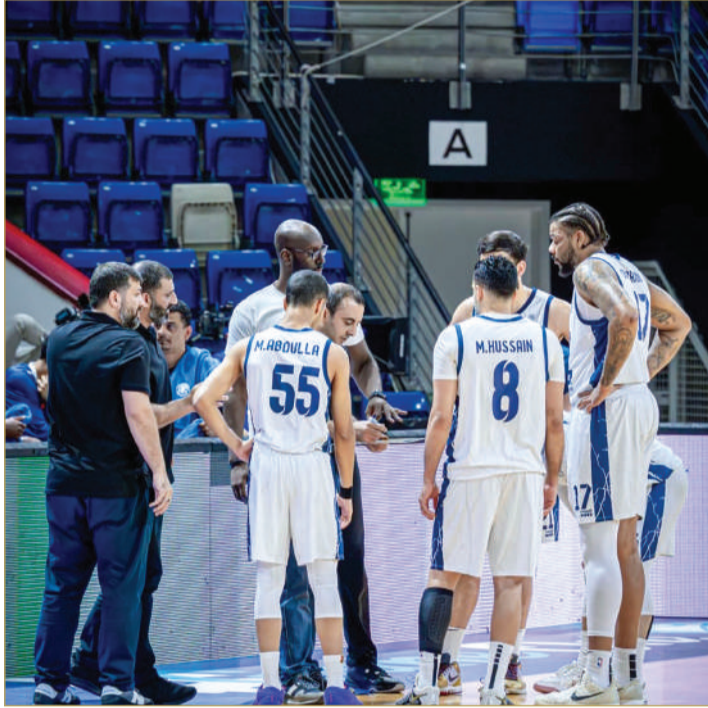
فريق النجمة لكرة السلة

ويحتاج إلى عمل متواصل لبناء فريق قادر على المنافسة على الألقاب.