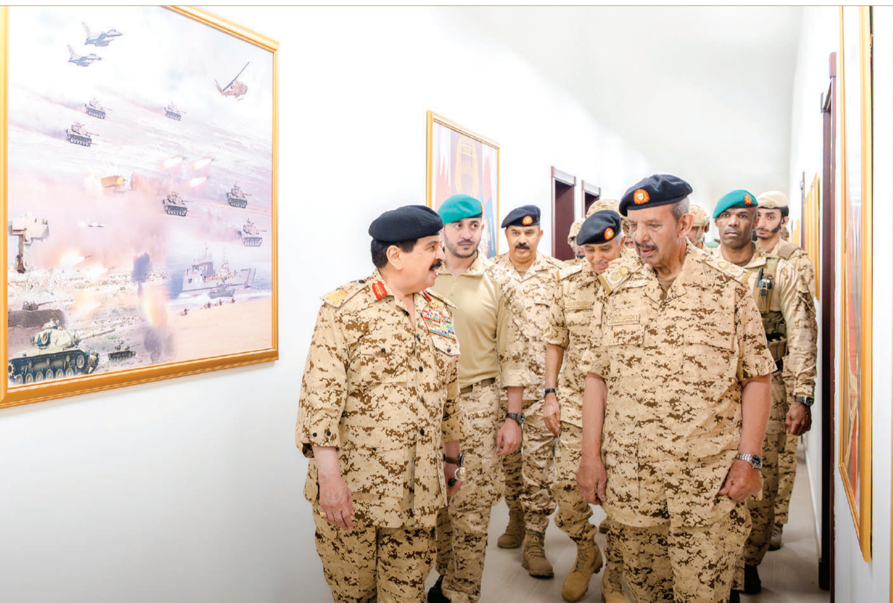
جلالة الملك المعظم القائد الأعلى للقوات المسلحة يلتقي بعدد من منتسبي قوة دفاع البحرين

” العدوان الإيراني الآثم ضد البحرين ودول المنطقة استهدف المدنيين والمنشآت والبنى التحتية المدنية