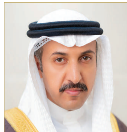
الدكتور الشيخ عبدالله بن أحمد

وأفاد الوزير، بأن الرؤية المستنيرة لحضرة صاحب الجلالة ملك البلاد المعظم، أيده الله، تخطت حدود تقديم العون والإسناد في مختلف ميادين العمل الإنساني إلى فتح آفاق رحبة أمام المجتمع الدولي للتضامن المشترك على