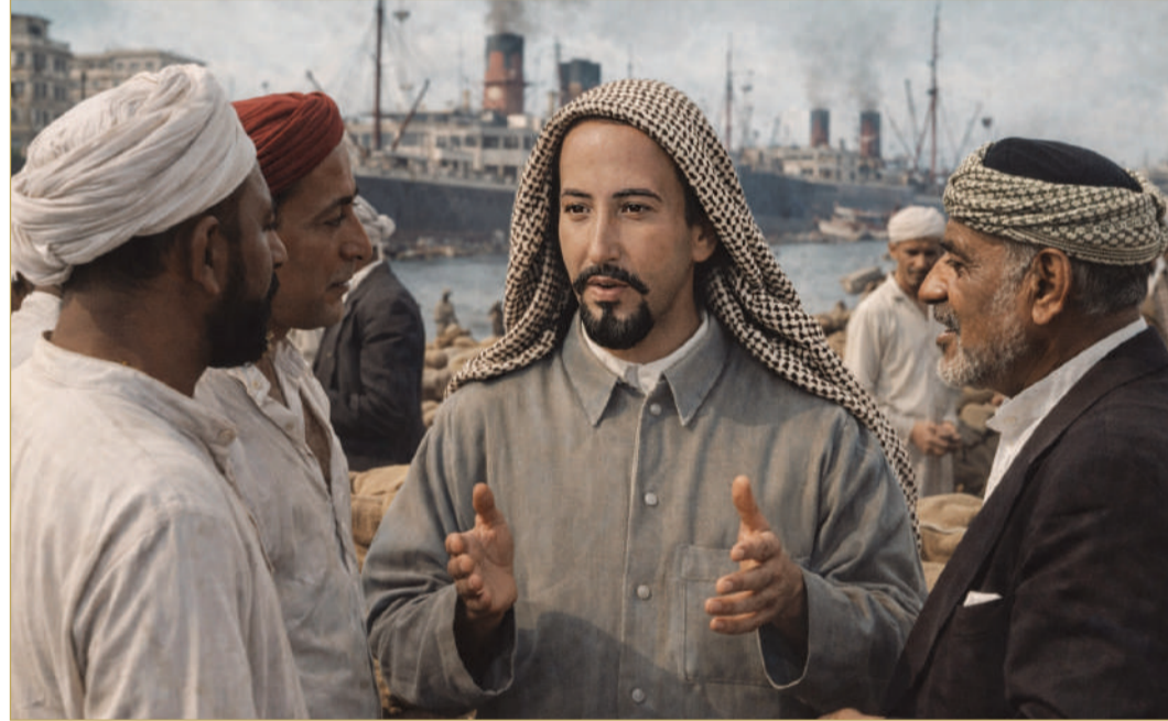
صورة مولدة بالذكاء الاصطناعي للراحل مع التجار في بومباي