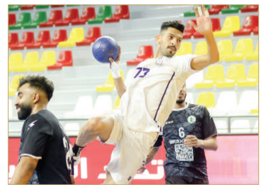
لقاء "الاتحاد" و"الاتفاق"

نجح فريق "الاتحاد" في تحقيق الفوز الثامن بمسابقة دوري خالد بن حمد لكرة اليد على حساب نظيره "الاتفاق" بنتيجة 29 - 34، في المواجهة التي أقيمت مساء الأحد لحساب الجولة 20. وانتهى الشوط الأول بتفوق "الاتحاد" بفارق 7 أهداف (11 - 18)، وبذلك أصبح رصيد "الاتحاد" 33 نقطة، و"الاتفاق" تلقى الخسارة رقم 14 وصار رصيده 26 نقطة.