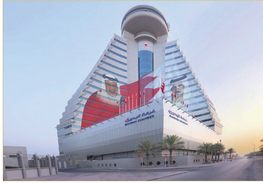
البلاد | أسامة مهران

اتجاه لاختيار نبيل كانو رئيساً لمجلس الإدارة