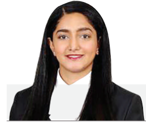
* د. الشيخة فتي بنت عبدالله بن محمد آل خليفة