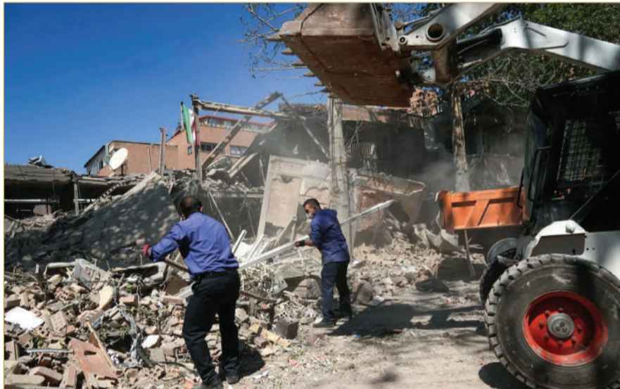
عمال يرفعون الأنقاض من جامعة شريف بطهران عقب ضربة أميركية إسرائيلية

من البنى التحتية العسكرية في 3 مطارات بطهران. إلى ذلك، أظهر فيديو متداول لحظة استهداف قاعدة ذخيرة للقوات الجوية في بوشهر جنوب غرب البلاد، وأظهر المقطع المصور انفجاراً هائلاً في المكان، مع تصاعد كثيف للدخان غطى سماء المنطقة المستهدفة. كما هزت ضربات عنيفة مدينة عبادان في جنوب غرب إيران، وفق ما ذكرته وسائل إعلام محلية. أيضاً، طال استهداف مستودعات الذخيرة رباط كريم غربي طهران. كذلك، أسفر هجوم على محطة تابعة لجامعة شريف للتكنولوجيا في طهران عن انقطاع مؤقت للغاز في بعض مناطق العاصمة، بحسب ما أفاد الإعلام الرسمي الإيراني. ورصد إطلاق صواريخ من إيران تجاه مناطق وسط إسرائيل، فيما هزت انفجارات مدينة تل أبيب.