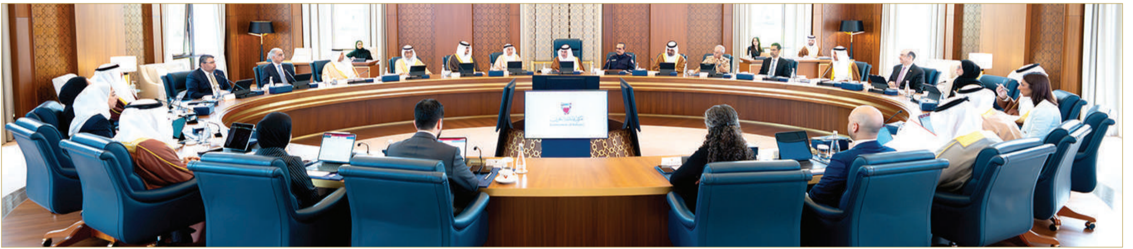
سمو ولي العهد رئيس الوزراء يترأس الاجتماع الاعتيادي الأسبوعي لمجلس الوزراء