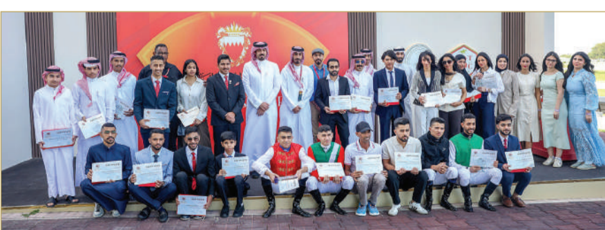
تكريم الدفعة الثالثة

نسبة إحرازهم للمراكز الأولى خلال مشاركتهم في السباقات الموسمية. ويأتي تنظيم هذه البرامج ضمن جهود صندوق دعم الفرسان المستمرة لتطوير الكفاءات الوطنية في مجال الفروسية وسباقات الخيل.