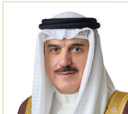
رئيس مجلس النواب

وأشاد بدور القطاع الخاص في دعم الاقتصاد الوطني، وتحقيق أهداف المسيرة التنموية الشاملة، بقيادة ملك البلاد المعظم صاحب الجلالة الملك حمد بن عيسى آل خليفة،