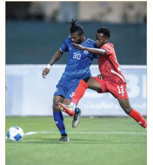
لقاء الرفاع الشرقي وبوري

إقامة مباراتين في تمام الساعة 7 مساءً، السبتين والتمامة على استاد FIFA، التضامن وأم الحصم على استاد نادي الرفاع. ففي اللقاء الأول يسعى السبتين لاقتناص النقاط الثلاث وتحسين موقعه في سلم الترتيب، وفي المقابل يستهدف التمامة الانتصار ولا سواه لإبقاء حظوظه قائمة في الصعود للأضواء وعدم الابتعاد عن المراكز الثلاثة الأولى. أما اللقاء الآخر، فإن التضامن صاحب المركز قبل الأخير يأمل أن يحقق انتصاره ويتقدم للأمام، وينفس الأمل والهدف يسعى أم الحصم لأن يعزز موقعه في منتصف الترتيب. السبتين يمتلك (14 نقطة)، التمامة (30 نقطة)، التضامن (8 نقاط) وأم الحصم (21 نقطة).