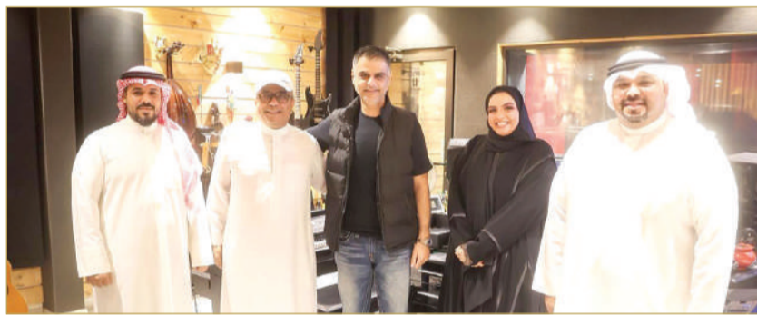
"البلاد" في صياغة فريق عمل أغنية "بحريننا.. بخير"

تجاه وطنهم. وأضاف أن الفكرة بدأت بتبادل الرؤى بين مجموعة من المبدعين، قبل أن تتبلور حول رسالة مستلهمة من توجيهات صاحب السمو الملكي الأمير سلمان بن حمد آل خليفة سمو ولي العهد رئيس مجلس الوزراء، لتكون نقطة الانطلاق نحو عمل يحمل عنوان "البحرين.. بخير". وفي السياق ذاته، أوضحت الشاعرة سبيكة الشحي أن العمل جاء ثمره تعاون فني مشترك، شارك فيه عدد من الأسماء الإبداعية في المملكة، من بينهم الفنان محمد البكري، والمخرج علي النجار، والموزع عبدالله عبدالمجيد، ضمن جهد شبابي يعكس روح الفريق الواحد. كما أكدت أن الرسالة الأساسية للعمل تتمثل في طمأنئة المجتمع، والتأكيد على أن البحرين، بقيادتها وشعبها، ستظل بخير دائمًا، مشددة على أن الأغنية الوطنية ستبقى حاضرة كأحد أبرز أدوات التعبير عن حب الوطن، وتعزيز وحدته في مختلف الظروف.