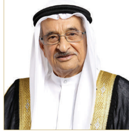
رئيس المجلس الأعلى للصحة

واختتم رئيس المجلس الأعلى للصحة تصريحه بالدعوة إلى تكاتف الجهود بين مختلف الجهات والمؤسسات، لترسيخ أهمية دعم العلم والمعرفة في القطاع الصحي، في مواجهة التحديات الصحية وبناء مستقبل أكثر صحة وازدهاراً للجميع.