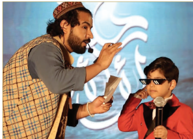
فقرة مع أحد الأطفال في برنامج فصول الحكاية

حضوره، يظهر محمد صالح وهو يروي الحكاية لطفل يقف بثقة أمام الجمهور، في مشهد يلخص فلسفته: أن الحكاية ليست مجرد كلمات ثقّال، بل تجربة تُعاش، وجسر يمتد بين الأجيال. وكان يخاطب جمهوره في وسائل التواصل بعبارة "مرحبًا يا سادة"، إلا أنه غادر الدنيا دون أن يقول "وداعًا يا سادة"! لكن غياب الحكواتي محمد صالح لا يعني غياب صوته، بل يعني تحوُّله إلى صدى مستمر في ذاكرة كل طفل استمع إليه وكل قصة أعاد بها تشكيل الخيال؛ فقد ترك خلفه إرثًا من الدفء الإنساني والإبداع الذي سيظل يُروى كحكاية لا تنتهي.