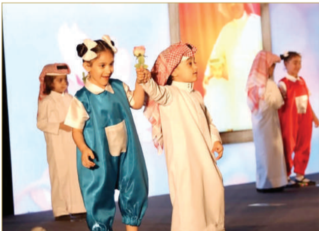
الراحل اهتم بثقافة الطفل عبر الحكايات والتمثيل