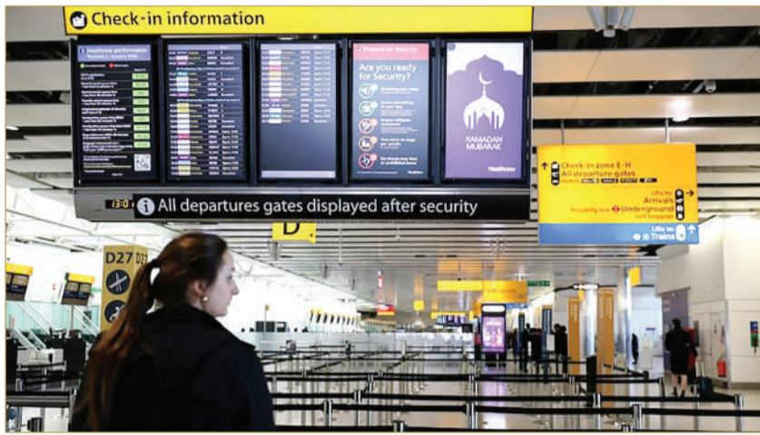
لوحة مواعيد تعرض رحلات ملغاة إلى دول الشرق الأوسط في مطار لندن هيثرو

أما على مستوى سلوك المسافرين، فيبدو أن كثيرين يفضلون تأجيل قرارات السفر أو اختيار وجهات أقل خطورة، مع تزايد الحذر تجاه المناطق المرتبطة بالشرق الأوسط. وفي الوقت نفسه، يواصل بعض المسافرين حجز رحلاتهم مبكرًا لتفادي الارتفاع المتوقع في الأسعار. وبينما تعمل شركات الطيران على إعادة رسم شبكات رحلاتها، يبقى مستقبل القطاع مرهونًا بتطورات الحرب، التي قد تعيد تشكيل خريطة السفر العالمية إذا استمرت لفترة أطول بحسب thenationalnews.