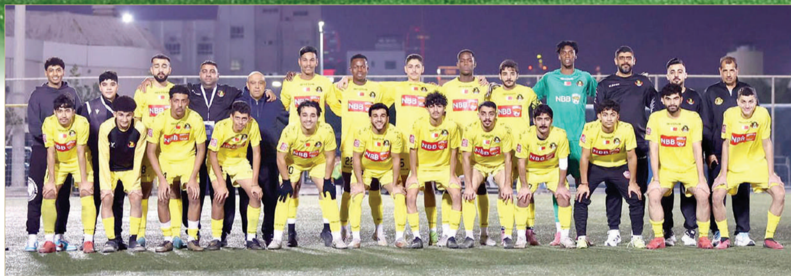
فريق الأهلي للشباب لكرة القدم