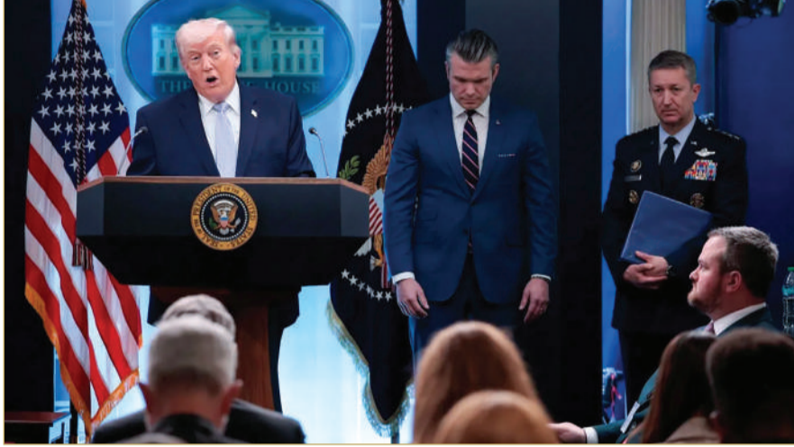
جانب من المؤتمر الصحفي للرئيس الأميركي في البيت الأبيض

وفق ما نقلت وكالة رويترز، كما أشار إلى أن المقترح في حال الموافقة عليه سيقود إلى وقف فوري لإطلاق النار، وإعادة فتح مضيق هرمز، على أن يتم التوصل إلى اتفاق نهائي خلال 15 إلى 20 يوماً. ولفت إلى أن المقترح يتضمن تخلي إيران عن الأسلحة النووية، ورفع العقوبات عنها، والإفراج عن أصولها المجمدة، مقابل فتح الممر الملاحي الحيوي. وأوضح أن التفاهم الأولي سيصاغ في شكل مذكرة تفاهم تُستكمل نهائياً عبر باكستان، وهي قناة الاتصال الوحيدة في المحادثات. إلى ذلك، أفاد بأن رئيس أركان الجيش الباكستاني، عاصم منير، أجرى اتصالات هاتفية منفصلة مع نائب الرئيس الأميركي جيه دي فانس، والمبعوث الأميركي ستيف ويتكوف، فضلاً عن وزير الخارجية الإيراني عباس عراقجي.