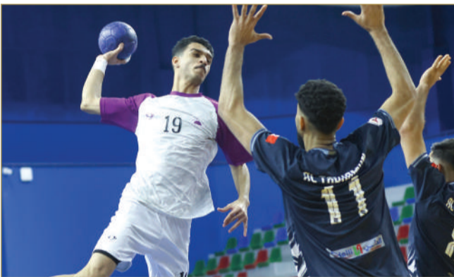
لقاء باربار والتضامن

الماضيتين بالتعادل، واستعادة نعمة الفوز من بوابة توبلي، التي تبقية في صدارة الترتيب قبل مواجهته الأخيرة المرتقبة مع الأهلي، أما توبلي فيأمل الانتصار الثمين والقفز للمركز السادس.