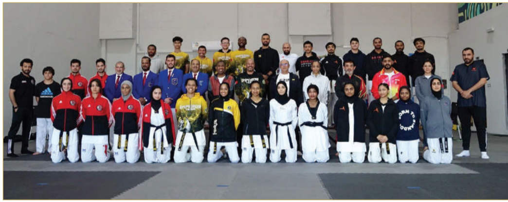
الفائزون بالمراكز الأولى في فئتي الرجال والسيدات

للجهاز الفني لاختيار العناصر التي ستنتضم لبرامج الإعداد المكثفة، مقدرا التعاون الفعال من قبل المراكز الـ 12 المشاركة والتي ساهمت في إنجاح هذه التصفيات التي تصب في مصلحة تطوير رياضة التايكواندو في المملكة، مهنا أصحاب المراكز الأولى في التصفيات على المستوى الذي قدموه وما حققوه من نتائج ومنتصيا حظا أوفر لبقية اللاعبين في المشاركات المقبلة.