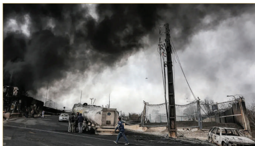
ترامب هدد بضرب محطات الطاقة الإيرانية حال عدم التوصل لاتفاق

الولايات المتحدة وإسرائيل. وقالوا إن إيران تلقت رسائل من وسطاء، من بينهم باكستان وتركيا ومصر.