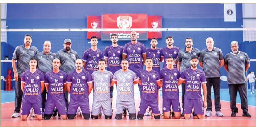
فريق داركليب لكرة الطائرة

إلا أن الفريق دون أدنى شك يسعى لإنهاء الموسم بالعلامة الكاملة ودون أية خسارة تذكر. أما مواجهة الثانية، فستحمل طابعا تنافسيا خاصا بين الأهلي والمحرق في صراع مباشر على مركز الوصافة، حيث يدخل الفريقان اللقاء بشعار