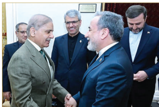
عباس عراقجي مع شهباز شريف في إسلام آباد

الحصار يثقل كاهل إيران.. وبزشكيان يدعو لترشيد الكهرباء