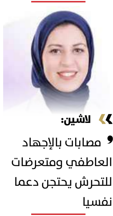
« لاشين: ”

” رش العطر دون موافقة تعدّ على السلامة الجسدية والحرية الشخصية