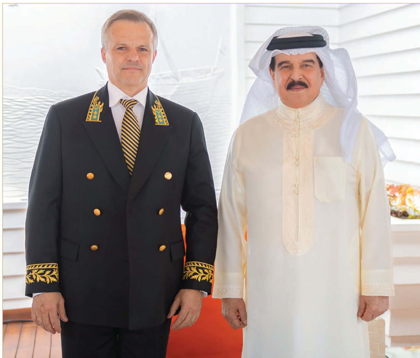
جلالة الملك المعظم يستقبل سفير روسيا الاتحادية لدى المملكة

للأعمال الإنسانية وشؤون الشباب رئيس المجلس الأعلى للشباب والرياضة سمو الشيخ ناصر بن حمد آل خليفة. وفي الاستقبال، نوه جلالة الملك المعظم، بجهود رئيس روسيا الاتحادية فلاديمير بوتين في توثيق علاقات الصداقة التاريخية الوطيدة مع مملكة البحرين. كما رحب جلالته بالسفير الروسي، واستعرض معه العلاقات البحرينية الروسية