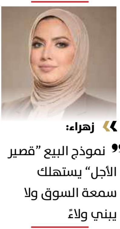
« زهراء: ”

” نرجسية الريح“ لدى أصحاب العمل تجعل الموظفة ”تستجدي“ الاهتمام