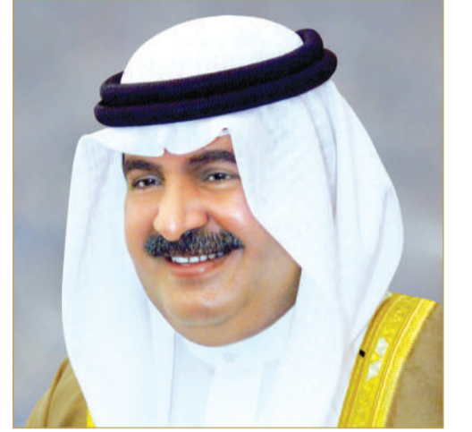
سمو الشيخ علي بن خليفة

مختلف المحافل. وأشار سموه إلى أن فوز نادي المحرق بهذا اللقب المستحق يعكس ما يتمتع به الفريق من أداء متميز وتخطيط فني وإداري رفيع، ويجسد روح التنافس الإيجابي التي تزخر بها الرياضة البحرينية. كما أشاد سموه بالمستوى الفني المتميز الذي قدمه نادي الرفاع الرياضي وبلوغه المباراة النهائية، متمنياً له دوام التوفيق والنجاح في البطولات والمشاركات المقبلة.