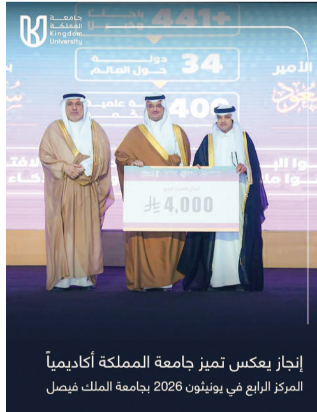
إنجاز يعكس تميز جامعة المملكة أكاديمياً المركز الرابع في يونيثون 2026 بجامعة الملك فيصل

في إنجاز جديد يعكس تميز كوادرها الأكاديمية وطلبته في مجالات الابتكار والتقنية، أحرزت جامعة المملكة - مملكة البحرين، المركز الرابع ضمن منافسات “يونيثون 2026”، الذي نظّمته جامعة الملك فيصل بالتزامن مع المؤتمر الدولي الخامس في الحوسبة وذكاء الآلة، بمشاركة أكثر من 36 فريقاً من جامعات محلية ودولية، وذلك بعد اجتياز مرحلة الاختيار الأولي.