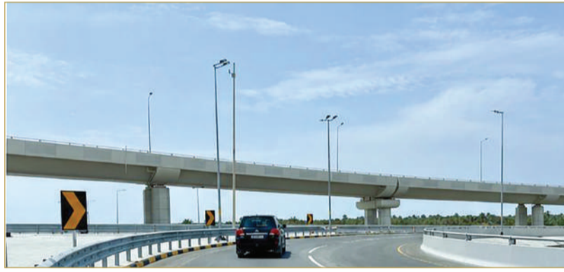
جانب من توسعة منحني الانعطاف من شارع الشيخ عيسى بن سلمان إلى شارع الجنبية

فضلاً عن تعزيز متطلبات السلامة المرورية عبر تركيب حواجز السلامة والعلامات الإرشادية والتحذيرية. وأشار وكيل وزارة الأشغال إلى أن مشروع التوسعة سيساهم في تخفيف الازدحامات المرورية وتعزيز انسيابية حركة المركبات بنسبة تحسن تصل إلى 40%. بما ينعكس إيجاباً على مستخدمي الطريق. يذكر أنه تم تنفيذ المشروع من قبل شركة حجي حسن، وذلك بتمويل من الصندوق الكويتي للتنمية.