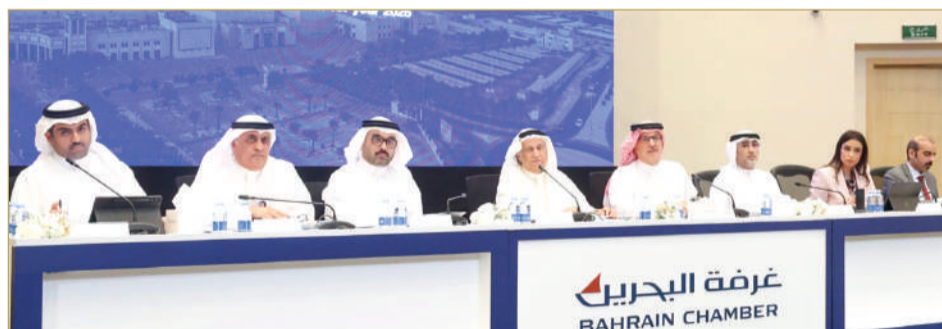
غرفة تجارة وصناعة البحرين تعقد جمعيتها العمومية