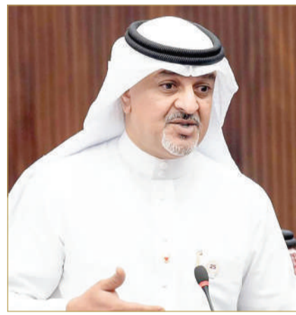
النائب جلال كاظم

بالنسبة للمتزوجين من عراقيات، ونحو سنتين بالنسبة للمتزوجين من سوريات. وأضاف الوزير "تواصلنا مع عدد من