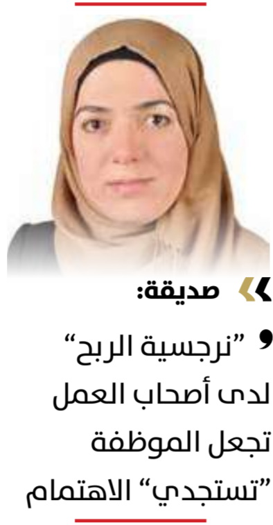
« صديقة: ”

حيث يتحول الوقوف في الممرات واستيفاف المارة إلى تجربة تمس صورة الفرز عن نفسه، فينتقل - في وعيه الداخلي - من موقع "مقدم خدمة" إلى موقع يسعى