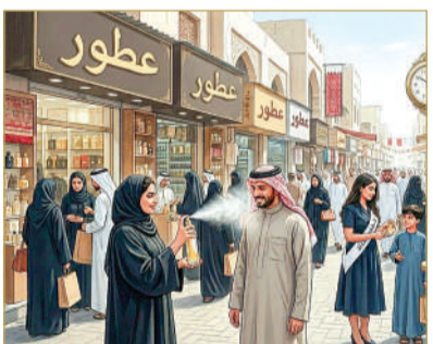
صورة مولدة بالنكاء الاصطناعي