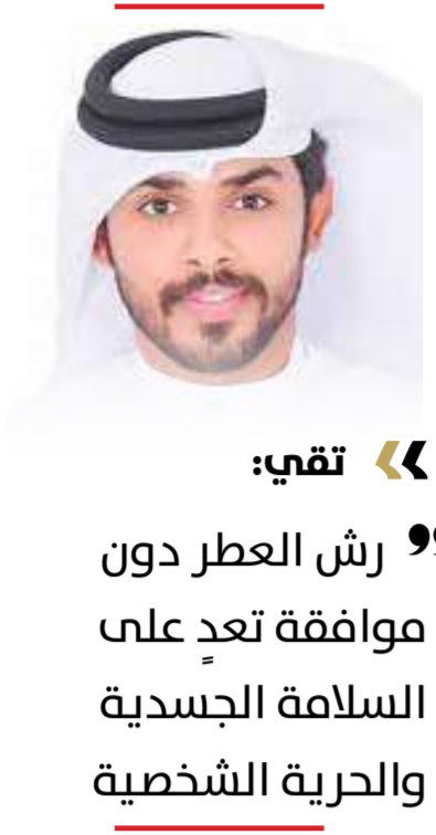
« تقى: ”

” نموذج البيع “قصير الأجل “يستهلك سمعة السوق ولا يبني ولاءً