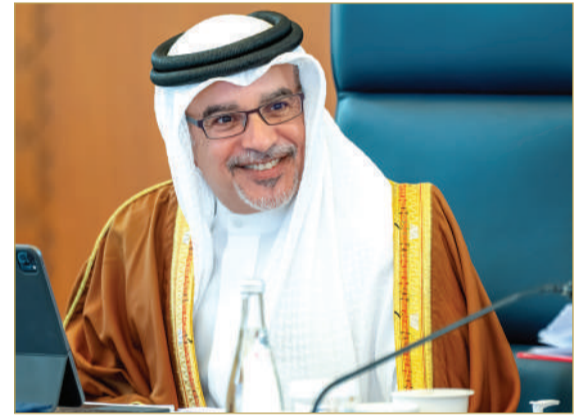
سمو ولي العهد رئيس الوزراء يترأس الاجتماع الاعتيادي الأسبوعي لمجلس الوزراء

” حزمة “تمكين” تدعم المؤسسات المتأثرة جراء الاعتداءات الإيرانية الأثمة لمساعدتها على استمرارية عملياتها التشغيلية