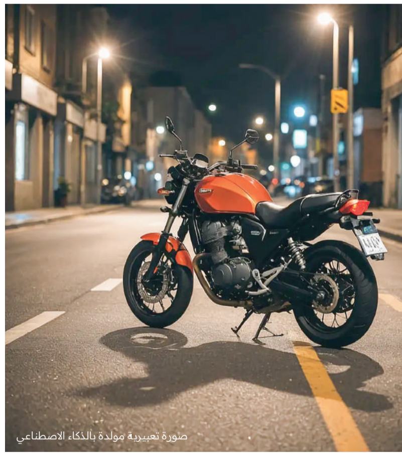
صورة تعبيرية مولدة بالذكاء الاصطناعي

وسط حركة سير اعتيادية على أحد الطرق، وقع حادث مروري لم يكن في الحسبان، بعد أن اصطدمت متهمة عشوائية بدراجة نارية، ما تسببت في إصابته سائقها بإصابات بليغة نُقل على إثرها إلى المستشفى، قبل أن يفارق الحياة لاحقاً متأثراً بجراحه. وتشير وقائع القضية إلى أن المتهممة الشابة كانت تقود مركبتها على أحد الشوارع في البلاد دون مراعاة واجب الانتباه والحيطة أثناء القيادة، ولم تتخذ الحذر اللازم عند اقترابها من مدخل أحد المراكز الصحية، حيث انحرفت نحو اليسار عند التقاطع دون تأكد من خلو الطريق، ما أسفر عن اصطدامها بدراجة نارية يقودها المجني عليه، ما أدى إلى تدهور مركبته وسقوط الأخير وإصابته