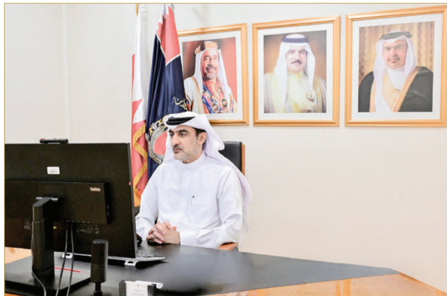
البحرين تترأس الاجتماع الثامن والعشرين للجنة التنفيذية للحكومة الرقمية بدول مجلس التعاون

مشروع مبادرة تطبيق "حكومتي الموحد للأفراد" في مملكة البحرين، الذي يعد ضمن إحدى المبادرات الوطنية الرامية إلى تعزيز تجربة المستخدم ورفع كفاءة تكامل الخدمات الحكومية الرقمية عبر منصة موحدة. كما تم في الاجتماع بحث التحضيرات للاجتماع العاشر للجنة الوزارية للحكومة الرقمية بدول مجلس التعاون.