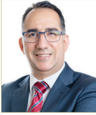
الدكتور هاني الساعاتي

كما ثن حرص واهتمام صاحب السمو الملكي الأمير سلمان بن حمد آل خليفة، ولي العهد ورئيس