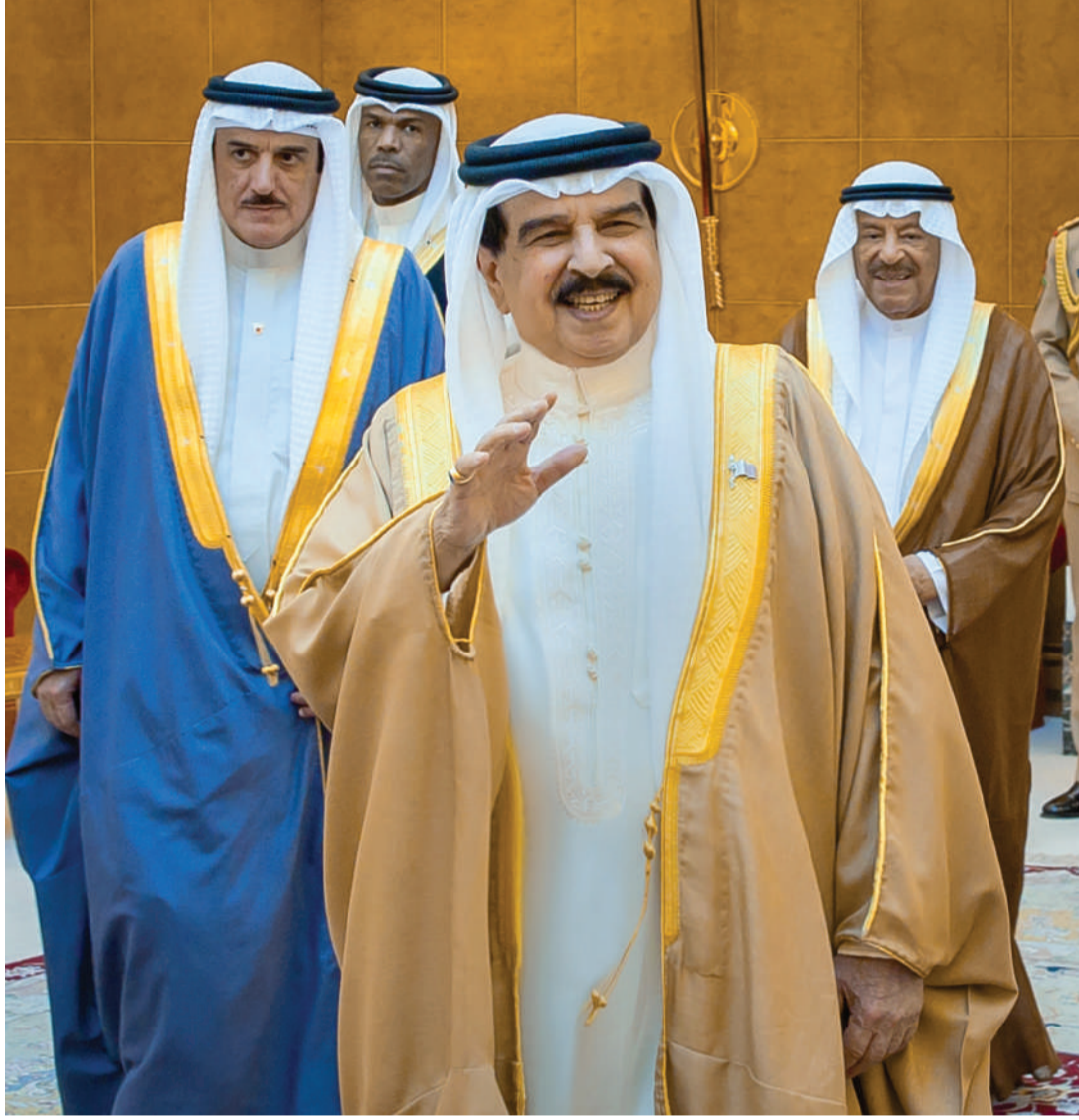
جلالة الملك المعظم يستقبل رئيسي مجلسي الشورى والنواب ونواب الرئيسين وأعضاء لجنة الرد على الخطاب الملكي السامي

أعضاء "الشورى" و "النواب" يبذلون جهداً مخلصاً ومقدراً في خدمة الوطن والمواطن... الملك المعظم: