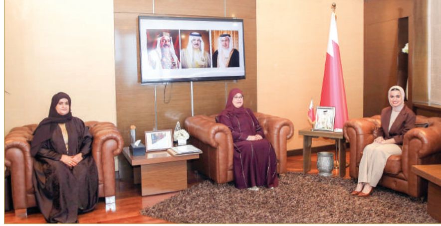
ضاحية السيف - وزارة شؤون الشباب

استقبلت روان توفيقى وزيرة شؤون الشباب، الشبيخة لمياء بنت محمد آل خليفة رئيسة مجلس إدارة جمعية النور للبر، والشبيخة لولو بنت خليفة آل خليفة نائبة رئيسة الجمعية.