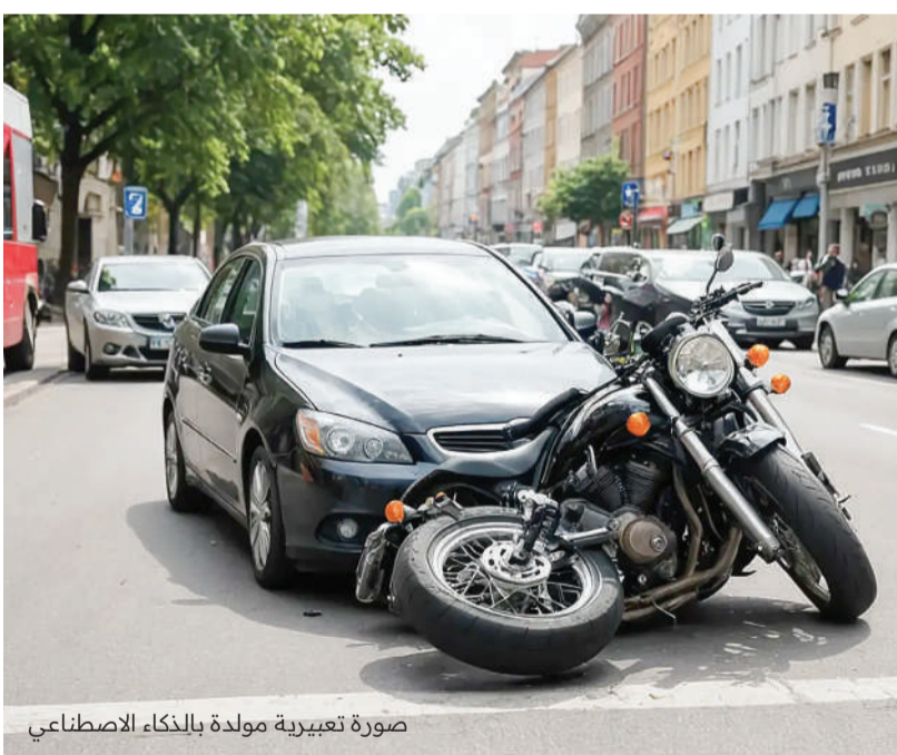
صورة تعبيرية مولدة بالذكاء الاصطناعي

بإصابات استدعت نقله إلى المستشفى بواسطة الإسعاف، ووفاته في وقت لاحق متأثراً بالإصابات التي تعرض لها. وكانت النيابة العامة قد اتهمت المتهممة بأنها تسببت بخطئها في حادث مروري أدى إلى وفاة المجني عليه، وألحقت تلافيات بممتلكات الغير، فضلاً عن قيادتها لمركبتها دون التزامها بأخذ أقصى درجات الحيطة والحذر الواجبين عليها أثناء القيادة، وعدم مراعاة أولوية المرور، بأن تتوقف عند اللزوم حيث استمرت في السير بمركبتها ما ترتب عليه وقوع الحادثة، فضلاً عن إلحاقها ضرراً بالدراجة النارية. وأقرت المتهممة أمام المحكمة بما نُسب إليها من تهم، فيما حددت الأخيرة جلسة 17 مايو الجاري للنظر في القضية.