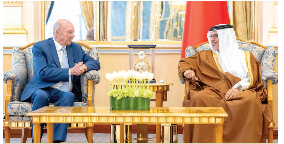
سمو ولي العهد رئيس الوزراء يستقبل رئيس مجلس الأعيان في المملكة الأردنية الهاشمية

”تضامن أردني صادق مع البحرين جراء الاعتداءات الإيرانية الآثمة