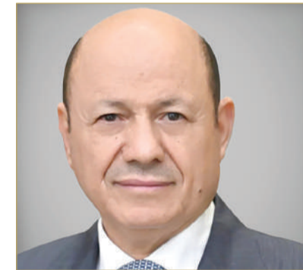
د. رشاد العليمي

تلقى الفريق أول الشيخ راشد بن عبدالله آل خليفة وزير الداخلية، اتصالاً هاتفياً من د. رشاد العليمي رئيس مجلس القيادة الرئاسي بالجمهورية اليمنية الشقيقة. وفي الاتصال، عبّر د. العليمي عن تأييد الجمهورية اليمنية