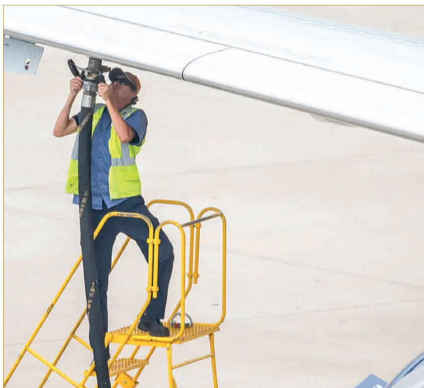
يقوم أحد الفنيين بالاستعداد لتزويد طائرة تابعة لشركة Delta Air Lines بالوقود

سعر غالون الوقود إلى 4 دولارات في بعض الأسواق خلال شهر أبريل. رغم هذا الضغط المالي، لا يزال الطلب على السفر صامداً، حيث أظهرت بيانات وكالات السفر نمو مبيعات التذاكر بنسبة 12% في مارس لتصل إلى 10.4 مليار دولار. ومع ذلك، وجهت شركات الطيران الكبرى رسائل واضحة لـ "وول ستريت" مفادها أن المسافرين هم من سيتحملون في نهاية المطاف عبء