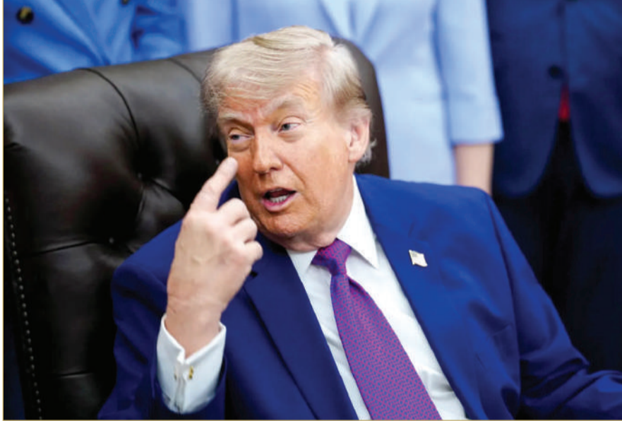
الرئيس الأميركي دونالد ترامب

من جانب آخر، أعرب ترامب عن استيائه من الأكراد، قائلا إنهم خيبروا توقعات واشنطن بعدما فشلت جهود إبطال أسلحة وذخائر إلى مجموعات معارضة داخل إيران.