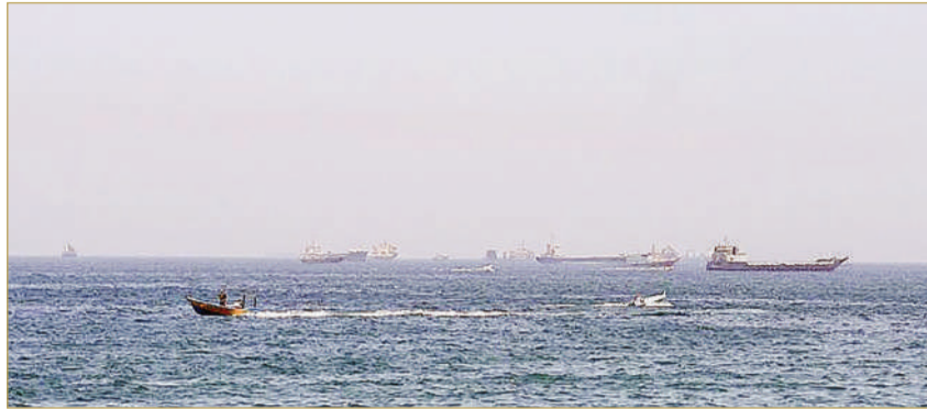
سفن وقوارب في مضيق هرمز

المجمدة. وصعدت أسعار النفط أمس حيث ارتفعت العقود الآجلة لخام برنت 2.70 دولار أو 2.67% لتصل إلى 103.99 دولار للبرميل بحلول الساعة 09:02 بتوقيت غرينتش. وزاد سعر خام غرب تكساس الوسيط الأميركي 2.24 دولار أو 2.35% ليصل إلى 97.66 دولار للبرميل. وكانت أسعار الخامين قد ارتفعتت إلى 105.99 دولار و100.37 دولار للبرميل على التوالي في وقت سابق من الجلسة. وفي الأسبوع الماضي، سجل كلا الخامين خسائر أسبوعية بنسبة 6% وسط آمال بنهاية وشيكة للصراع المستمر منذ 10 أسابيع، مما سيسمح بمرور النفط عبر مضيق هرمز.