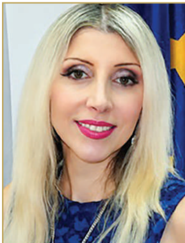
السفيرة ثيساليا ساليينا شامبوس