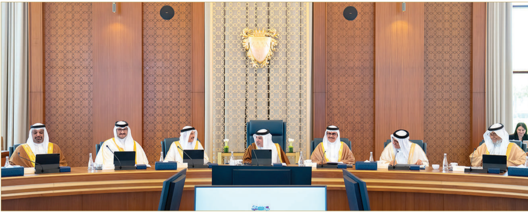
سمو ولي العهد رئيس الوزراء يتأسس الاجتماع الاعتيادي الأسبوعي لمجلس الوزراء

سمو ولي العهد رئيس مجلس الوزراء يوجه إلى تسخير كافة الإمكانيات لخدمة حجاج البحرين وتسهيل أدائهم للمناسك بكل يسر