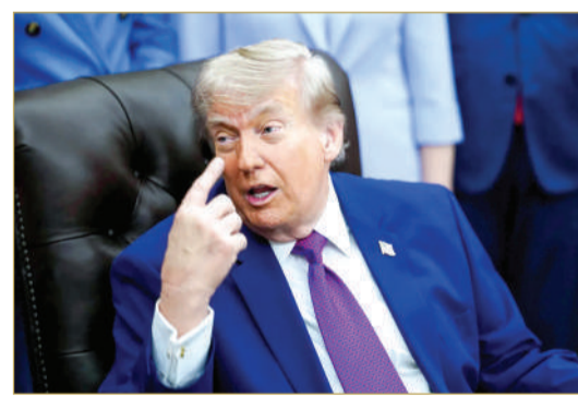
الرئيس الأميركي دونالد ترامب

مؤكد أنه لم يكمل قراءته بسبب ما عدّه غياباً لأي التزام حقيقي بشأن البرنامج النووي الإيراني.