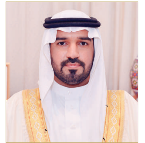
سمو الشيخ خليفة بن سلمان