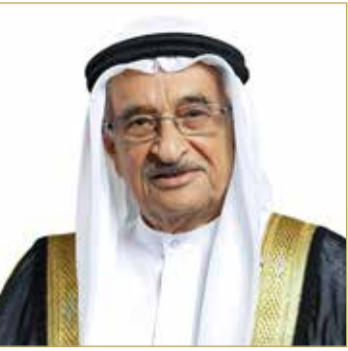
رئيس المجلس الأعلى للصحة