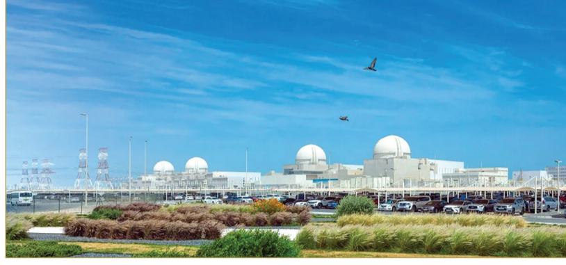
محطة البركة النووية بالطفرة في أبوظبي

والقانونية والدبلوماسية والعسكرية في مواجهة أي تهديد أو ادعاء أو عمل عدائي، بما يكفل حماية سيادتها وأمنها الوطني وسلامة أراضيها ومواطنيها والمقيمين فيها وزوارها، وفقاً للقانون الدولي". وقالت الوزارة الإماراتية إن "استهداف المواقع الحيوية والمدنية أمر مدان ومرفوض بكل المقاييس القانونية والإنسانية، مشددة على ضرورة وقف هذه الاعتداءات الغادرة فوراً بما يضمن الالتزام الكامل بوقف جميع الأعمال العدائية". وشدد نائب رئيس مجلس الوزراء وزير الخارجية الإماراتي الشيخ عبدالله بن زايد على حق بلاده الكامل في الرد على هذه "الاعتداءات الإرهابية"، واتخاذ كافة الإجراءات اللازمة لحماية أمنها وسلامة أراضيها ومواطنيها، وفقاً للقانون الدولي.