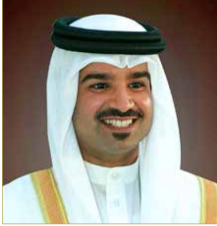
سمو الشيخ خليفة بن علي

وأضاف: "نعاهد سموه على استمرار العمل التطويري في بيت الكرة البحرينية نحو قيادة مختلف أنشطة وفعاليات الاتحاد البحريني لكرة القدم إلى مزيد من النجاحات، بما يعكس إيجابًا على الكرة البحرينية ويحقق تطلعات سموه في تطويرها وازدهارها ووصولها إلى أعلى المستويات وعلى جميع الأصعدة".