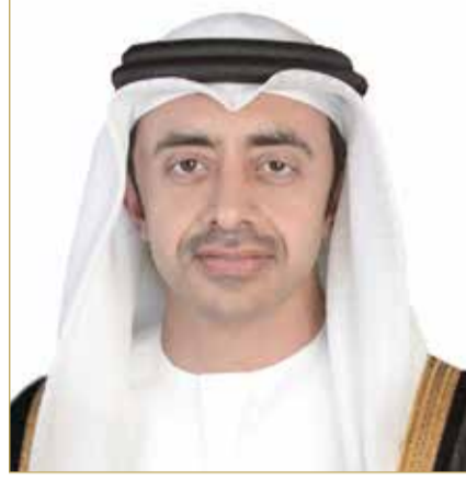
الشيخ عبدالله بن زايد آل نهيان

وأكد وزير الخارجية أن استمرار الاعتداءات التى تعرضت لها دولة الإمارات العربية المتحدة، انتهاك صارخ للقانون الدولى، وقرار مجلس الأمن رقم 2817، مجدداً تأكيد وقوف مملكة البحرين صفاً واحداً مع دولة الإمارات، وتضامنها معها