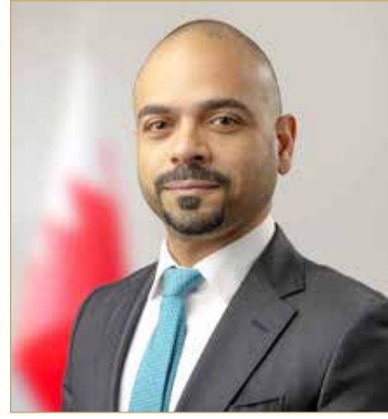
وزير التنمية الاجتماعية

2026 أثبتت توقف بعض الجمعيات عن مباشرة أنشطتها، وانعدام فاعليتها، وعدم انتظام انعقاد جمعياتها العمومية وتجديد مجالس إدارتها لمدد تجاوزت عشر سنوات، بالمخالفة لأحكام القانون وأنظمتها الأساسية.