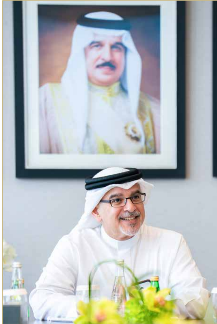
سمو ولي العهد رئيس الوزراء يترأس مجلس التنمية الاقتصادية