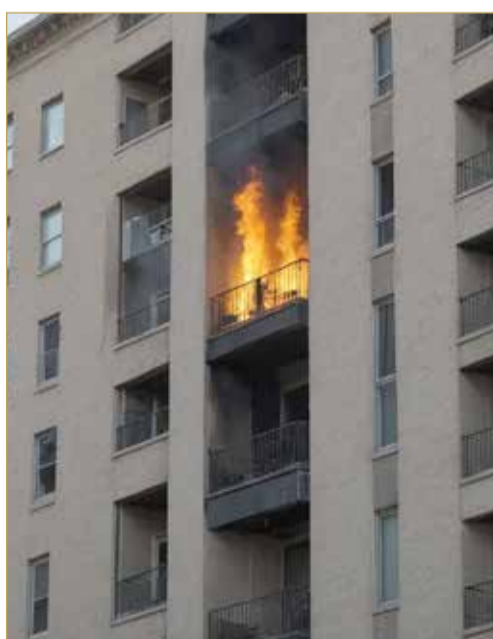
صورة تعبيرية مولدة بالذكاء الاصطناعي

مسؤولة عن تصرفاتها في يوم الواقعة، فيما تبين من تقرير التفتيش بلوغها مبلغ ألفين و399 ديناراً و89 فلساً. وكانت النيابة العامة قد اتهمت المتهممة بأنها في غضون شهر يناير من العام الجاري، أشعلت حريقاً في مالٍ مملوك لمبنى، وكان العقار مسكوكاً، الأمر الذي من شأنه تعريض حياة الناس وأموالهم للخطر.