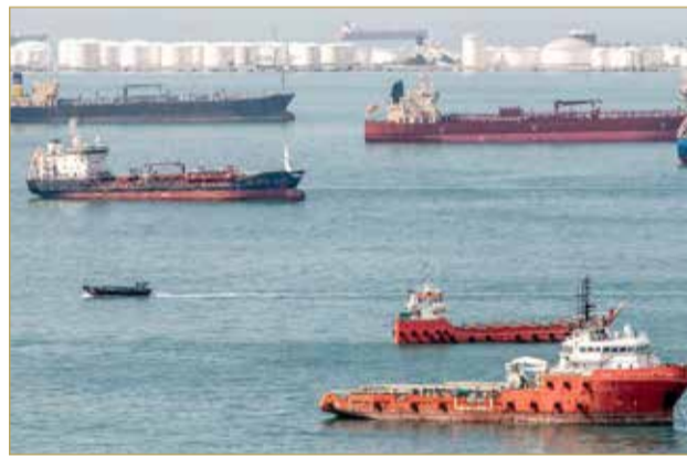
سفن وناقلات نفط في مضيق ملقا قبالة سواحل سنغافورة

ويكتسب المضيق أهميته الاستراتيجية كونه يربط المحيط الهندي بالمحيط الهادئ عبر بحر الصين الجنوبي، ما يجعله ممرًا أساسيًا لحركة البضائع القادمة من الصين، وفي الوقت نفسه خط إمداد رئيسًا للطاقة لدول حليفة للولايات المتحدة مثل اليابان وكوريا الجنوبية والفلبين. ومع تصاعد التوترات الجيوسياسية بين واشنطن وبكين، يزداد القلق من احتمال تحول هذا الممر إلى نقطة ضغط استراتيجية شبيهة بما يحدث في هرمز. إذ يرى مسؤولون وخبراء أن أي صراع مستقبلي في منطقة المحيط الهادئ قد يدفع الأطراف المتنازعة إلى محاولة فرض سيطرة أو قيود على حركة السفن عبر المضيق.