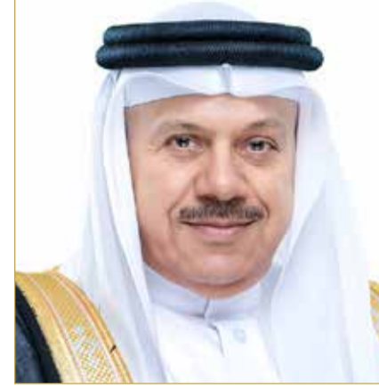
د. عبداللطيف الزباني وزير الخارجية

لمواجهة أي اعتداء على أراضيها، شاكراً مشاعر التضامن الصادقة، ومواقف مملكة البحرين المساندة لدولة الإمارات، التى تعكس عمق الروابط الأخوية التاريخية الوثيقة بين قيادتي البلدين وشعبيهما الشقيقين.