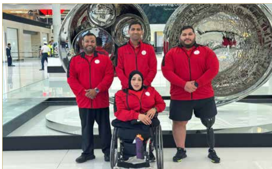
مغادرة وفد منتخب البحرين لرفع الأثقال

غادر وفد منتخب البحرين لرفع الأثقال إلى الجمهورية الجزائرية الديمقراطية الشعبية، للمشاركة في بطولة أفريقيا المفتوحة لرفع الأثقال، والتي ستقام بمدينة وهران خلال الفترة من 17 وحتى 25 مايو الجاري.