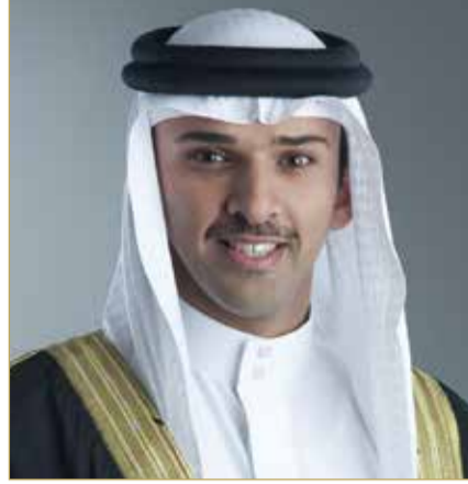
الشيخ علي بن خليفة

بارتقاء الكرة البحرينية، بما يحقق تطلعات سموه في ازدهار الكرة البحرينية ووصولها إلى أعلى المستويات". وأكد رئيس اتحاد الكرة أن مجلس إدارة