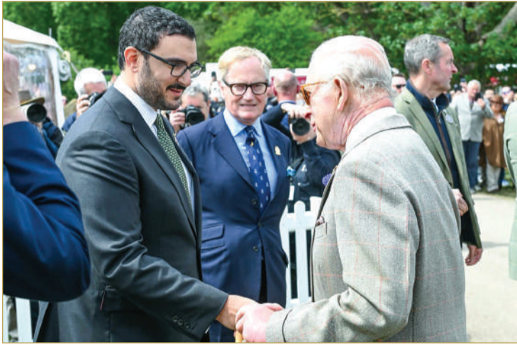
سمو الشيخ عيسى بن سلمان يلتقي صاحب الجلالة ملك المملكة المتحدة لبريطانيا العظمى وإيرلندا الشمالية رئيس الكومنولث