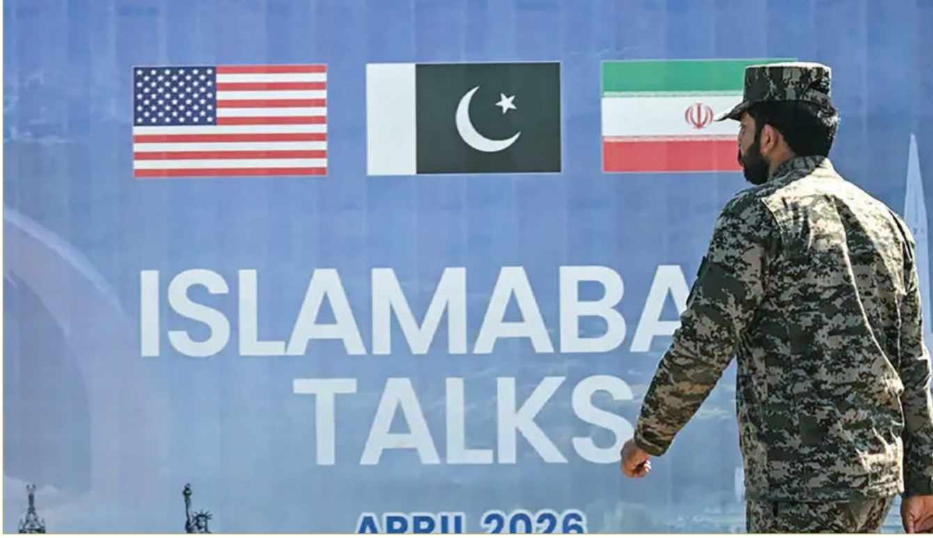
وزير داخلية باكستان في طهران لتسهيل المحادثات المتعثرة مع واشنطن

وقالت مصادر إن باكستان ستشجع الطرفين الإيراني والأميركي على إبداء مرونة أكبر من أجل دفع المفاوضات إلى الأمام، وفق موقع "ناشونال" الباكستاني.