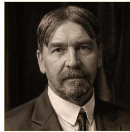
العالم الاجتماعي الأميركي ثورستين فيبلن

في البحرين، تتضح الصورة بصورة أعمق؛ فوفقا لشرة مصرف البحرين المركزي، بلغت القروض الشخصية نحو 6.2 مليار دينار بحريني بنهاية مارس 2026، أي ما يعادل نحو 40% من الناتج المحلي الإجمالي. بالطبع، ليست كل هذه القروض مرتبطة بالمظاهر؛ إذ يدخل ضمنها السكن والتعليم والاحتياجات الأساسية، لكن الرقم يكشف عن حقيقة مهمة: الأسر الخليجية أصبحت تعيش بدرجة أكبر على الالتزامات الشهرية طويلة الأجل.