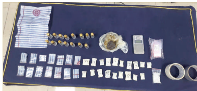
القبض على أسويين بحوزتهما مخدرات

أه تم اتخاذ الإجراءات القانونية اللازمة، تمهيداً لإحالة الواقعتين إلى النيابة العامة.