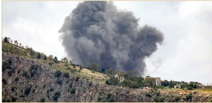
غارة إسرائيلية على جنوب لبنان السبت

كوثرية السباد والمتصورى والفسانية والمروانية والبيسارية الواقعة على بعد أكثر من 50 كيلومتراً عن الحدود مع إسرائيل. وأفادت الوكالة بحركة نزوح نحو صيدا وبيروت بعد الإنذار الإسرائيلي. وطالت الغارات كذلك بلدات لم تكن مشمولة بالإنذار مثل حوش قرب مدينة النبطية، بحسب الوكالة الوطنية. وأعلن الجيش الإسرائيلي من جهته أنه بدأ