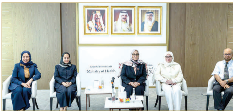
وزيرة الصحة في لقاء مع أعضاء اللجنة الطبية بعثة مملكة البحرين للحج

ملك البلاد المعظم، بهذه الفريضة المباركة، وتنفيذاً لتوجيهات صاحب السمو الملكي الأمير سلمان بن حمد آل خليفة ولي العهد رئيس مجلس الوزراء، بتوفير كافة سبل الدعم والرعاية اللازمة لحجاج مملكة البحرين. جاء ذلك لدى لقاء وزيرة الصحة أعضاء اللجنة الطبية بعثة مملكة البحرين للحج، في إطار متابعة جاهزية واستعدادات اللجنة للمشاركة في موسم الحج لهذا العام.