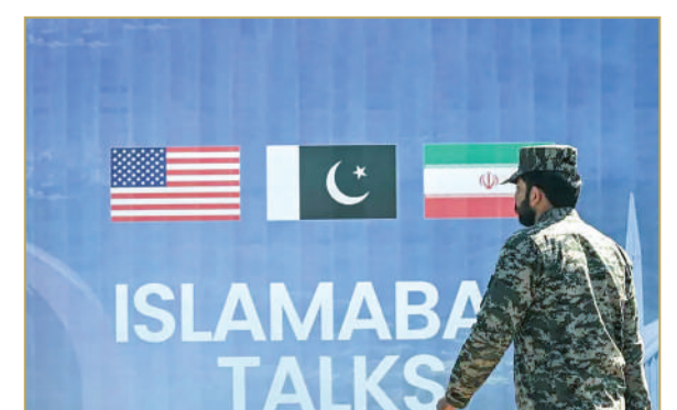
وزير داخلية باكستان في طهران لتسهيل المحادثات المتعثرة مع واشنطن

تتصاعد المخاوف من انهيار ما تبقى من مسارات التهدئة، واحتمال العودة إلى مواجهة أوسع، بين إيران والولايات المتحدة وحلفائها. ونقلت مصادر إعلامية إيرانية عن مسؤولين، السبت، أن إدارة الرئيس الأميركي دونالد ترامب أبدت استعداداً لمنح ضوء أخضر لعمل عسكري ضد إيران في حال فشل المسار الدبلوماسي، مع التأكيد على عدم صدور قرار نهائي حتى الآن، وفق تقرير نشرته “القناة 12” الإسرائيلية. وتُقل عن الرئيس الأميركي دونالد ترامب قوله إن