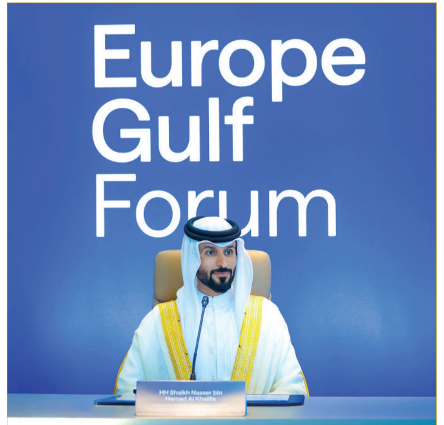
سمو الشيخ ناصر بن حمد يشارك في القمة الافتتاحية لتحالف أوروبا والخليج للجيوستراتيجية والاستثمار (AEGGIS)