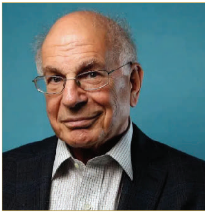
عالم النفس دانييل كانمان

في التحليل الاقتصادي البحت، السيارة وسيلة عملية للانتقال، لكن في دول الخليج