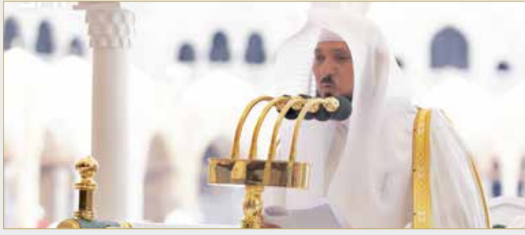
الشيخ د. ماهر المعيقلي

فيه ملائكته بأهل الموقف، وهو أكثر يوم يعتق الله فيه عباده من النار، مشيراً إلى فضل صيام يوم عرفة لغير الحاج، وأنه يكفر السنة التي قبله والسنة التي بعده بإذن الله.