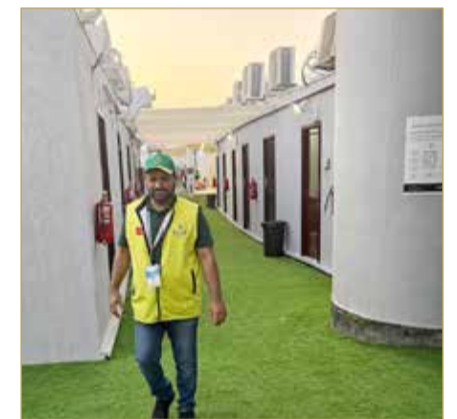
تزويد المخيمات بالتموين