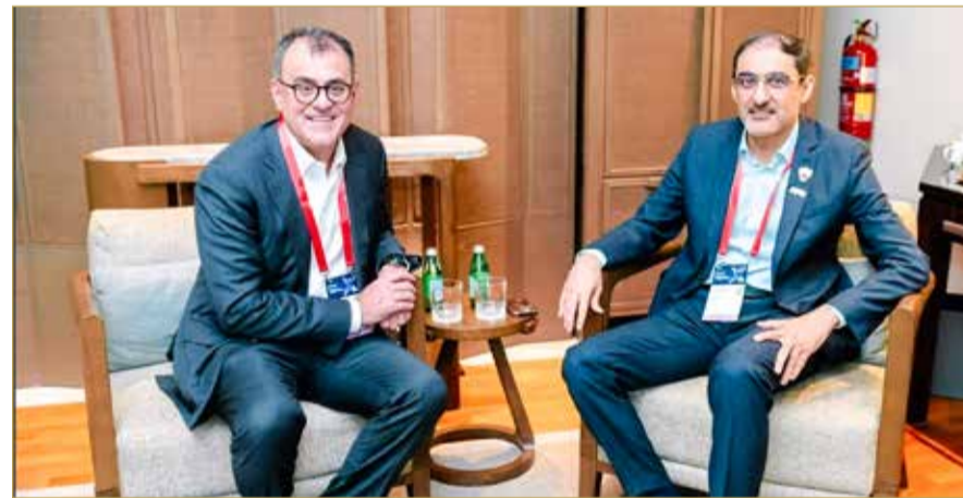
اجتماع القائد مع نائب الرئيس للشؤون الحكومية والسياسات العامة في شركة جوجل العالمية

والتطوير، والاستفادة من تجربة مملكة البحرين في التوأمة الرقمية، إلى جانب مناقشة فرص التعاون في مجالات الذكاء الاصطناعي والتقنيات المتقدمة.