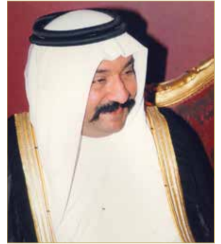
المغفور له سمو الشيخ أحمد بن محمد

تختتم عند الساعة السادسة والنصف من مساء السبت منافسات بطولة المغفور له بإذن الله تعالى سمو الشيخ أحمد بن محمد بن سلمان آل خليفة للتنس، بإقامة المباراة النهائية والحفل الختامي للبطولة تحت الرعاية الكريمة من سمو الشيخ سلمان بن أحمد بن محمد بن سلمان آل خليفة، وذلك على ملاعب الاتحاد البحريني للتنس، وسط