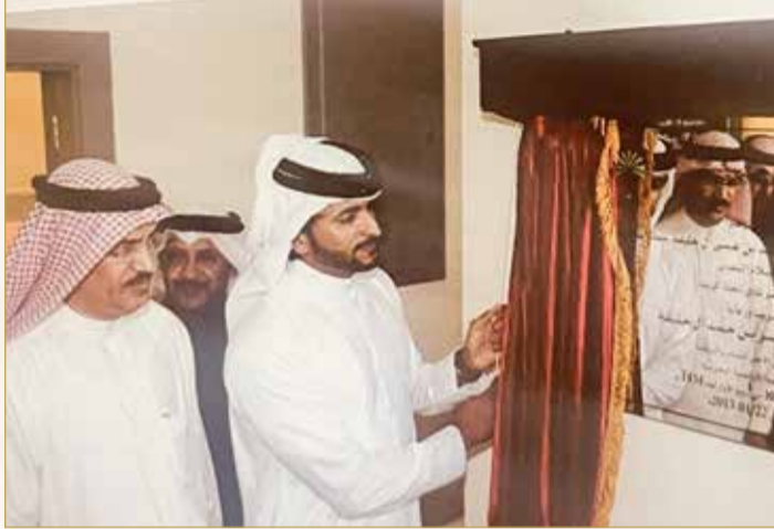
سمو الشيخ ناصر بن حمد افتتح مقر النادي في 22 يناير 2013