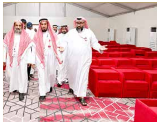
جولة رئيس البعثة الشيخ عدنان القطان والمسؤولين