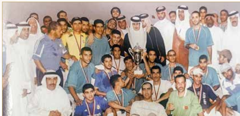
الفريق الأول لكرة القدم مع المرحوم سمو الشيخ فيصل بن حمد بمناسبة الفوز ببطولة سموه الثانية في العام 2005

حدث بتاريخ 23 مارس 2004م، عندما كان أبناء المنطقة يتابعون مباراة ضمن دورة تشييطية لكرة القدم على أحد الملاعب الرملية. وفي المباراة، تفاجأ الحضور بمرور صاحب الجلالة الملك حمد بن عيسى آل خليفة ملك البلاد المعظم، ممتطياً حصانه بالقرب من