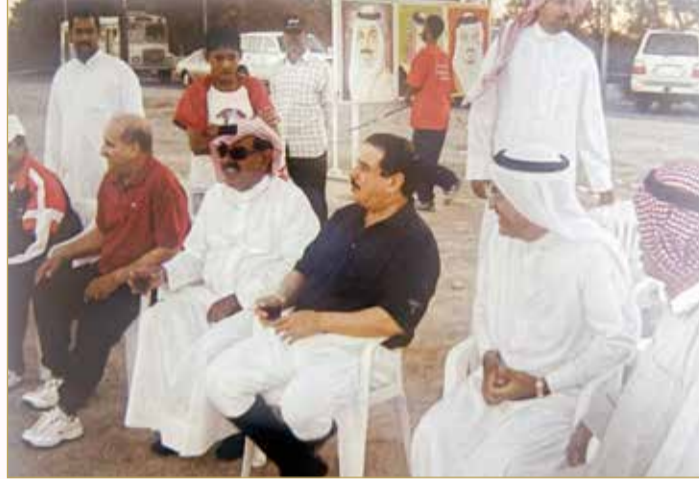
الملك المعظم لدى حضوره مباراة بملعب نادي اتحاد الريف في 23 مارس 2004