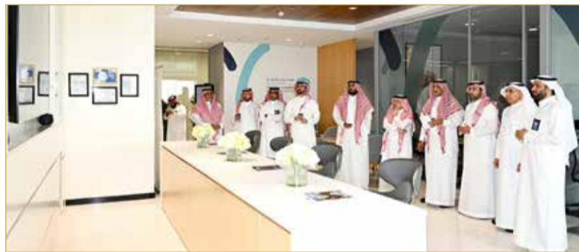
زيارة حاضنة غرفة الشرقية لريادة الأعمال

وأبان الفراج بأنه امتداداً لهذا الحراك تأتي الاستراتيجية الجديدة "لاتحاد الغرف السعودية" كنموذج مؤسسي قائم على الكفاءة، والاستدامة، والتكامل، في إطار منهج يدعم دور "الغرف التجارية" في زيادة تمكين قطاع الأعمال وتوحيد صوته لتعظيم إسهامه في الاقتصاد الوطني.