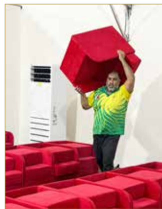
ترتيب أثاث المخيم