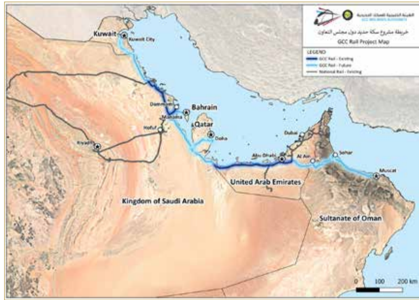
مشروع سكة حديد دول مجلس التعاون

قطار الخليج اليوم ليس مجرد سكة حديد، بل طريق جديد نحو خليج أكثر ترابطاً، واقتصاد أكثر انسياباً، ومنطقة تتحرك بثقة أكبر على خريطة التجارة والنقل في العالم.