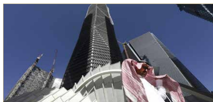
صفقات بنكية وعقارية بمليارات الريالات

ويعكس افتتاح المنتجع توجه وجهه البحر الأحمر نحو ترسيخ مكانتها كواحدة من أبرز المشاريع السياحية المستدامة في المنطقة، عبر تصاميم تنسجم مع البيئة البحرية، واعتماد كامل على الطاقة المتجددة، بما يواكب مستهدفات المملكة في تطوير سياحة نوعية تراعي المعايير البيئية الحديثة. ووفقاً لما أوردته وكالة الأنباء السعودية، يعمل المنتجع وفق مبادئ السياحة المتجددة، مع