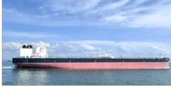
ناقلة نفط يابانية عملاقة

جانب دول متقدمة أخرى، لجأت اليابان أيضاً إلى استخدام احتياطاتها الاستراتيجية لتخفيف أثر الصراع عليها. رغم تمكن عدد محدود من السفن من عبور مضيق هرمز، لا يزال إجمالي العبور اليومي عند مستويات محدودة للغاية مقارنة بما كان عليه قبل الحرب.