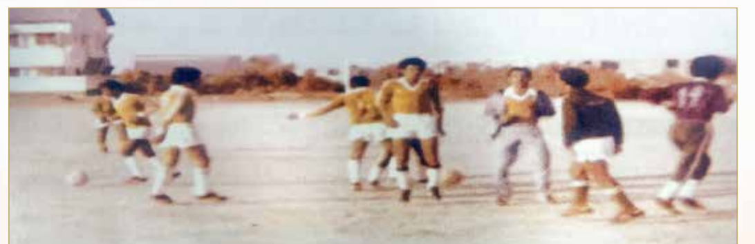
صورة للملعب الإضافي جنوب مركز الولادة السابق