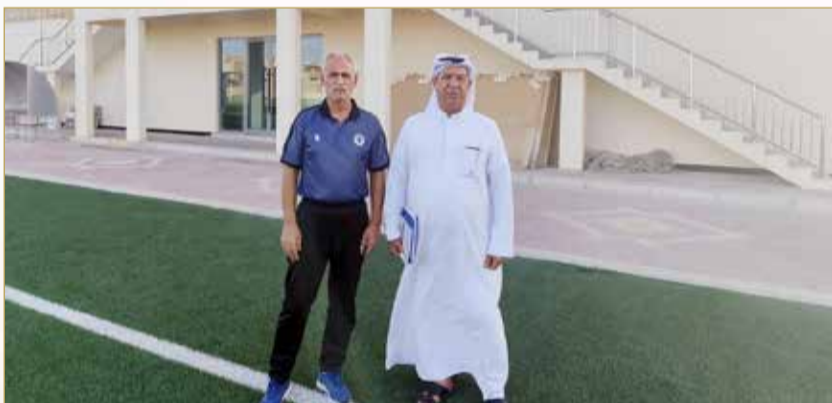
محرر الصفحة لدى زيارته نادي اتحاد الريف