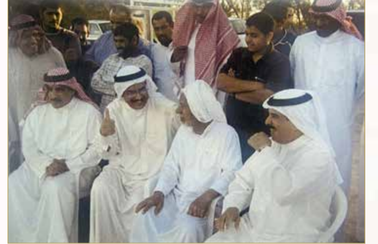
زيارة الملك المعظم للملعب اتحاد الريف بتاريخ 24 مارس 2004

وجود الأندية في المنامة والمحرق أسهم في تشكيل وعي جديد لدى أبناء القرى