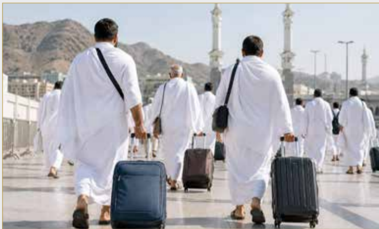
صورة تعبيرية باستخدام الذكاء الاصطناعي

أو الإصابة بنزلات معوية شديدة أو سعال حاد ومستمر.