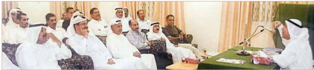
أمسية للمرحوم الشاعر عبدالرحمن رفيع في النادي بالعام 2007

وفواء لهذه المبادرة الكريمة، دأبت إدارات النادي على تنظيم دورة رياضية تحمل اسم المرحوم سمو الشيخ فيصل بن حمد آل خليفة سنوات متواصلة، برعاية كريمة من الديوان الملكي، وبدعم مباشر من صالح بن عيسى بن هندي، إلى جانب تشریف أنجال جلالة الملك المعظم لنهايات الدورة، وهو ما يعد مصدر اعتزاز دائم لأبناء النادي وأهالي المنطقة.