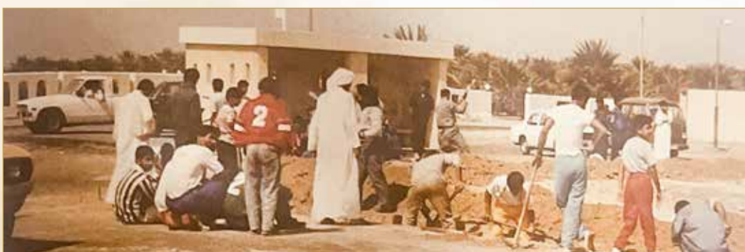
بعض أعضاء النادي وشباب قرية شهركان يشاركون في بناء سور النادي غربي القرية

حدث بتاريخ 23 مارس 2004م، عندما كان أبناء المنطقة يتابعون مباراة ضمن دورة تشييطية لكرة القدم على أحد الملاعب الرملية. وفي المباراة، تفاجأ الحضور بمرور صاحب الجلالة الملك حمد بن عيسى آل خليفة ملك البلاد المعظم، ممتطياً حصانه بالقرب من