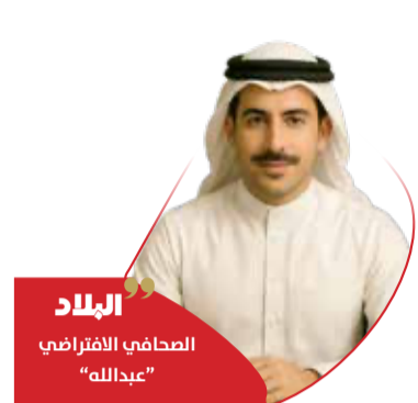
البلاد المصاحفي الافتراضي "عبدالله"

سعيد أن دول مجلس التعاون تمتلك فرصاً كبيرة للتحويل نحو الاقتصاد الدائري، مع إمكان إعادة تدوير نحو 75% من النفايات بحلول العام 2040، شريطة ضخ استثمارات ضخمة في البنية التحتية والتقنيات المتخصصة. وبحسب ما أورده التقرير، تنتج دول الخليج ما بين 150 و190 مليون طن من النفايات سنوياً، فيما تشكل مخلفات الأسمتات والخرسانة والبلاستيك والمعادن والنفايات الحيوية قرابة 70% من نفايات المنطقة، وهي قطاعات ترتبط مباشرة بمشاريع البنية التحتية والتطوير العقاري المتسارعة. وفي هذا السياق، يعكس مشروع المنطقة الشرقية توجهها عملياً نحو تحويل المخلفات من عبء بيئي إلى مورد اقتصادي، من خلال منظومة متكاملة تستهدف تدوير مخلفات البناء والهدم، والمخلفات العضوية، والزيوت المستعملة، والإطارات التالفة، والنفايات الإلكترونية، والبطاريات المستهلكة، إلى جانب المواد القابلة للاستخدام الصناعي. وأكدت أمانة المنطقة الشرقية أن العام 2025 شهد مرحلة متقدمة من التحول نحو الاقتصاد الأخضر، عبر ترسية حزمة من المشاريع الاستثمارية الجديدة لإنشاء وتشغيل مصانع