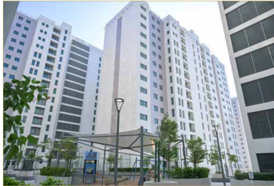
مشروع الجيل المطور للعمارات السكنية بمدينة سلمان