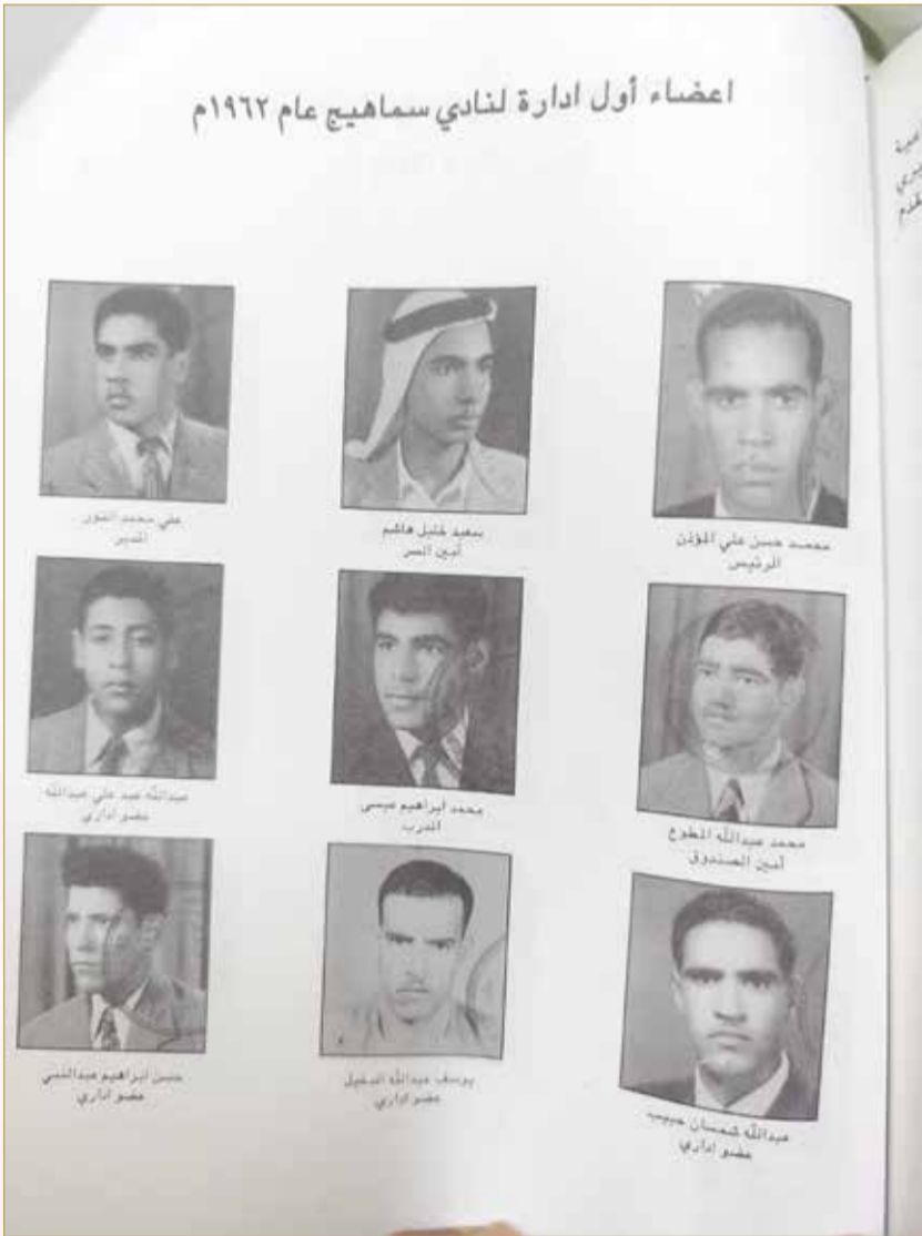
أعضاء أول مجلس إدارة لنادي سماهيج في العام 1962

مقاولات محمد جعفر الحايكي، ومؤسسة جعفر معراج لمقاولات البناء، ومؤسسة معراج الكهربائية، الذين لعبوا دوراً بارزاً في دفع عملية البناء، ولكننا ما زلنا نتطلع لبناء مقر نموذجي دائم يستطعن أن يحتضن جميع شباب القرية“. وقد استطاع النادي أن يجعل من بعض الأنشطة تقليداً يُقام سنوياً، مثل السوق الخيري الذي بدأ منذ عام 1991م، والموسم الثقافي الذي بدأ عام 1991م، وأيضاً الدورة السابعة لكرة القدم التي بدأت منذ عام 1979م، هذا عدا الأنشطة والمشاركات الخارجية المتنوعة.