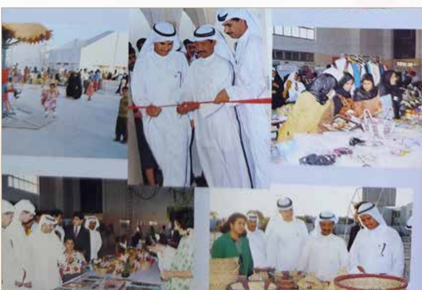
السوق الخيري بتنظيم نادي سماهيج في العام 1993