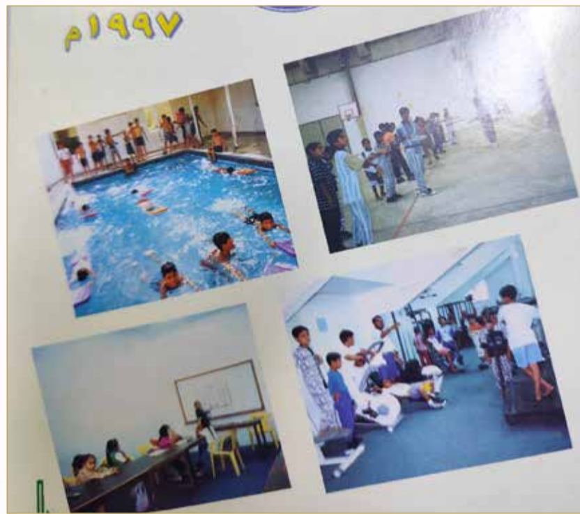
مطوية عن النشاط الصيفي بنادي سماهيج في العام 1997

لم يُكتب لفريق ”السد العالي“ النجاح والاستمرار، فبعد أشهر قليلة اشتد التنافس بين الشباب وتحول إلى صراع على إدارة