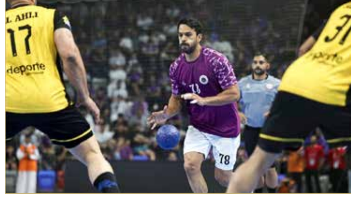
البلاد | المحرر الرياضي

أعلن الاتحاد البحريني لكرة اليد الجدول الزمني للمسابقات المحلية للموسم الرياضي 2026 - 2027، متضمناً مواعيد فترات التسجيل وانطلاق مسابقات مختلف الفئات العمرية، وذلك ضمن استعداداته للموسم الجديد الذي يشهد العديد من الاستحقاقات المحلية والخارجية. ووفقاً للوزنمة المعتمدة، تبدأ فترة التسجيل الأولى لفرق الدرجة الأولى في الأول من يوليو 2026 وتستمر حتى الأول من أكتوبر 2026، فيما تنطلق فترة التسجيل الأولى لبقية الفئات في الأول من يوليو المقبل وفق ما تنص عليه اللوائح المنظمة للمسابقات.