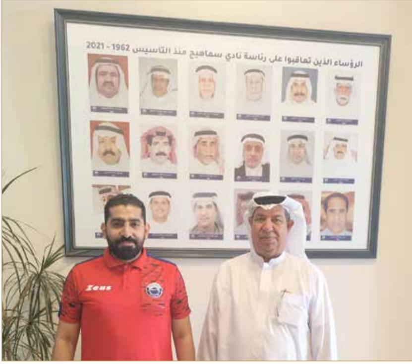
”البلاد“ مع السكرتير التنفيذي بنادي سماهيج