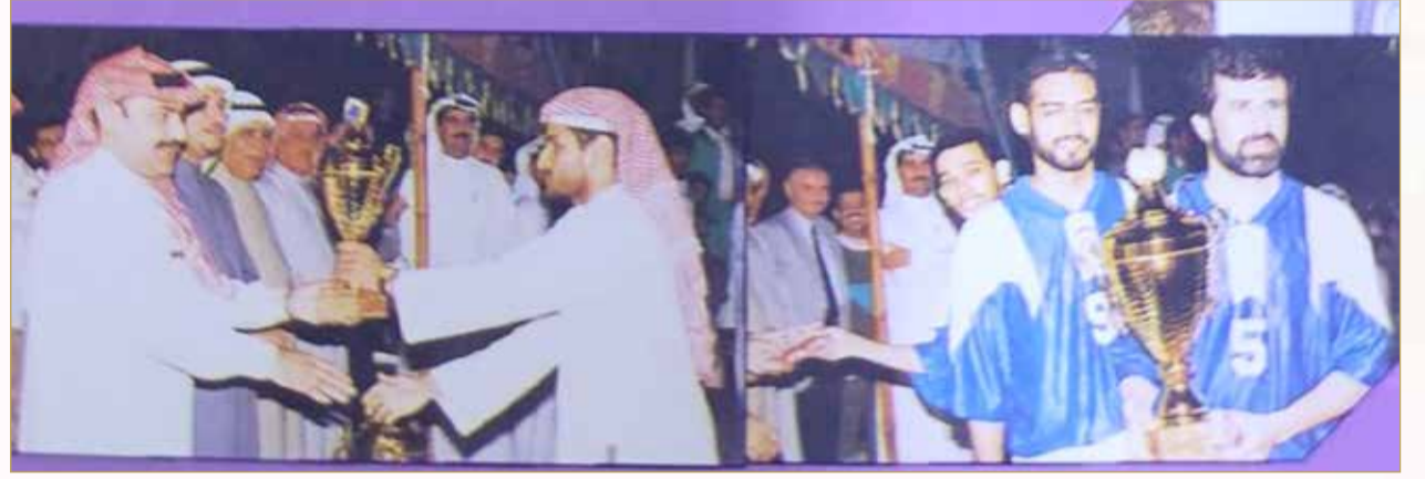
غلاف نشرة عن الدورة السابعة التاسعة لكرة القدم في العام 1996