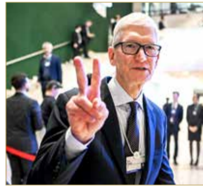
الرئيس التنفيذي للشركة تيم كوك

وأوضح كوك أن الشركة تحاول قدر الإمكان امتصاص جزء من هذه الزيادات لحماية المستهلكين، لكنها تواجه ضغوطاً متصاعدة من الموردين الذين يمررون زيادات كبيرة في