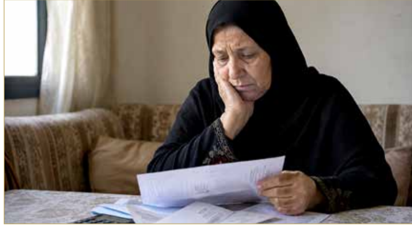
صورة تعبيرية مولدة بالذكاء الاصطناعي

كثيرة مثل مصاريف المنزل والبنزين والمستلزمات اليومية دون أي قدرة على تلبيةها. وأشارت إلى أنها لم تعد قادرة على العمل أو حتى أداء مهام كانت تقوم بها سابقًا، مثل إيصال الأطفال إلى المدارس، بعدما تقدمت بالسن وأصبحت غير قادرة على الحركة والعمل كما في السابق. وطالبت في ختام مناشدتها الجهات