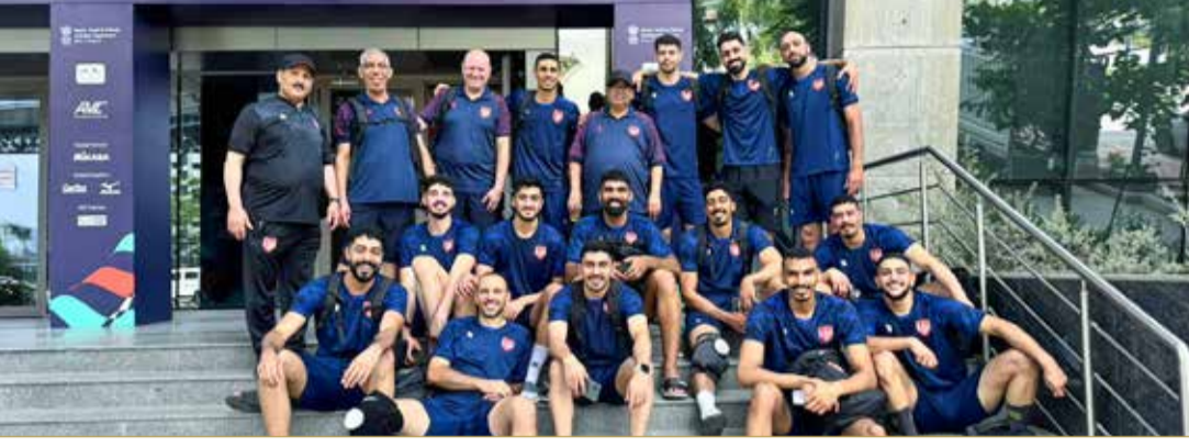
منتخبنا الوطني لحظة وصوله الهند

البطولة اليوم السبت بمواجهة الصين تايبيه عند الساعة 9:30 صباحاً، على أن يلتقي نيوزيلندا يوم الأحد، ثم يواجه الهند يوم الثلاثاء 23 يونيو، وكازاخستان يوم الخميس 25 يونيو، ويختتم دور المجموعات بمواجهة أستراليا يوم الجمعة 26 يونيو. ويدخل منتخب البحرين البطولة بطموحات عالية للمنافسة على اللقب، خصوصاً بعد تتويجه بالبطولة في النسختة ما قبل الماضية.