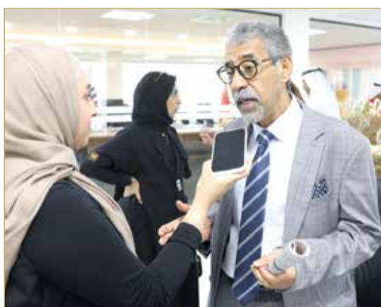
البلاد مع د. عبدالقادر المرزوقي

يحكي الأجزاء الكوميدية للعمل الذي انطلق عرض حلقاته أمس على "MBC شاهد". استهلّت الأمسية التي أقيمت في فندق رويال سميراميس في دمشق، بوصول الممثلين والمحتفلين إلى قاعة الاحتفال، حيث مزوا على السجادة الحمراء أمام عدسات المصورين وسط لقاءات ومقابلات جمعت النجوم بأهل الصحافة والإعلام. بعد ذلك، انتقل الحضور إلى القاعة الرئيسية، حيث رحّب النجوم وصانع العمل بالضيوف، وتحديثًا عن كواليس المشروع. تُعرض الكوميديا الاجتماعية "حب ع ورق" على "MBC شاهد".