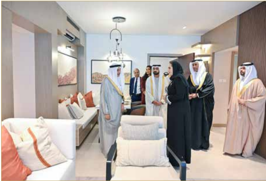
افتتاح نائب رئيس مجلس الوزراء مشروع الجيل المطور للعمارات السكنية بمدينة سلمان

شركة أمن متخصصة لإدارة المشروع والمحافظة على سلامته على مدار الساعة المشروع يضم حدائق معلقة وملعب للأطفال واستراحات للسكان