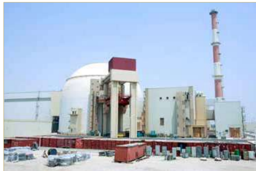
مفاعل بوشهر النووي الإيراني - أرشيفية

مع استمرار المحادثات الفنية في سويسرا، قال الرئيس الأميركي دونالد ترامب في منشور على "تروث سوشيال" الاثنين إن إيران ستوافق على إجراء عمليات تفتيش رئيسية عن الأسلحة لضمان "الشفافية النووية" على المدى البعيد.