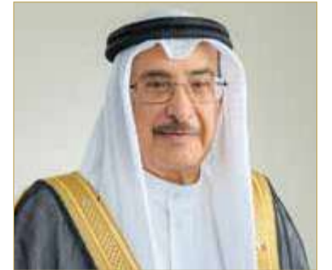
نائب رئيس مجلس الوزراء

بنأ ترأس الشيخ خالد بن عبدالله آل خليفة نائب رئيس مجلس الوزراء الاجتماع الاعتيادي الأسبوعي لمجلس الوزراء، الذي عُقد أمس بقصر القضيبي. وفي مستهل الاجتماع، أشاد مجلس الوزراء بالأمر الملكي السامي الصادر عن صاحب الجلالة الملك حمد بن عيسى آل خليفة ملك البلاد المعظم، بإنشاء وتشكيل لجنة توثيق ملحمة الصمود الوطني التي