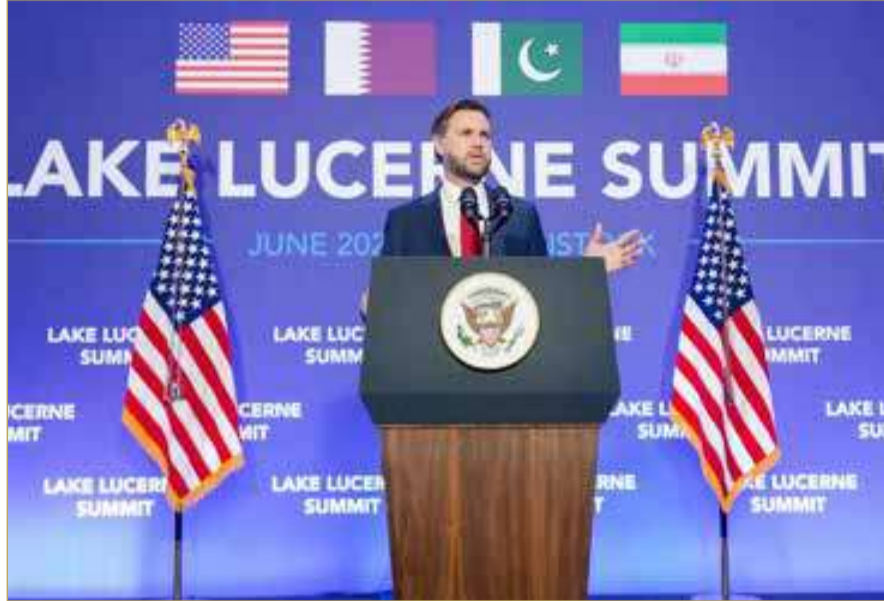
نائب الرئيس الأميركي

وشدد فانس على أن الإفراج بموجب التفاهم عن أي أصول إيرانية مجمدة، يضمن عدم صرفها في تمويل "الإرهاب". وأوضح أن واشنطن أرادت "وضع عملية تتيح لنا، إذا اضطرتنا يوماً إلى الإفراج عن أصول إيرانية، التأكد من أن هذه الأموال الإيرانية تقيد الشعب الإيراني ولا تُستخدم في تمويل الإرهاب". وفي متابعة للجهود الدبلوماسية، أفاد مسؤول إيراني بأن الرئيس مسعود بيزشكيان سيزور باكستان الثلاثاء.