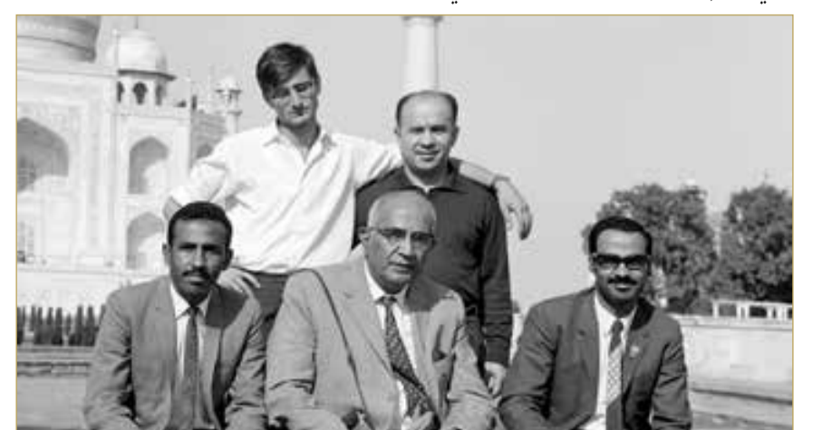
صورة بتوسلها الأستاذ الكبير الشاعر إبراهيم العريض، والشاعر الراحل علي عبدالله خليفة على يمينه

فقدت البحرين اليوم أديباً وشاعرًا استثنائيًا، وشخصية بارزة من أعلام الفكر والثقافة في الخليج والعالم العربي، هو الشاعر والمعلم علي عبدالله خليفة، الذي رحل بعد مسيرة طويلة حافلة بالإبداع والعطاء. شكّل الراحل تجربة شعرية متفردة، لم تكتف بوصف المشهد الخارجي، بل غاصت في العمق الإنساني والهوية البحرينية، وقدمت قراءة جمالية لروح المكان والإنسان، عبر نصوص تتبع من تأمل صادق ورؤية فنية أصيلة.