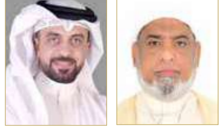
غلاي آل رحمة