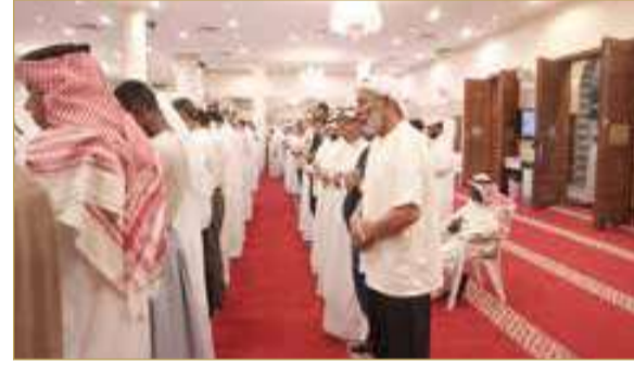
البلاد | حسن عبدالرسول

شيعت جماهير غفيرة من المواطنين والمقيمين، إلى جانب عدد كبير من الأدباء والمثقفين والأكاديميين والمسؤولين ومحبي الفقيه، الشاعر والأديب البحريني علي عبدالله خليفة إلى مشواه الأخير في مقبرة المحرق، وسط أجواء خيم عليها الحزن والأسى لفقدان أحد أبرز رموز الثقافة والأدب في مملكة البحرين ودول الخليج العربية. وشهدت مراسم التشييع حضوراً واسعاً من مختلف شرائح المجتمع، الذين حرصوا على المشاركة في وداع الراحل واستذكار مناقبه ومسيرته الحافلة بالعباءة والإبداع، مؤكداً أن رحيله يمثل خسارة كبيرة للساحة الثقافية والأدبية، بعد عقود طويلة قضاها في خدمة الثقافة والفكر والتراث، وأسهم خلالها في بناء مؤسسات ثقافية راسخة وتعزيز حضور الثقافة البحرينية على المستويات الخليجية والعربية والدولية.