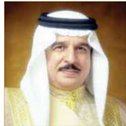
ملك البلاد المعظم