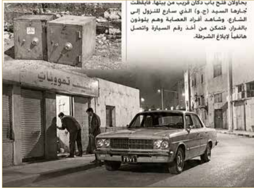
صورة مولدة بالذكاء الاصطناعي