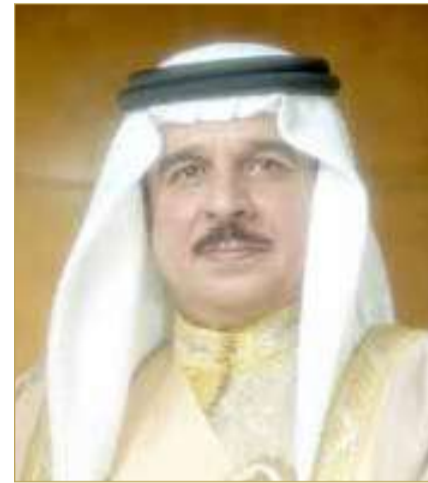
ملك البلاد المعظم

المختصة باشرت التحقيقات بالتعاون مع الجهات ذات العلاقة للوقوف على أسباب سقوط وتحطم المروحية. وأكد المصدر أن التحقيقات ما تزال جارية للكشف عن ملابسات الحادثة.