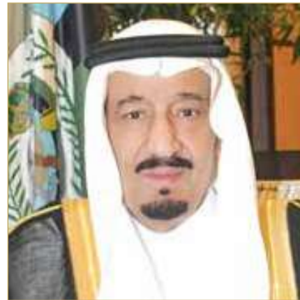
عاهل المملكة العربية السعودية