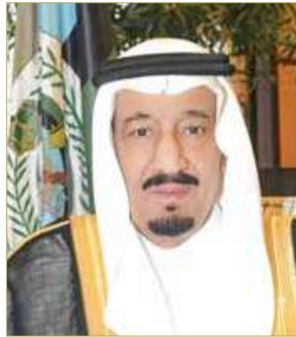
عاهل المملكة العربية السعودية الشقيقة