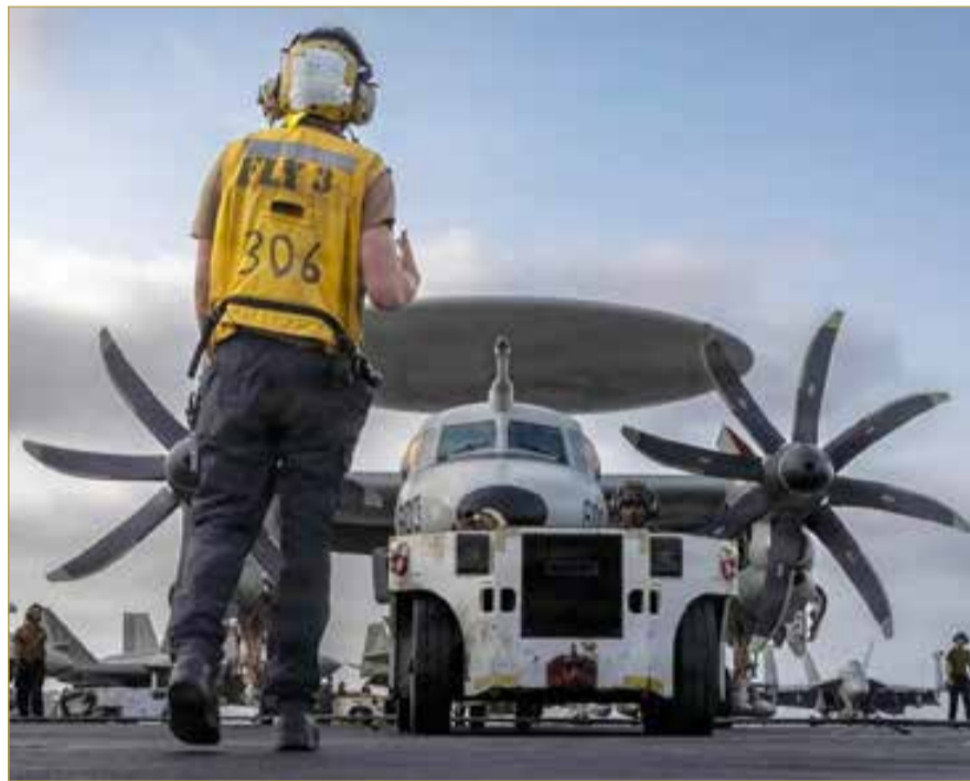
بحارة أميركيون يجهبزون طائرة الإنذار المبكر للإقلاع على متن حاملة الطائرات "يو إس إس أبراهام لينكولن"

صدّق الرئيس الأميركي دونالد ترامب تحذيره لإيران، ملوحاً بأن الولايات المتحدة قد تعود إلى حرب أوسع، وتكمل المهمة عسكرياً، بعدما نفذت قواتها جولة ثانية من الضربات على مواقع إيرانية، ليل السبت - فجر الأحد.