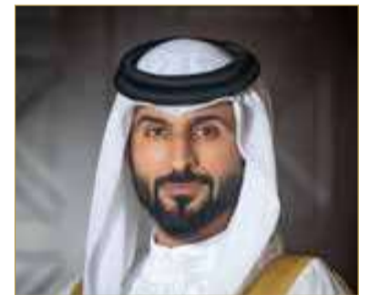
ناصر بن حمد يوجه إلى إطلاق معسكر "قدها" التدريبي للشباب