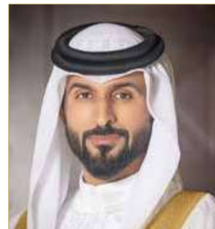
سمو الفريق الركن الشيخ ناصر بن حمد

وبهيتها الوطنية وانتمائها الصادق للوطن. وتابع سموه: "نحرص على توفير برامج نوعية تتيح للشباب والفتيات اكتساب الخبرات والمهارات الحياتية التي تعزز جاهزيتهم للمستقبل، وتعرفهم بالدور الوطني الكبير الذي تقوم به الأجهزة العسكرية والأمنية في حماية الوطن وصون منجزاته، بما يعزز لديهم قيم الولاء والمواطنة الإيجابية". ويوفر المعسكر تجربة تدريبية مكثفة بإجمالي 30 ساعة تدريبية، إذ يخوض المشاركون برنامجاً يمتد على مدى 6 أيام لكل مجموعة، يومياً من الساعة التاسعة صباحاً حتى الثانية ظهراً، ضمن بيئة تدريبية متكاملة داخل مركز البحرين العالمي للمعارض.