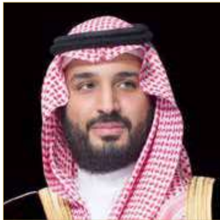
ولي العهد رئيس الوزراء بالمملكة العربية السعودية