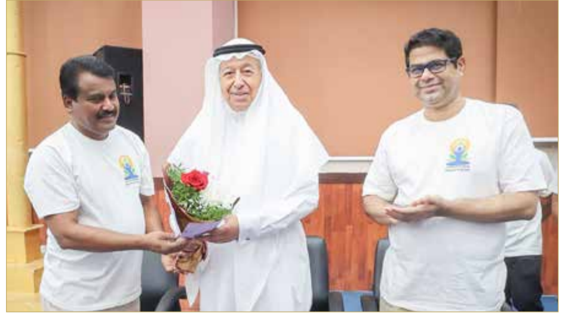
تكريم الشعلة بحضور السفير الهندي

البلاد | سعيد محمد سعيد