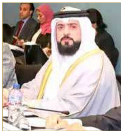
النائب محمد سلمان الاحمد

وشدد البرلمان العربي على أن أمن واستقرار المنطقة يمثلان مصلحة مشتركة لجميع دولها