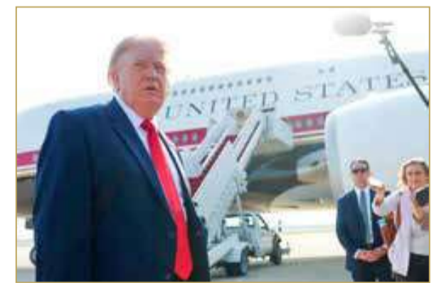
ترامب يستقل الطائرة الرئاسية للمرة الأولى

قال الرئيس الأميركي دونالد ترامب، الأربعاء، إن الجهود الرامية إلى نزع السلاح النووي من إيران تمضي بصورة جيدة، مشيداً بأحدث الاجتماعات في قطر، في وقت ربط فيه التقدم الدبلوماسي بارتفاع سوق الأسهم وتراجع أسعار النفط والبنزين. وقال ترامب للصحافيين في قاعدة أندروز المشتركة، قبل صعوده إلى الطائرة الرئاسية الجديدة التي أهدتها قطر إلى الولايات المتحدة: "إن نزع السلاح النووي من إيران يعطي بصورة