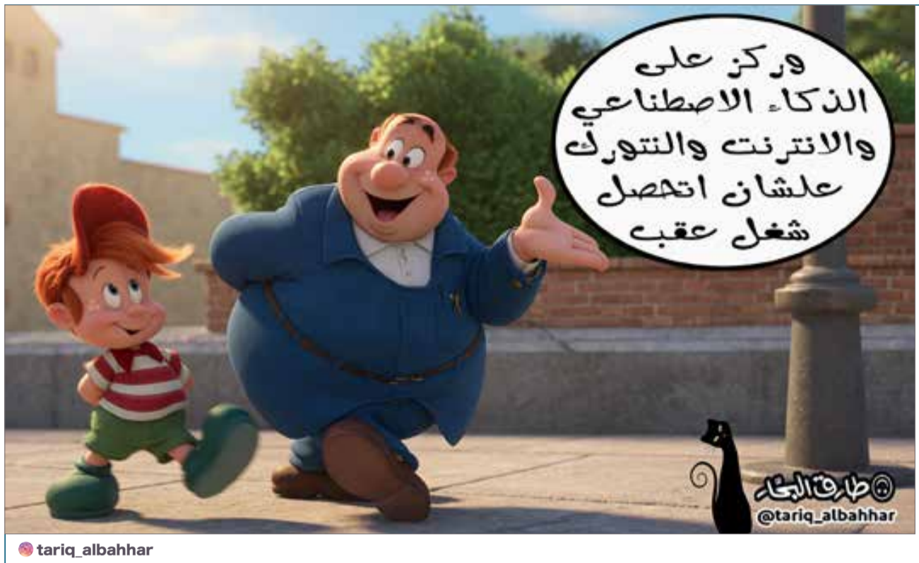
البلاد | كاريكاتير طارق البحار

واصل فيلم 'The Devil Wears Prada 2' تحقيق نجاحه في دور العرض العالمية، بعدما بلغت إيراداته 676 مليون دولار حول العالم، ليدفع إجمالي إيرادات السلسلة إلى أكثر من مليار دولار للمرة الأولى. ويأتي هذا الإنجاز بعد أن حقق الفيلم الأصلي، الذي عُرض عام 2004، إيرادات بلغت 326 مليون دولار عالميًا.