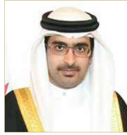
سمو محافظ الجنوبية

مع نهاية شهر يونيو 2026، ما يقارب 1257 استفسار وطلب في المجالات الأمنية والخدمية والاجتماعية، حيث صنفت نسبة الطلبات حسب التقسيم التالي: المجال الأمني بلغت نسبته 24% ، أما المجال الاجتماعي بنسبة 40% ، في حين المجال الخدمي بنسبة بلغت 36% ، وذلك منذ مطلع العام. هذا وقد أفاد سمو محافظ المحافظة الجنوبية، بأن وحدة الاستعلامات والشكاوى تتبع منهجية منظمة للتعامل مع شكاوى وملاحظات الأهالي، من خلال تصنيف وتحليل مختلف الطلبات والمقترحات، ومن ثم إرسالها لإدارات المعنية، ويعقب ذلك مباشرة قيام فريق الرصد الميداني