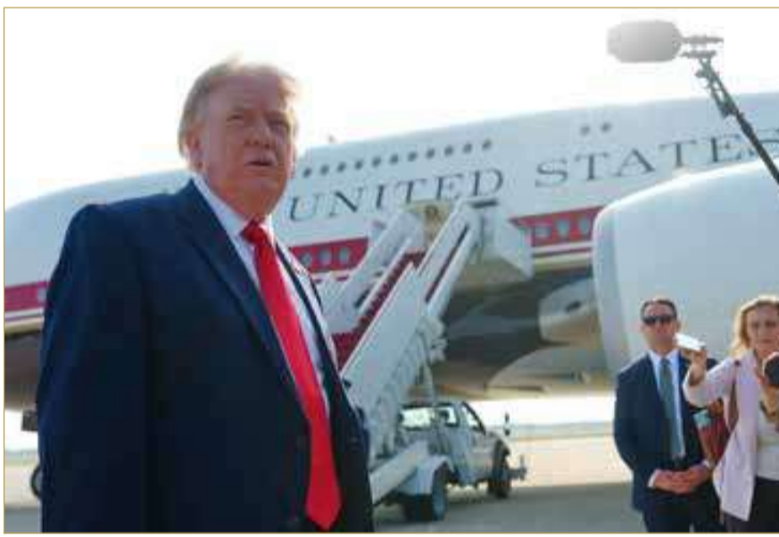
ترامب يستقل الطائرة الرئاسية لأول مرة

فرجينيا، أن المفاوضات الفيين يجتمعون مع الإيرانيين والقطريين وأطراف أخرى لبحث تفاصيل المحادثات. وقال: لا يزال الوقت مبكراً إلى حد ما، لكن المحادثات تسير على نحو جيد، مضيفاً: نحن قلقون بشأن الملف النووي، وسنبداً الحديث عنه. وخلال كلمته في قاعدة أوشيانا الجوية البحرية في فرجينيا بيتش، شكر فانس الجيش الأميركي، وقال إن المفاوضات مع إيران تمضي ليس من موقع ضعف، بل من موقع قوة. وأضاف أن ترامب يتفاوض من موقع دُمر فيه البرنامج النووي الإيراني، كما دُمرت قواتها العسكرية التقليدية أيضاً، منتقداً من يهاجمون الإدارة بسبب التفاوض، وقال إنهم أنفسهم الذين دعوا سابقاً إلى إلقاء مزيد من القنابل في أماكن مثل أفغانستان.