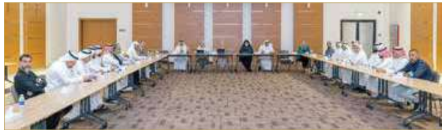
صاحبة السيف - وزارة شؤون الشباب

ترأست روان توفيقني وزيرة شؤون الشباب اجتماع لجنة التعاون بين وزارة شؤون الشباب ومراكز تمكين الشباب، وذلك في إطار حرص الوزارة على مواصلة تعزيز الشراكة المؤسسية مع المراكز الشبابية، وتطوير قنوات التواصل والتنسيق المشترك، بما يسهم في تطوير العمل الشبابي وتحقيق مستهدفات الاستراتيجية الوطنية لتمكين الشباب 2023 - 2028، انطلاقاً من الدور المحوري الذي تضطلع به المراكز الشبابية في خدمة الشباب البحريني وتنمية قدراتهم.