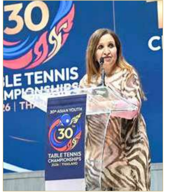
الشيخة حياة بنت عبدالعزيز

أقلت الشيخة حياة بنت عبدالعزيز آل خليفة رئيس الإتحاد البحريني لكرة الطاولة نائب رئيس الإتحاد الآسيوي لكرة الطاولة عن منطقة غرب آسيا كلمة افتتاح بطولة آسيا للشباب في العاصمة التايلندية بانكوك، بتكليف من خليل بن أحمد المهدي رئيس الإتحاد الآسيوي لكرة الطاولة. وقالت الشيخة حياة بنت عبدالعزيز آل خليفة في كلمة الافتتاح إن بطولة الشباب للفئات العمرية 15 و17 سنة تمثل أهمية بالغة للاتحاد الآسيوي لكرة الطاولة باعتبارها نقطة الانطلاق الحقيقية للمواهب في هذه اللعبة التي تمتلك إرثاً كبيراً في القارة الآسيوية ولحق أبطال المستقبل. ووجهت الشيخة حياة بنت عبدالعزيز آل خليفة في كلمتها رسالة معبرة للاعبين المشاركين حيث قالت " لا