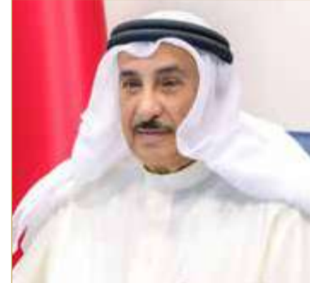
الشيخ خالد بن عبدالله

كما أخذت اللجنة علماً بأخر مستجدات مشروع الكشف عن التغييرات ومخالفات البناء باستخدام الذكاء الاصطناعي ومنصة رصد عدد الأشجار، في إطار التعاون القائم بين جهاز المساحة والتسجيل العقاري ووزارة شؤون البلديات والزراعة.