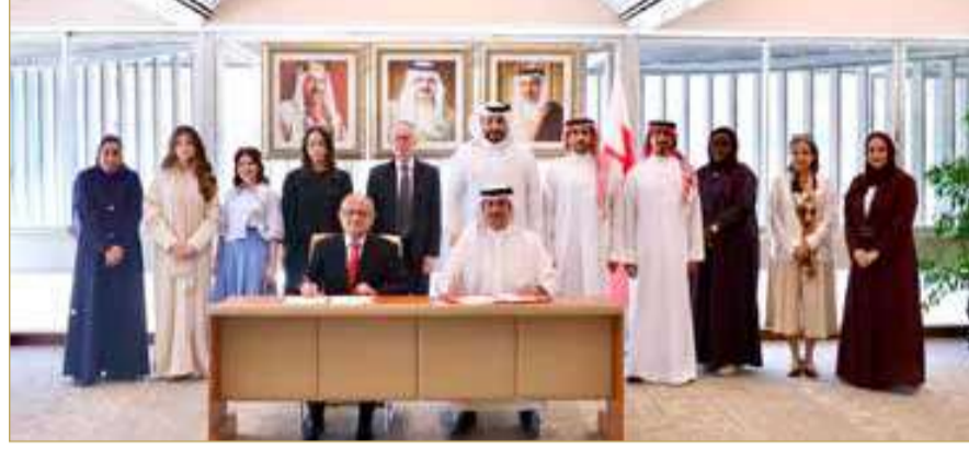
وزارة العدل والشؤون الإسلامية والأوقاف

وقّع نواف بن محمد المعاودة وزير العدل والشؤون الإسلامية والأوقاف، والدكتور إبراهيم محمد جناحي رئيس الجامعة البريطانية، مذكرة تفاهم بين معهد الدراسات القضائية والقانونية، والجامعة البريطانية، تهدف إلى تعزيز التعاون العلمي والمهني المشترك في مجالات الدراسات القانونية والتدريب المهني.