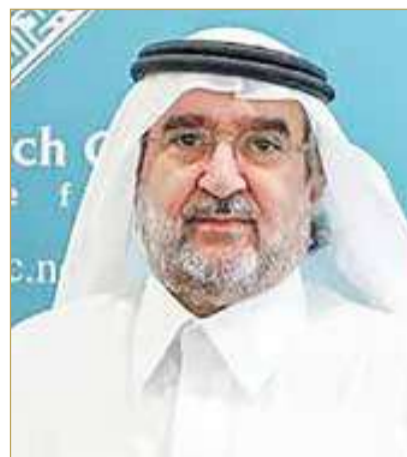
د.عبدالعزیز بن صقر

وأشار إلى أن دول الخليج رفضت خلال الحرب فتح مجالها الجوي أو استخدام أراضيها لضرب إيران، رغم أنها تلقت هجمات متتالية من إيران والميليشيات التابعة لها، وتعرضت منشآتها الحيوية لمخاطر كبيرة، إلا أنها تمسكت بضبط النفس ورفضت الانجرار إلى حرب اعتبرت لا ناقة لها فيها ولا جمل. وحدد بن صقر ثلاثة اتجاهات للمرحلة المقبلة، تبدأ بتثبيت السلام والاستقرار وإطفاء بؤر الصراع، وتحقيق الردع الذي يحفظ السلم ويمنع الاعتداء بالقدرات الذاتية أو عبر شراكات ترتضيها دول الخليج، على أن تكون اليد العليا لدول