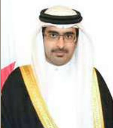
سمو محافظ الجنوبية