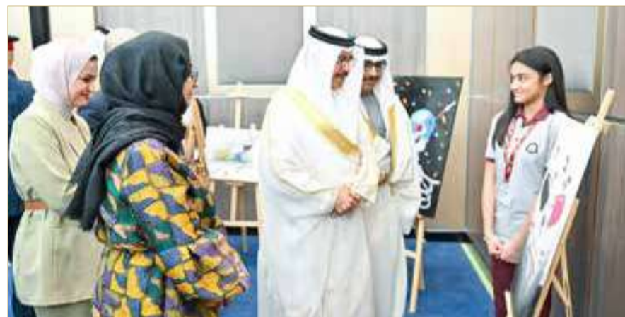
وزير الداخلية يشهد الاحتفال بمناسبة اليوم العالمي لمكافحة المخدرات