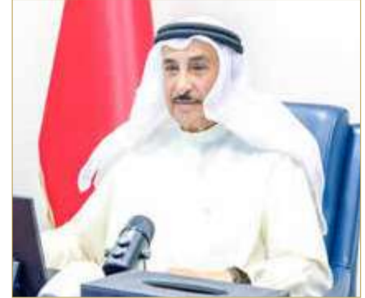
الشيخ خالد بن عبدالله

مكافحة الآفة مسؤولة وطنية مشتركة تتطلب تكاتف جميع فئات المجتمع... وزير الداخلية: