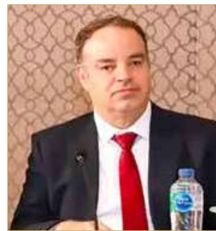
النائب د. هشام أحمد العشيرى

ويشدد البرلمان العربي على خطورة التداعيات السلبية المترتبة على استهداف المنشآت النووية والنظمية، على كافة الأصدقاء العسكرية والاقتصادية والبيئية والتي تتخطى آثارها حدود المنطقة لتطال العالم بأسره، وتعرض السلم والأمن الدوليين للخطر. وعبر البرلمان العربي عن تضامنه ودعمه الكامل لسيادة ووحدة الأراضي العربية، ويرفض رفضاً قاطعاً أية تدخلات أو ممارسات أو أعمال عدائية تمس سيادة واستقلال ووحدة أراض أي قطر عربي، ويؤكد أن أي اعتداء عليه يعد بمثابة اعتداء على الأمن العربي الجماعي، وذلك اتساقاً مع ما نصت عليه الاتفاقيات العربية ذات الصلة وكافة المواثيق والأعراف الدولية التي تدعو إلى احترام سيادة الدول وعدم التدخل في شؤونها الداخلية، والامتنال الكامل لقرار مجلس الأمن رقم (2817)، والتوقف عن أية ممارسات تهدد أمن واستقرار المنطقة. (قرأ الموضوع كاملاً بالموقع الإلكتروني)