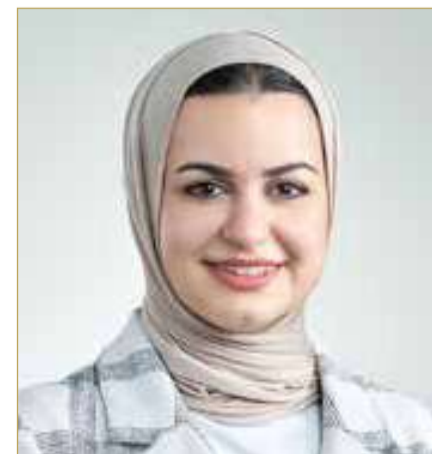
وزيرة شؤون الشباب

الذي يوليه سمو الشيخ ناصر بن حمد آل خليفة ممثل جلالة الملك للأعمال الإنسانية وشؤون الشباب رئيس المجلس الأعلى للشباب والرياضة، لتطوير مدينة شباب 2030 منذ انطلاقها، وحرص سموه المستمر على تجديد محتواها وإثراء برامجها بمسارات تدريبية نوعية تواكب المتغيرات العالمية وتلبي تطلعات الشباب البحريني واحتياجاتهم المستقبلية.