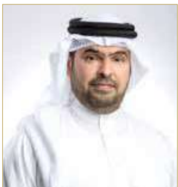
المهندس الشيخ مشعل بن محمد

شارع خليفة بن سلمان ليصبح بمسارين، إلى جانب تنفيذ أعمال حماية ونقل عدد من خدمات البنية التحتية المتأثرة بأعمال التطوير. وأكد الوكيل أن هذا المشروع يأتي ضمن خطط الوزارة الرامية إلى تطوير البنية التحتية لشبكة الطرق ورفع كفاءتها التشغيلية، من خلال تنفيذ مشاريع تسهم في تحسين مستوى الخدمات المقدمة لمستخدمي الطريق، وتوفير حلول مرورية تعزز انسيابية التنقل وترفع مستوى السلامة المرورية.