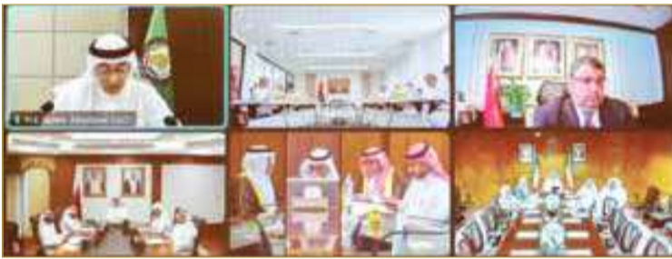
المنامة - وزارة شؤون الكهرباء والماء

الماء، مشيداً بجهود الأمانة العامة في متابعة تنفيذ التوجيهات السامية لأصحاب الجلالة والسمو قادة دول المجلس، ودورها في دعم المبادرات الرامية إلى تعزيز الأمن المائي باعتباره أحد الركائز الأساسية لتحقيق التنمية المستدامة. وتم في الاجتماع مناقشة البنود المدرجة على جدول الأعمال، ومنها بحث ودراسة المشروعات الخليجية المتعلقة بالكهرباء والمياه، بما يسهم في رفع كفاءة إدارة الموارد وتعزيز جهودية دول المجلس في التعامل مع مختلف المتغيرات.