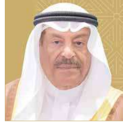
علي بن صالح الصالح

وأعرب حاجي عن خالص شكره وتقديره لمعالي السيد علي بن صالح الصالح، رئيس مجلس الشورى، على دعمه المتواصل للمؤتمر، مبيئاً أن هذا الدعم يجسد اهتمام مملكة البحرين بدعم الابتكار والتحول الرقمي، وترسيخ مكانتها بوصفها مركزاً إقليمياً ودولياً رائداً في مجالات الذكاء الاصطناعي والتقنيات المستقبلية.