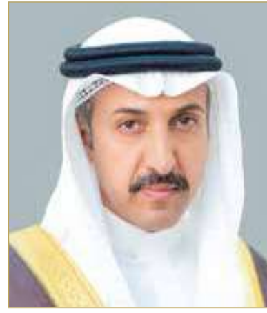
الدكتور الشيخ عبدالله بن أحمد

التغطية وجودة النفاذ إلى الخدمات الرقمية. وبين الوزير أن هذه النتائج حافز لمواصلة تعزيز مكانة المملكة كمركز إقليمي رائد في قطاع الاتصالات وتقنية المعلومات، والمحافظة على موقعها ضمن أفضل الدول عالمياً في مؤشرات هذا القطاع الحيوي، مضيفاً أن هذا الإنجاز يعكس ثمرة التعاون