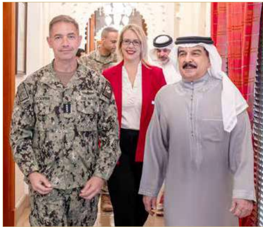
جلالة الملك المعظم القائد الأعلى للقوات المسلحة يستقبل قائد القيادة المركزية الأمريكية