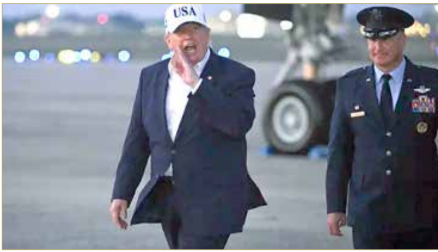
الرئيس الأميركي دونالد ترامب

روسيا، وسعي أوكرانيا إلى تطوير نسختها المحلية منها، يبرز تساؤل جوهري: كيف ستؤثر القنابل الانزلاقية في مستقبل الحرب بأوكرانيا؟ فأفادت السلطات الأوكرانية بأن قنابل انزلاقية روسية أسفرت عن مقتل شخصين وإصابة ما لا يقل عن 15 آخرين في هجوم استهدف مدينة زابوريجيا جنوب شرقي البلاد يوم الثلاثاء، وفقاً لصحيفة "إندبندنت". وقال حاكم المنطقة، إيفان فيدوروف، في رسالة عبر تطبيق تلغرام، إن القوات الروسية ألقت سبع قنابل على المدينة خلال 90 دقيقة. وفي زابوريجيا، كما في أنحاء واسعة من أوكرانيا، باتت هذه الضربات تُنفذ بوتيرة متزايدة باستخدام القنابل الانزلاقية، وهي ذخائر منخفضة التكلفة يرى خبراء عسكريون أنها تُعيد تشكيل مسار الحرب في أوكرانيا. وتتراوح أوزان هذه القنابل التقليدية، المزودة بأجنحة وأنظمة توجيه، بين بضع مئات وعدة آلاف من الكيلوغرامات، وقد أصبحت من بين أكثر الأسلحة الروسية فتكاً منذ بدء الغزو الشامل لأوكرانيا عام 2022.