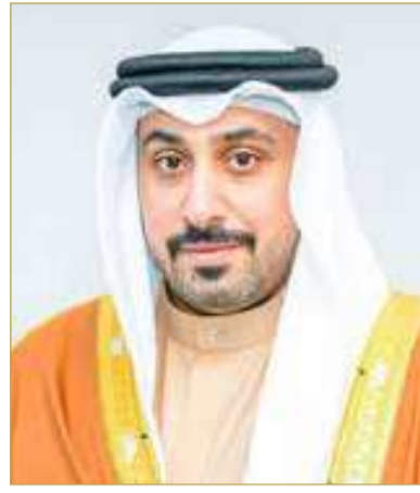
الشيخ أحمد بن دعيج

والتنسيق المستمر مع الجهات ذات العلاقة، وفي مقدمتها هيئة تنظيم الاتصالات، وشركات الاتصالات، وشركة بي نت (BNET)، بما أسهم في تطوير البنية التحتية الرقمية، ورفع جودة الخدمات، وتعزيز تنافسية مملكة البحرين على المستويين الإقليمي والعالمي. من جانبه، أوضح الشيخ أحمد بن عيسى بن دعيج آل خليفة، الوكيل المساعد للاتصالات بوزارة المواصلات والاتصالات، أن مملكة البحرين سجلت 99.1 نقطة في ركيزة الاتصال الشامل (Universal Connectivity)، و97 نقطة في ركيزة الاتصال الهادف (Meaningful Connectivity)، كما حققت الدرجة الكاملة، بواقع 100 نقطة، في أربعة مؤشرات رئيسية شملت: نسبة مستخدمي الإنترنت، ونسبة الأسر المتصلة بالإنترنت، وتغطية شبكات النطاق العريض المتنقل، ونسبة امتلاك الهواتف المتنقلة، كما سجلت نتائج مرتفعة في مؤشري انتشار اشتراكات النطاق العريض المتنقل وحركة بيانات النطاق العريض المتنقل.