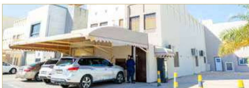
تسليم دفعة جديدة من المنازل المتضررة بمدينة الحد الإسكانية جراء الاعتداءات الإيرانية الأثمة بعد الانتهاء من إصلاح الأضرار