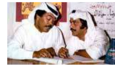
البلاد | طارق البهار

شهد مسرح إثراء مساء أمس الأربعاء عرض الفيلم الوثائقي "بقشة سعد"، بحضور الفنان الكويتي القدير سعد الفرج، ضمن فعاليات مهرجان أفلام السعودية 12، في رحلة مع أحد أبرز رواد الفن الخليجي، للكشف عن محطات إنسانية وفنية امتدت لأكثر من خمسة عقود.