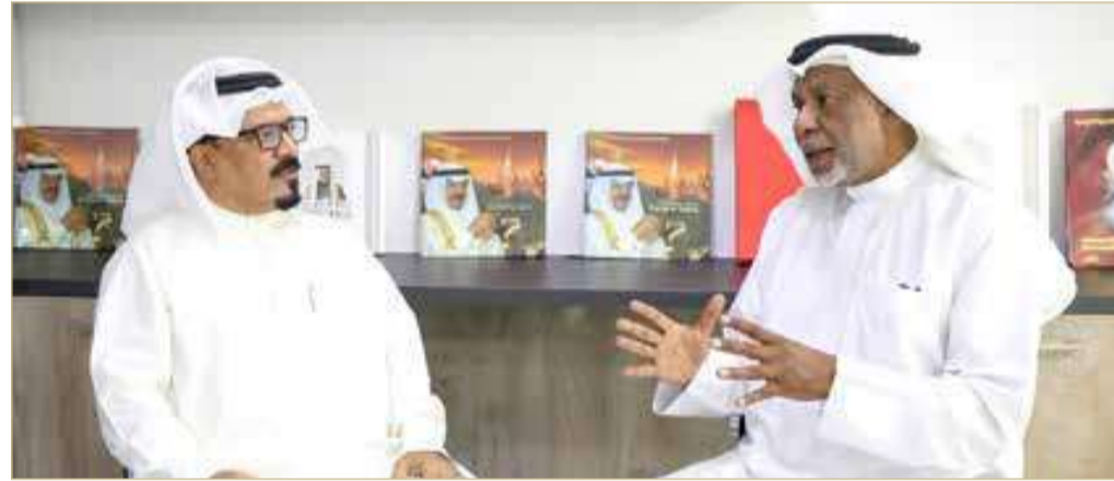
فخر في حوار مع "البلاد"

وطموحنا أن نرى خلال السنوات المقبلة عشرات الشركات البحرينية الصغيرة تتحول إلى علامات تجارية خليجية، وأن ترتفع مساهمة المؤسسات الصغيرة والمتوسطة في الصادرات غير النفطية، بما يعزز مكانة البحرين كمركز إقليمي لريادة الأعمال والابتكار.