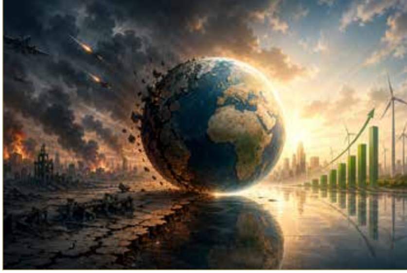
صورة مولدة بالذكاء الاصطناعي

تمثل منطقة الخليج العربي والبحر الأحمر شريانًا رئيسًا للتجارة العالمية، ولذلك فإن أي توتر أمني يعكس مباشرة على حركة الشحن البحري. وخلال فترات التصعيد، ترتفع أقساط التأمين على السفن، وتزداد تكاليف النقل، كما