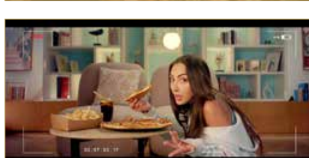
البلاد | طارق البحار

ألمح توقيت خاص يفرضه على قلوبنا أم أنه يباغتتنا حينما نكون في أقصى درجات الغفلة؟ هذا هو السؤال المحوري الذي يطرحه فيلم "أحبك من زمان"، أحدث إنتاجات "نتفليكس" في عالم الكوميديا الرومانسية، الذي كشفت المنصة أخيراً عن "بوستر" رسمي له، معلنة موعد عرضه العالمي الأول في 23 يوليو 2026. يأخذنا الفيلم في رحلة عاطفية بطلتها "هيا"، التي تجسد دورها النجمة نور الغندور، وهي فتاة وضعت صديقها المقرب "جواد"، الذي يلعب دوره علي كاكولي، في خانة "الصداقة الأبدية" بعيداً عن أي حسابات عاطفية، لكن الحياة، بتقلباتها ومفاجآتها غير المتوقعة، تبدأ في خلط الأوراق، ما يضطر "هيا" لمواجهة حقيقة مشاعرها في سلسلة من المواقف التي تمتزج فيها الرومانسية بالكوميديا، لتكشف لنا عن كيف يمكن للزمن والظروف أن تعيد صياغة العلاقات الإنسانية. العمل الذي يحمل توقيع المخرج إيبي السمعان والكاتب إيباد صالح، لا يعتمد فقط على ثنائية الغندور وكاكولي، بل يضم كوكبة من نجوم الدراما الخليجية، منهم فاطمة الشريف، وشوق الهادي، بالإضافة إلى المؤثرة نهي نبييل التي تخطو أولى خطواتها السينمائية عبر شخصية "زينة"، في إضافة لافتة لمسيرتها المهنية. وبعد "أحبك من زمان" ثمرة للتعاون الثالث بين شركة "إيغل فيلمز" بقيادة المنتج جمال سنان ومنصة "نتفليكس"، في إطار سعيها المستمر لتقديم أعمال عربية ذات صبغة عالمية. ومع اقتراب موعد العرض الحصري في 23 يوليو، يطل الجمهور بانتظار إجابة الفيلم عن التساؤل العميق الذي يطرحه: أيأتي الحب حين نسعى إليه أم حين يقرر هو أن يكتب بدايته الخاصة؟