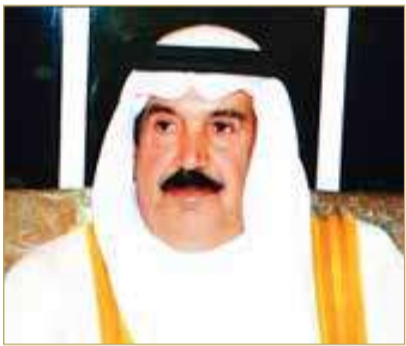
ديعج بن سلمان

إلى مشاريع ذات أثر تنموي ملموس. وأشار الشيخ دعيج بن سلمان آل خليفة إلى أن ما تمتلكه الدول العربية من طاقات شبابية واعدة يشكل رصيماً استراتيجياً يستوجب توفير البيئة الداعمة للإبداع والتميز، وترسيخ ثقافة المبادرة والإنجاز، بما يمكن الشباب من الإسهام بفاعلية في تحقيق أهداف التنمية وتعزيز تنافسية أوطانهم. واختتم تصريحه بالتأكيد على أن الشباب العربي أثبت في مختلف المحافل قدرته على الإنجاز والابتكار، داعياً إلى مواصلة العمل العربي المشترك لتمكين الشباب، وتوسيع آفاق مشاركتهم، وصناعة المزيد من قصص النجاح التي تعكس الوجه الحضاري للأمة العربية، وترسخ مكانتها على المستويين الإقليمي والدولي.