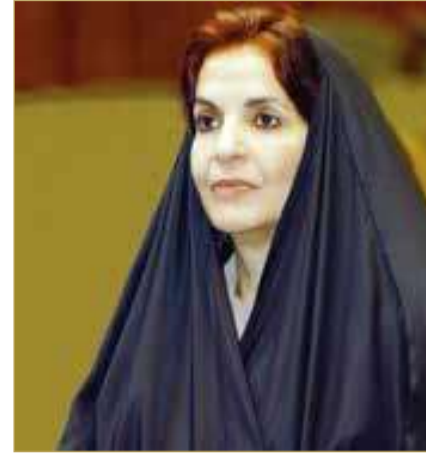
سمو الأميرة سبيكة بنت إبراهيم

وقد ثمنت صاحبة السمو الملكي الأميرة سبيكة بنت إبراهيم آل خليفة قرينة عاهل البلاد المعظم رئيسة المجلس الأعلى للمرأة، الرعاية الكريمة من حضرة صاحب الجلالة الملك المعظم لهذه المناسبة الوطنية الهامة، وقالت سموها في تصريح لها بهذه المناسبة "إنه ليسعدنا كثيراً أن نشارك في المناسبات الوطنية التي نستذكر من خلالها الأعمال الجليلة لقائد المسيرة حضرة صاحب الجلالة الملك حمد بن عيسى آل خليفة ملك مملكة البحرين المعظم، حفظه الله ورعاه، وتقديراً للأمر السامي بأن يحمل هذا العام اسم "عام عيسى الكبير"، احتفاءً بذكرى باني الدولة الحديثة وقائد النهضة المؤسسية، صاحب العظمة الشيخ عيسى بن علي آل خليفة "عيسى الكبير" حاكم البحرين وتوابعها، طيب الله ثراه، الذي