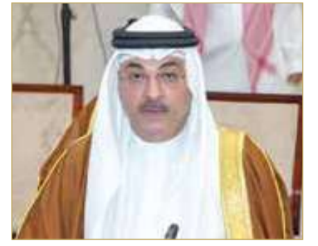
حسين آل شعيل

شارك حسين آل شعيل وكيل شؤون الطيران المدني، في أعمال الدورة التاسعة والعشرين للجمعية العامة للمنظمة العربية للطيران المدني، التي عُقدت في العاصمة المغربية الرباط، بمشاركة رؤساء هيئات وسلطات الطيران المدني في الدول العربية. وفي كلمته خلال أعمال الجمعية العامة، أكد حسين آل شعيل أن انعقاد هذه الدورة يأتي في ظل ظروف إقليمية ودولية دقيقة، شهدت خلالها منطقة الشرق الأوسط تطورات أمنية بالغة الخطورة، وما رافقها من تهديدات مباشرة للمجالات الجوية وحركة النقل الجوي والبنية التحتية للطيران المدني في دول مجلس التعاون لدول الخليج العربية نتيجة الاعتداءات الإيرانية