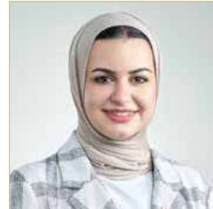
وزيرة شؤون الشباب

البيئة الداعمة لتنمية قدراتهم، وتعزيز إسهاماتهم في مختلف المجالات. وأضافت أن المتغيرات المتسارعة التي يشهدها العالم تعزز أهمية الاستثمار في الإنسان، مؤكداً أن تنمية قدرات الشباب، وتزويدهم بالمعارف والمهارات، وإتاحة الفرص النوعية أمامهم، تمثل دعامة رئيسية لمواصلة مسيرة التنمية وتحقيق المزيد من الإنجازات. وأعربت عن اعتزازها بما يحققه الشباب البحريني من إنجازات متميزة على المستويات المحلية والإقليمية والدولية، مؤكداً أن هذه النجاحات تعكس ما يتمتع به شباب المملكة من كفاءة وطموح وإبداع، وتجسد ثمار النهج الوطني الراسخ في الاستثمار في الإنسان وتمكينه. وفي ختام تصريحها، هنأت وزيرة شؤون الشباب، الشباب البحريني والعربي بمناسبة يوم الشباب العربي، معربة عن تمنياتها لهم بمزيد من التوفيق والنجاح، ومؤكدة أن الشباب يواصلون دورهم المحوري في دعم مسيرة التنمية وتحقيق تطلعات الأوطان نحو مستقبل أكثر ازدهاراً.