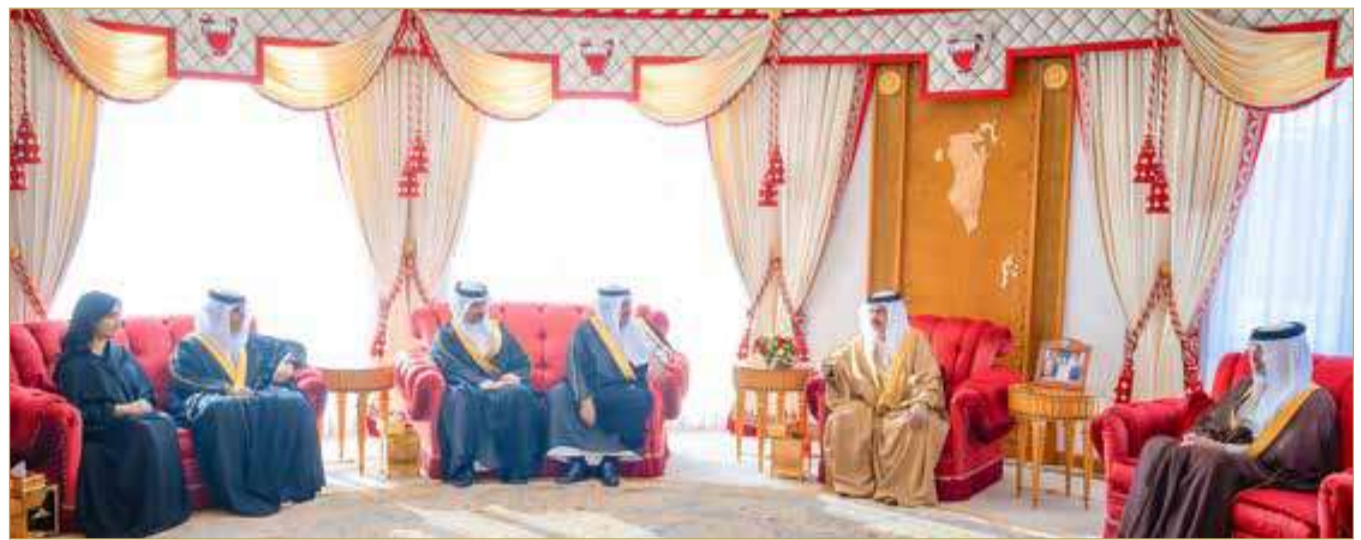
جلالة الملك المعظم يستقبل عائلة الأديب والشاعر علي عبدالله خليفة رحمه الله

لهم بوفاة فقيد العائلة الأديب والشاعر علي عبدالله خليفة. وفي اللقاء أكد جلالته الملك المعظم أن المملكة فقدت برحيل الأديب والشاعر علي عبدالله خليفة، رحمه الله، أحد أبرز رواد الثقافة والأدب والفنون والشعر في البحرين ومنطقة الخليج العربي. ووجه صاحب الجلالة الملك المعظم إلى