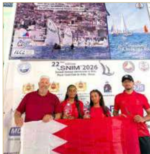
منتخبنا الوطني للشراع

الدوسري في فئة "ILCA 4"، ضمن برنامج إعداده للمشاركة في البطولة العربية للبنات المقررة في سلطنة عُمان نهاية شهر أكتوبر 2026.