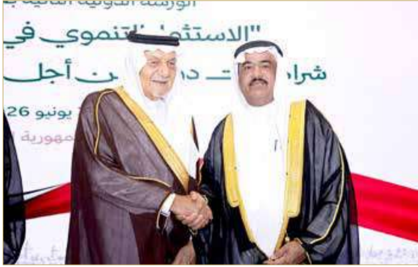
الأمير تركي الفيصل وإبراهيم الدوسري وقعا على الاتفاقية

وقّع على الاتفاقية عن صندوق تمكين القدس للتنمية صاحب السمو الملكي الأمير تركي الفيصل بن عبدالعزيز آل سعود رئيس مجلس أمناء صندوق تمكين القدس، وعن المؤسسة الملكية للأعمال الإنسانية "وقف الدوسري القائم بأعمال الأمين العام للمؤسسة."