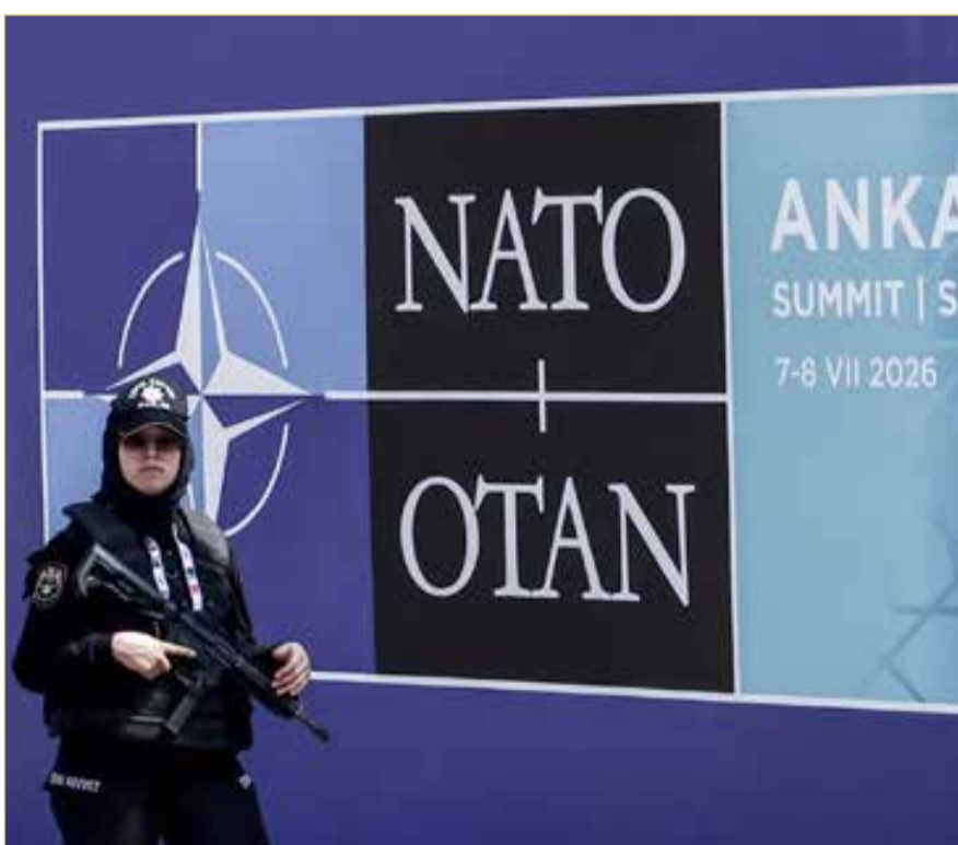
شرطة تركية تشارك في عملية تأمين قمة حلف "ناتو" عشية انطلاقها بأنقرة

يبحث قادة الدول الأعضاء في حلف شمال الأطلسي (ناتو) خلال قمتهم الـ36 التي تنطلق في أنقرة الثلاثاء، على مدى يومين، عدداً من الملفات المهمة، في مقدمتها تعزيز القدرات الدفاعية للحلف وزيادة الإنفاق العسكري للدول الأعضاء إلى 5 في المائة من الناتج المحلي الإجمالي بحلول عام 2035. وتتصدر أجندة قادة دول "ناتو"، الذين يتقدمهم الرئيس الأميركي دونالد ترامب، تطورات حرب روسيا وأوكرانيا وانعكاساتها على الأمن الأوروبي، إلى جانب التحديات الأمنية في الشرق الأوسط، وحماية الممرات البحرية وسلاسل إمدادات الطاقة، في ضوء أزمة مضيق هرمز التي برزت خلال الحرب الأميركية - الإسرائيلية على إيران. وأكدت واشنطن، عشية انعقاد القمة، أن ملفي تأمين الملاحة الدولية في مضيق هرمز ومواجهة الطموح النووي الإيراني سيتصدران جدول أعمال قمة أنقرة. كما قال ممثل تركيا الدائم لدى "ناتو"، السفير باسأت أوزتورك، إن الهدف الأساسي للقمة هو إظهار وحدة الحلف وتضامنه وتماسكه بصورة واضحة. وأفاد رئيس دائرة الاتصال في الرئاسة التركية، برهان الدين دوران، بأن تركيا ستواصل كونها عنواناً ثابتاً للسلام والتعاون، وستواصل فاعليتها في كل مجال من الوساطة إلى المساعدات الإنسانية، وستستمر في كونها صوت الضمير العالمي والدبلوماسية.