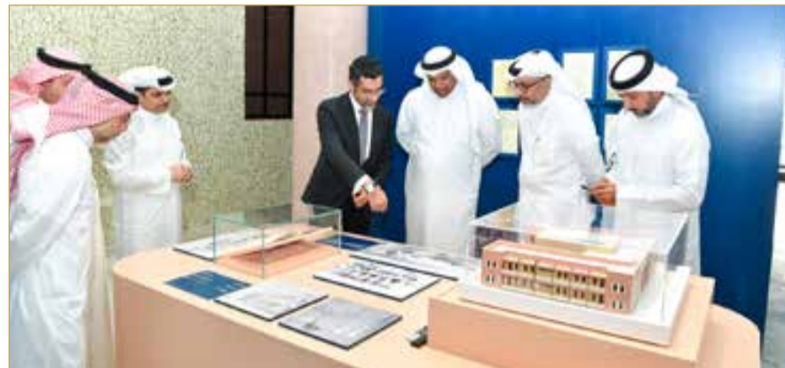
وزير شؤون البلديات والزراعة يجتمع برئيس وأعضاء جمعية التطوير العقاري البحرينية

تعزيز التعاون والتنسيق مع جمعية التطوير العقاري البحرينية، بما يساهم في دعم مسيرة التنمية العمرانية وتحقيق الأهداف التنموية المنشودة، إلى جانب رفع جودة الخدمات المقدمة للمواطنين والمقيمين والمستثمرين. (اقرأ الموضوع كاملاً بالموقع الإلكتروني).