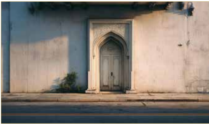
صورة تعبيرية مؤلدة بالذكاء الاصطناعي

وأقر المتهم في تحقيقات النيابة العامة بحضور المجني عليه إلى منزله وبقيامه بطرده. كما أثبت تقرير الطب الشرعي أن المجني عليه تعرض لإصابة ذات طبيعة راضة، وهي جائزة الحوادث وفقاً للوصف والتصوير والتاريخ الواردة في مذكرة النيابة العامة، وأن مدة العلاج تجاوزت 20 يوماً، كما أظهر فحص مقياس السمع وجود ضعف سمع دائم في الأذن اليسرى ناتج عن الإصابة، وهو ما عُدَّ عاهة مستديمة قُدِّرت نسبتها 7%.