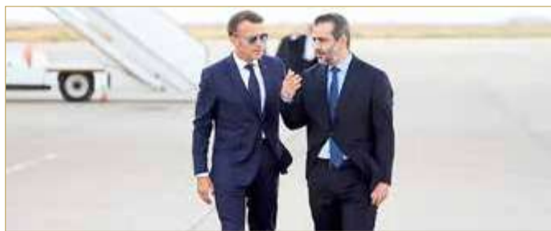
الرئيس الفرنسي إيمانويل ماكرون يصل إلى دمشق وفي استقباله وزير الخارجية السوري

وصل الرئيس الفرنسي إيمانويل ماكرون، الاثنين، إلى دمشق، في زيارة غير مسبوقه هي الأولى لرئيس دولة غربية كبرى إلى سوريا منذ تولي الرئيس أحمد الشرع السلطة أواخر العام 2024، عقب إطاحة حكم الرئيس المخلوع بشار الأسد. ويعتزم ماكرون، وفق ما قال قصر الإليزيه للصحافيين، أن يدعو في زيارته التي تستمر حتى الثلاثاء، إلى "سوريا حرة وتعددية تحترم جميع مكوناتها"، وتضطلع بـ "دور في تهدئة التوترات" في الشرق الأوسط. (العدد الإلكتروني).