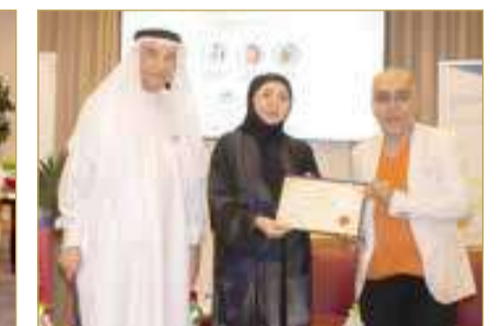
البلاد | زهراء خالد

أقام مركز عبدالرحمن كانو الثقافي ندوة ثقافية متميزة تحت عنوان "الجسر الثقافي الممتد"، والتي اتخذت من الدكتور منصور سرحان نموذجًا مسلطًا الضوء على مسيرته الطويلة وإسهاماته الكبيرة في إثراء الساحة الأدبية والبحوث التاريخية في مملكة البحرين.