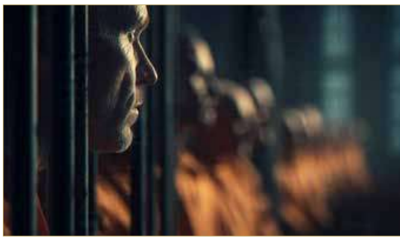
صورة تعبيرية مؤلدة بالذكاء الاصطناعي

وفي المقابل، لم تسفر التحريات عن التوصل إلى بيانات شخص آخر من أفراد الشبكة، كما تبين باستخراج محتويات هاتف المتهم الثاني احتواؤه على صور تتعلق بالمواد المخدرة، وأقر المتهم بأن بعضها يتعلق بالمؤثر العقلي "الميثامفيتامين".