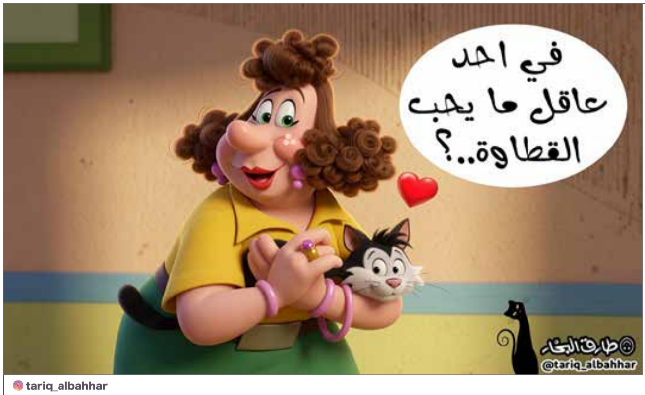
البلاد | كاريكاتير طارق البحار

وظهرت أصالة في الفيديو وهي توجه رسالة حماسية إلى جمهورها، أكدت فيها أن الحفل سيحمل طابعًا استثنائيًا يجمع بين الطرب والإحساس.