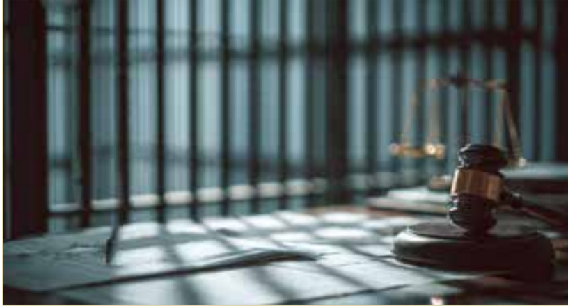
صورة تعبيرية مؤلدة بالذكاء الاصطناعي

وكانت المحكمة الكبرى الجنائية الاستئنافية الثالثة قد حكمت، بقبول الاستئناف شكلاً، وفي الموضوع، وبإجماع الآراء، بإلغاء الحكم بحبس المستأنف القاضي بالبراءة، والقضاء مجدداً بحبس المستأنف لمدة ثلاث سنوات عملاً بأحكام القانون، وبإصدار أمر اعتقاله، وذلك لإدانته بالتسبب في انهيار عقار بمنطقة عراد نتج عنه وفاة شخصين وإصابة ستة آخرين، إثر استئناف النيابة العامة للحكم الصادر عن محكمة أول درجة.