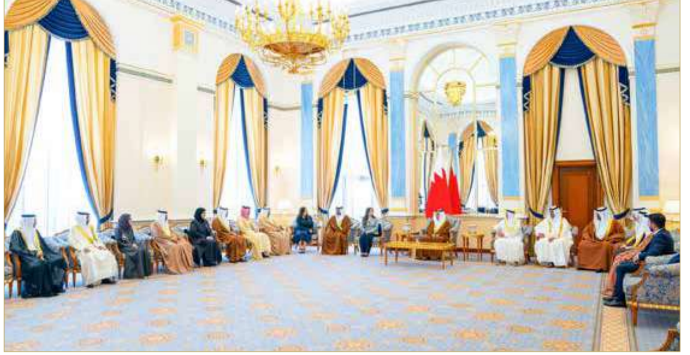
سمو ولي العهد رئيس الوزراء مستقبلاً عدداً من وكلاء الوزارات والوكلاء المساعدين المعيّنين حديثاً

أعضاء فريق البحرين من جهود مخلصه وعطاء متواصل، وما يجسدونه من روح المسؤولية والتفاني والإخلاص في أداء الواجب، ومؤكداً أن هذه الجهود تمثل ركيزة أساسية لمواصلة تحقيق النجاحات والإنجازات التي تعود بالخير والنماء على البحرين وأبنائها.