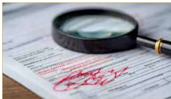
صورة تعبيرية مؤيدة بالذكاء الاصطناعي

وأوضح المجني عليه أنه أثناء توجهه إلى الجسر للعودة إلى الدولة الخليجية، تم إبلاغه بأن المركبة بحاجة إلى تسجيل وتأمين، فقام بالتواصل مع المتهم وطلب منه الحضور لاستلام المركبة من أجل إنهاء الإجراءات، وبالفعل استلمها المتهم، وعاد المجني عليه إلى الدولة الخليجية.