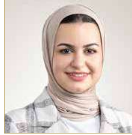
وزيرة شؤون الشباب

وستسهم الشراكة في دعم تنفيذ البرامج والأنشطة التي تقدمها مدينة شباب 2030، وتعزيز جودة المبادرات التدريبية والتطويرية، بما يوسع من الفرص المتاحة أمام الشباب البحريني للاستفادة من البرامج المتخصصة التي تلبى احتياجاتهم، وتسهم في تنمية مهاراتهم الشخصية والمهنية، وإعدادهم للمشاركة الفاعلة في مختلف القطاعات.