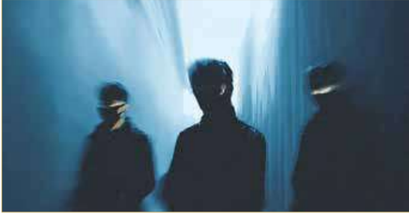
صورة تعبيرية مؤيدة باستخدام الذكاء الاصطناعي

كما تبين أن المتهمين كانوا بحوزتهم نحو 700 كيلوغرام من الأسلاك الكهربائية، وكانوا يعرضون الكيلوغرام للبيع مقابل دينار و800 فلس.