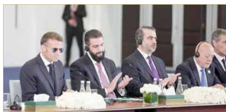
الرئيس السوري أحمد الشرع والرئيس الفرنسي إيمانويل ماكرون في دمشق

وأشار الرئيس السوري إلى أن المدن الصناعية السورية جاهزة لاستقبال الاستثمارات الأجنبية، قائلاً إن الشركة التي يجري العمل على تأسيسها مع فرنسا "تمثل نموذجاً للعلاقات المستقبلية مع أوروبا، يقوم على المصالح المشتركة التي تخدم الشعبين".