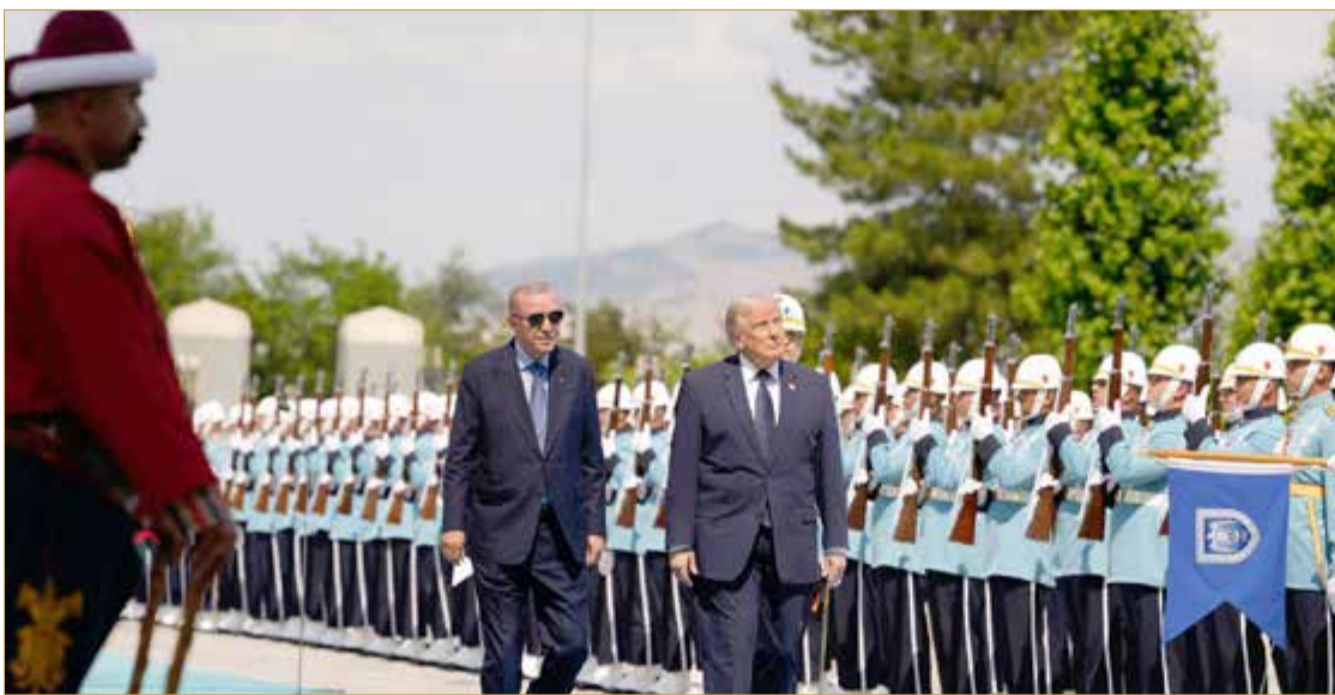
الرئيسان الأميركي ترمب والتركي أردوغان يستعرضان حرس الشرف في أنقرة بتركيا

"الناتو" يدفع نحو تسريع التصنيع العسكري وتحويل التعهدات المالية إلى قدرات قتالية