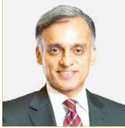
الرئيس التنفيذي لمجموعة بنك البحرين الوطني

مدينة شباب 2030 التي تمثل منصة وطنية رائدة لإعداد الشباب وتنمية مهاراتهم وتمكينهم من مواجهة متطلبات المستقبل. ونحرص عبر هذه الشراكة على الإسهام في دعم البرامج التي تسهم في إعداد جيل يمتلك المعرفة والمهارات والقدرة على الابتكار والقيادة، بما يعزز مسيرة التنمية الوطنية ويواكب تطلعات المملكة.