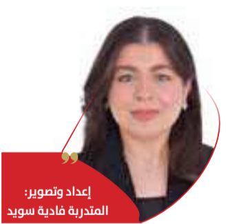
إعداد وتصوير: المتدربة فادية سويد

تشهد المنطقة المحيطة بالسوق الشعبي في مدينة عيسى انتشاراً للفرشات العشوائية غير المرخصة، في مشهد يثير استياء عدد من الأهالي وأصحاب المحال التجارية، بعدما تحولت جوانب الطرق والأرصفة والمساحات المفتوحة إلى مواقع لعرض وبيع مختلف السلع المستعملة، بما في ذلك الأثاث، والأجهزة الكهربائية، والملابس، والألعاب، والتحف والخردوات، في صورة تعكس حالة من الفوضى وتشوه المظهر الحضري للمنطقة.