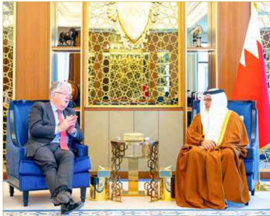
سمو ولي العهد رئيس الوزراء مستقبلاً الرئيس التنفيذي العالمي لشركة "دي إتش إل إكسبريس"