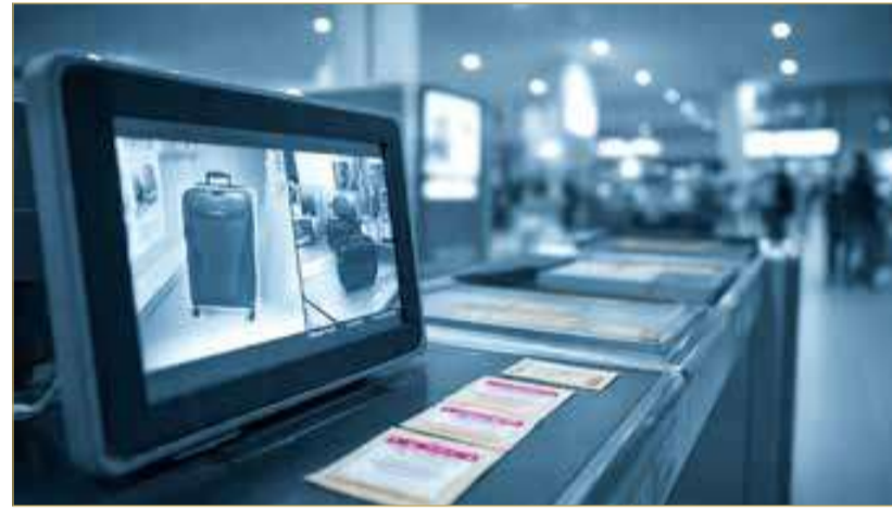
صورة تعبيرية مؤيدة بالذكاء الاصطناعي

كما أقر في محاضر جمع الاستدلالات بأنه جلب الأقراص بعد اتفاق مسبق مع صديقه على بيعها مقابل مبلغ 250 ديناراً بحرينياً، وثبت من خلال الفحص المخبري أن المضبوطات تحتوي على المؤثر العقلي "البريجابالين".