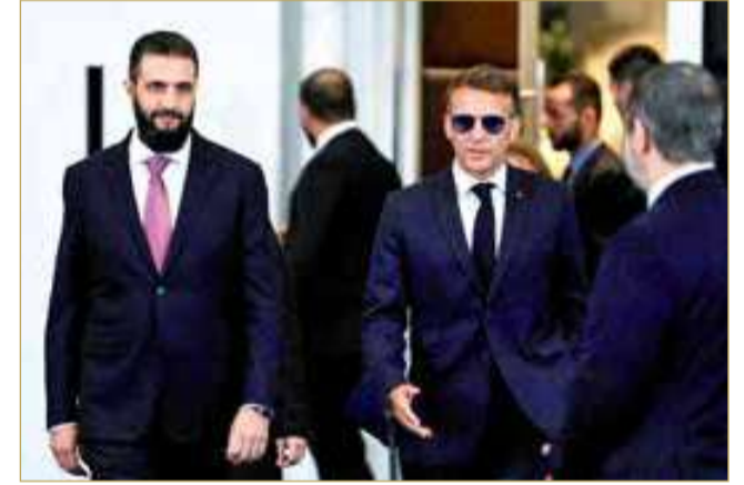
الرئيس الفرنسي والرئيس السوري في دمشق

وتابع: "التقيت مختلف الأطياف في سوريا ورأيت فيهم الكرامة والشجاعة والإصرار". وقال الرئيس الفرنسي في مؤتمر صحفي مشترك مع الرئيس السوري أحمد الشرع، الثلاثاء، إن بلاده مستعدة للمساهمة في إعادة بناء اقتصاد سوريا وقطاعها المصرفي، وذلك خلال زيارته دمشق.