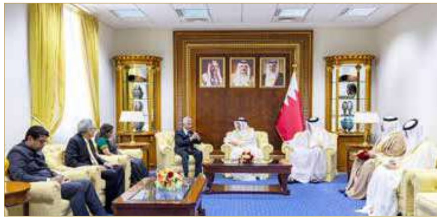
قصر القضيبيّة - مكتب نائب رئيس مجلس الوزراء

أكد الشيخ خالد بن عبدالله آل خليفة نائب رئيس مجلس الوزراء، أن العلاقات التاريخية الوثيقة التي تربط مملكة البحرين وجمهورية الهند الصديقة تمثل نموذجاً متقدماً للشراكات الاستراتيجية القائمة على أسس وطيدة من التعاون المشترك والاحترام والتفاهم المتبادلين. ولفت إلى أهمية مواصلة توسيع مسارات التعاون الثنائي بما يلبّي التطلعات المشتركة، ويعود بالتطور والنماء على البلدين والشعبين الصديقين.