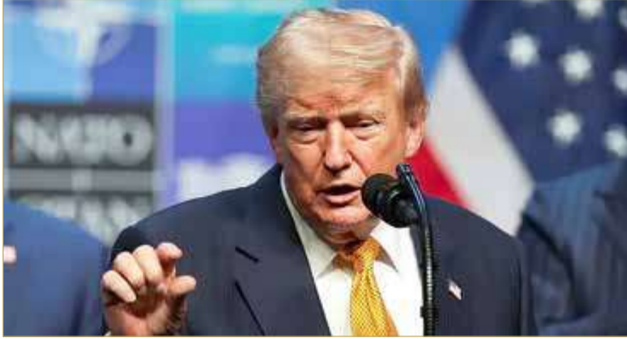
دونالد ترامب خلال مؤتمر صحفي عقب قمة حلف شمال الأطلسي بأنقرة

مضيفاً: لذلك أصبحت بلداً مختلفاً تماماً الآن. كل شيء انتهى، قادتهم رحلوا. كان لديهم قادة، وقد رحلوا، والآن لديهم فريق آخر من القادة، وربما يرحلون أيضاً، من يدري؟ وأشار ترامب إلى أنه أصبح الهدف الأول لإيران، قائلاً: قد أرحل أنا أيضاً، لأنني هدفهم الأول، وهذا معروف في كل مكان. أنا هدفهم الأول، لأنهم حثالة، هذه هي طريقتهم، وهكذا تصرفوا طوال 47 عاماً. لكنني أفعل ما هو صحيح للبلاد، وما هو صحيح فعلاً للعالم. وقال ترامب، رداً على سؤال عن تغيير لهجته تجاه القيادة الإيرانية الجديدة بعدما كان وصفها سابقاً بأنها عقلانية وذكية: لقد تعرفت عليهم. وأضاف: أعتقد أنهم أكثر عقلانية بكثير من المستوى الأول والمستوى الثاني. المستوى الأول انتهى، والمستوى الثاني انتهى. هذا هو المستوى الثالث. أعتقد أنهم أكثر عقلانية، لكن بناءً على أفعالهم خلال الأسبوع أو الأسبوعين الماضيين، فإنهم لا يقدمون خدمة للشعب. وكرر ترامب تشككه في فرص التوصل إلى اتفاق مع إيران وسط تصاعد التوتر حول مضيق هرمز، قائلاً: لست متأكدًا من أنني أريد إبرام اتفاق معهم. يمكننا أن نلعب بعض الألعاب، لكنني لست متأكدًا من أنني أريد إبرامها.