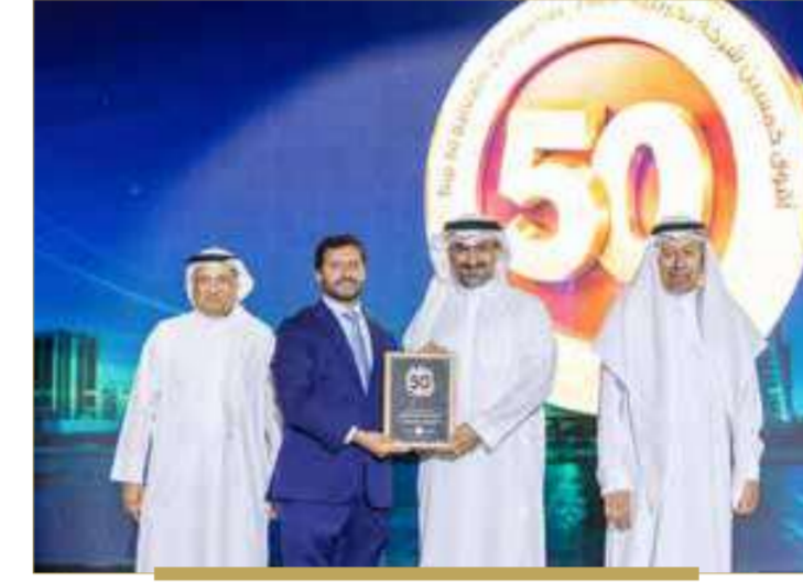
بنك البحرين الإسلامي