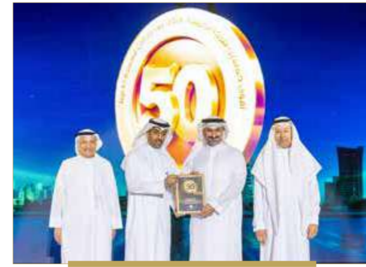
شركة مزاد البحرين