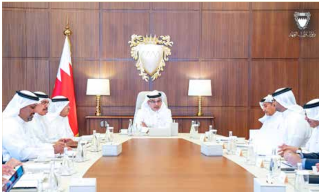
سمو ولي العهد رئيس الوزراء يترأس الاجتماع 33 للجنة العليا للتخطيط العمراني

ترأس صاحب السمو الملكي الأمير سلمان بن حمد آل خليفة ولي العهد رئيس مجلس الوزراء الاجتماع 33 للجنة العليا للتخطيط العمراني، إذ ناقشت اللجنة آخر مستجدات الاشتراطات التنظيمية للتعمر، كما اطلعت على مستجدات الموضوعات المتعلقة بتصنيف العقارات وتقسيم الأراضي.