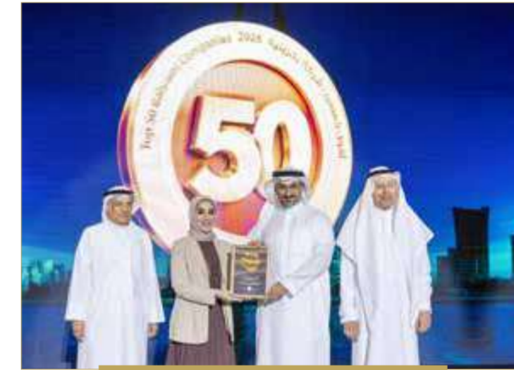
بنك جي إف إتش ش.م.ب