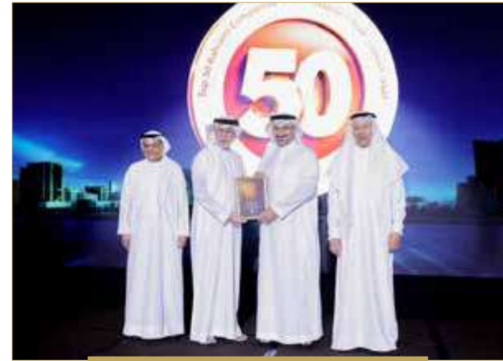
شركة عقارات السيف