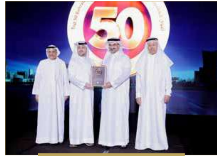
شركة استيراد الاستثمارية