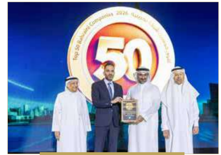
شركة "Manama steel"