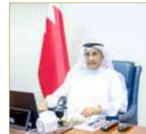
نائب رئيس مجلس الوزراء

أطلقت “البلاد” قائمتها السنوية لـ “أقوى 50 شركة بحرينية للعام 2026”، في إطار مبادرة تسلط الضوء على أبرز الشركات الوطنية من حيث الأداء والتأثير في الاقتصاد المحلي، وذلك في حفل بحضور وزير الصناعة