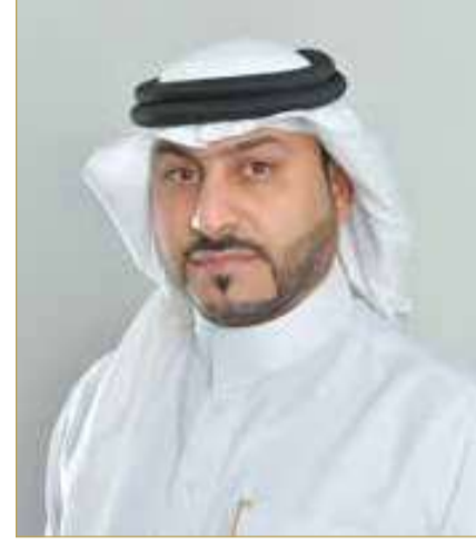
رئيس الاتحاد البحريني للمصارعة