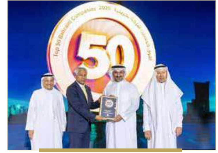
شركة كي بي إم جي - البحرين