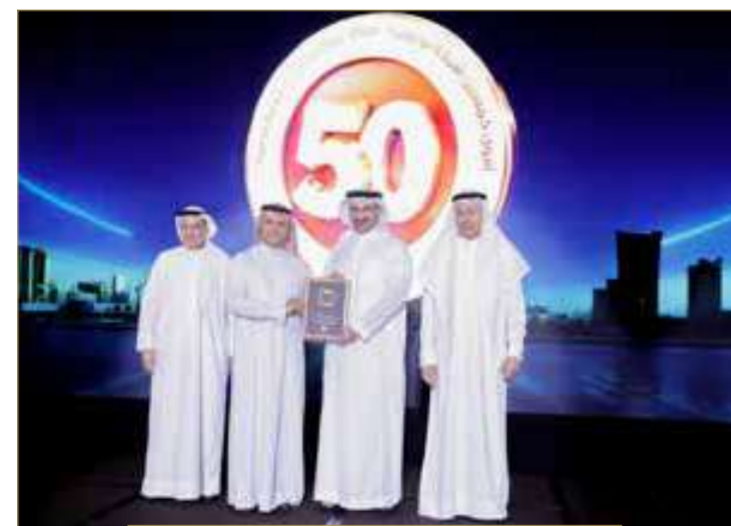
شركة دلمون للداجن