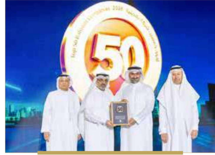
بيت التمويل الكويتي - البحرين