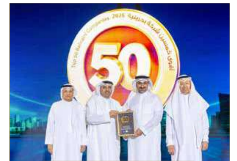
شركة درة البحرين