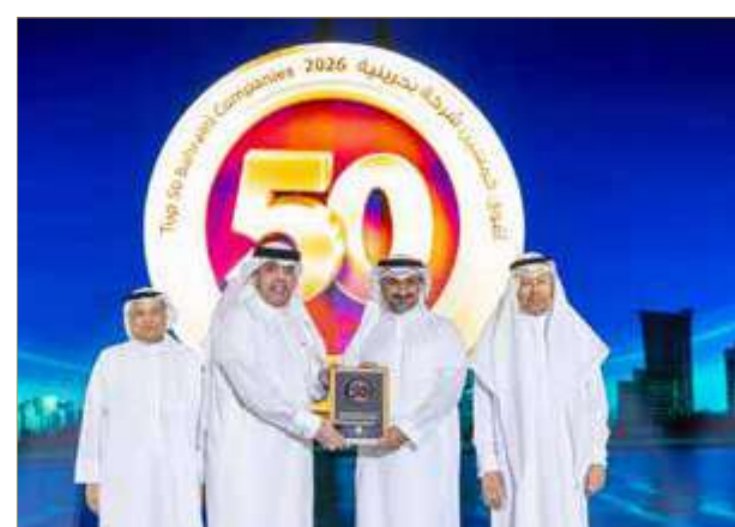
شركة البحرين لمواقف السيارات (أماكن)