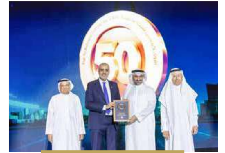
مجموعة البركة - البحرين