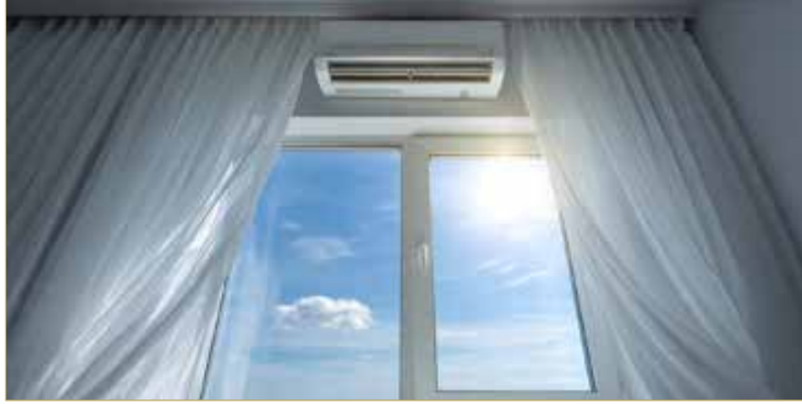
صورة تعبيرية مؤلدة بالذكاء الاصطناعي