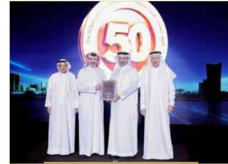
شركة زين البحرين