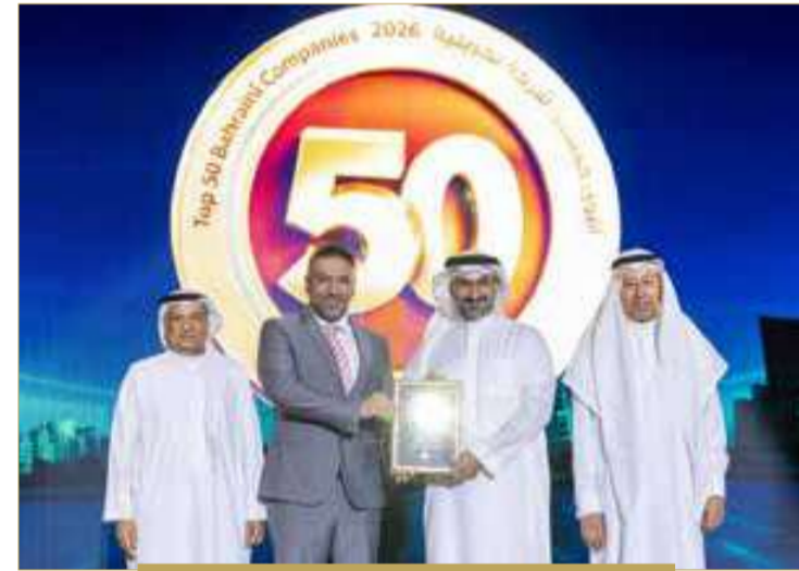
مجموعة "بي أم أم أي"