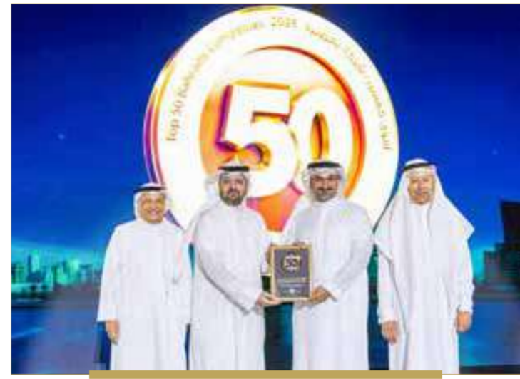
الشركة العربية لبناء وإصلاح السفن (أسري)