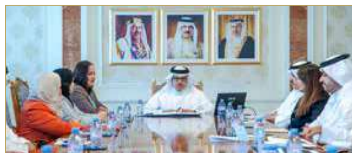
وزير الخارجية يترأس اجتماع لجنة الشؤون الدولية لحقوق الإنسان

المتحدة والمنظمات الدولية. جاء ذلك لدى ترؤس وزير الخارجية اجتماع لجنة الشؤون الدولية لحقوق الإنسان، والذي عُقد أمس بمقر وزارة الخارجية، حيث رحب بأعضاء اللجنة بعد إعادة تشكيلها وتعديل مساهماتها واختصاصاتها، معرباً عن خالص شكره وتقديره لأصحاب السعادة أعضاء اللجنة خلال تشكيلها السابق، على ما بذلوه من جهود مخلصه وعمل دؤوب أسهم في ترسيخ دور اللجنة وتعزيز أداها، وتحقيق العديد من المنجزات