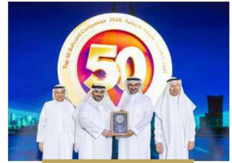
شركة ملة الخليج