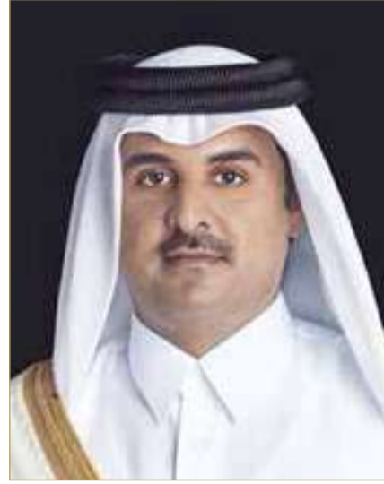
سمو أمير دولة قطر

المنامة - بنا تلقى حضرة صاحب الجلالة الملك حمد بن عيسى آل خليفة ملك البلاد المعظم، حفظه الله ورعاه، مزيداً من برقيات العهد والولاء من عددٍ من العائلات والأسر البحرينية الكريمة، أعربت فيها عن تأييدها المطلق ووقوفها التام خلف قيادة جلالة الملك المعظم حفظه الله ورعاه، مؤيدةً لكافة الإجراءات التي تم اتخاذها بكل حزم تجاه كل من أحلّ بواجباته الوطنية أو سعى للنيل من أمن الوطن واستقراره، مشددةً على أن هذه المواقف الحازمة تعكس نهجاً راسخاً في حماية الوطن والحفاظ على سيادته واستقراره، بما يصون مصالحه العليا ويعزز مسيرته التنموية الشاملة. فقد تلقى جلالته، أيده الله، برقيات العهد والولاء من كل من: محمد صلاح الزبيدي سالم علي عبدالله صالح فهيد مريم علي عبدالله صالح فهيد