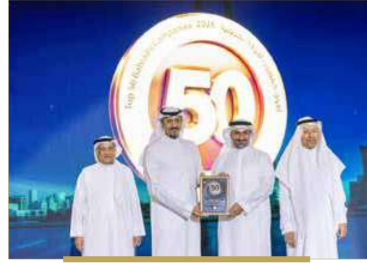
بنك البحرين والكويت