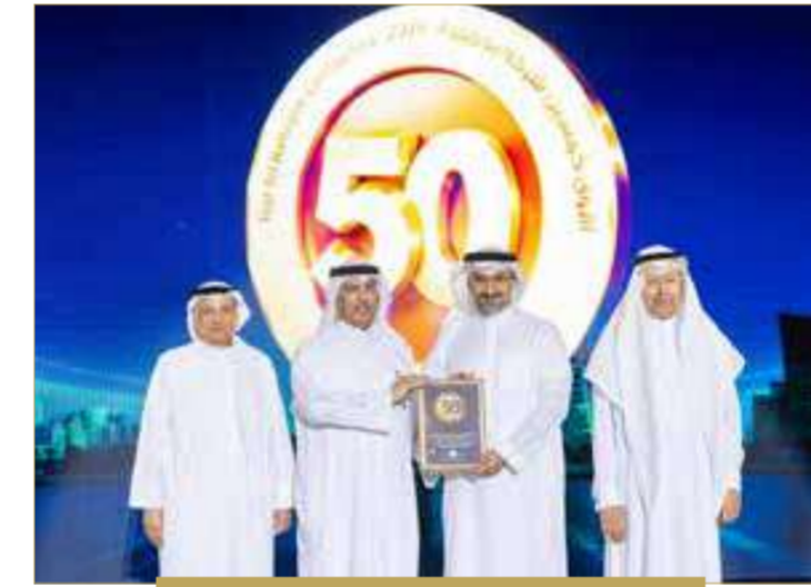
شركة "ايه بي إم تيرمينالز" البحرين