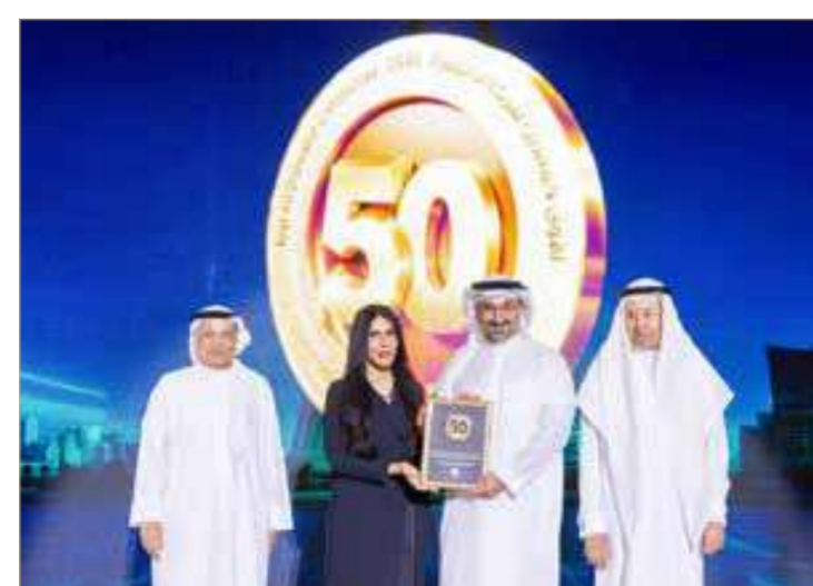
شركة البحرين لتصليح السفن والهندسة (باسرك)