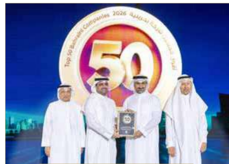
شركة التكاافل الدولية