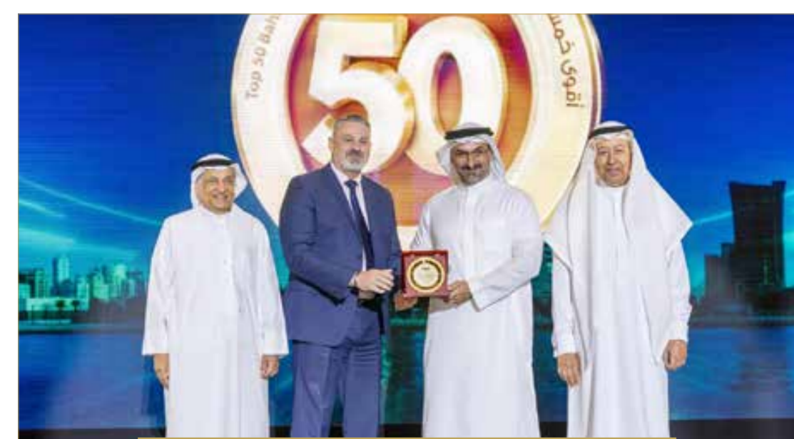
"Audi Centre Bahrain"