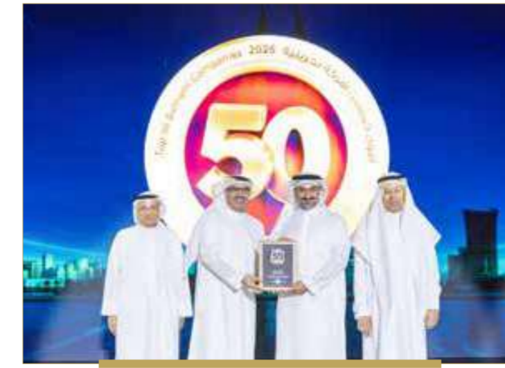
شركة جاهز البحرين