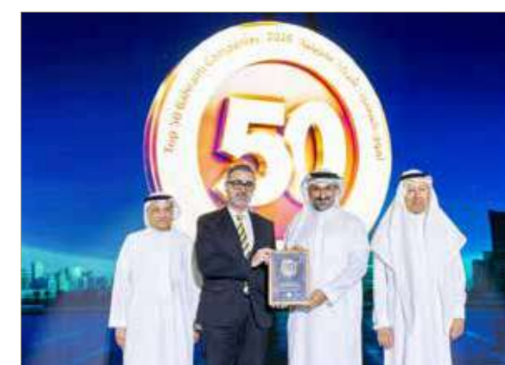
شركة الفنادق الوطنية