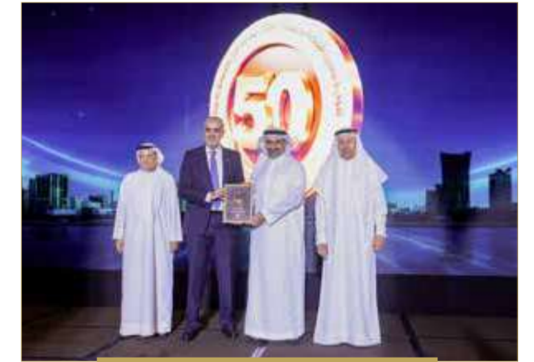
شركة سوليدرتي - البحرين