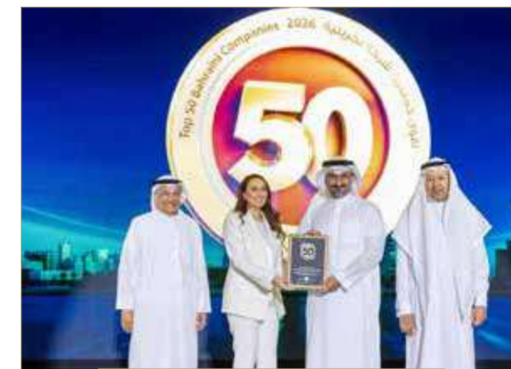
بنك البحرين للتنمية