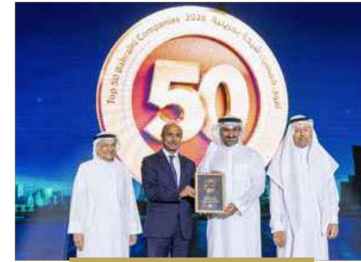
مجموعة فنادق الخليج