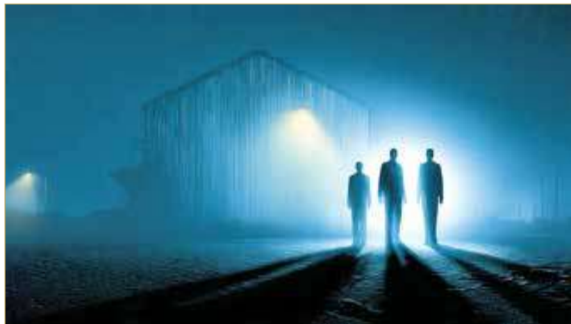
صورة تعبيرية مؤيدة بالذكاء الاصطناعي

وبحسب ملاحظات النيابة العامة، فقد اعترف المتهمون خلال التحقيقات بحيازتهم وإحرازهم المواد المخدرة بقصد التعاطي، كما قرر المتهمان الثاني والثالث أنهما يقومان بشراء مادة القنب (الحشيش) من المتهم الأول عن طريق الاستلام والتسليم المباشر مقابل مبالغ مالية.