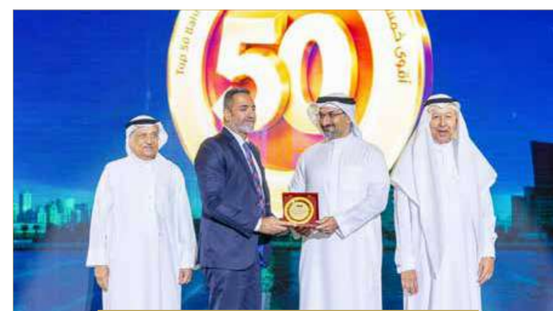
بيت التمويل الوطني