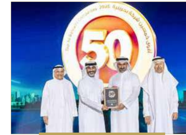
مجموعة يوسف بن أحمد كانو