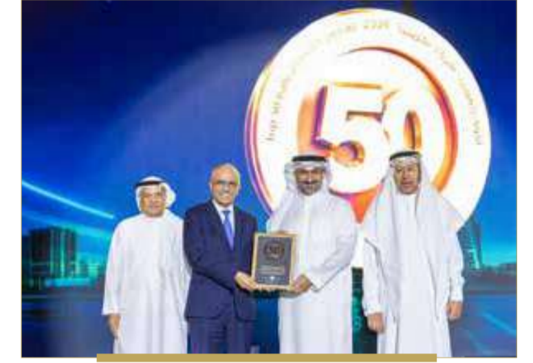
شركة ألمنيوم البحرين ش.م.ب (البا)