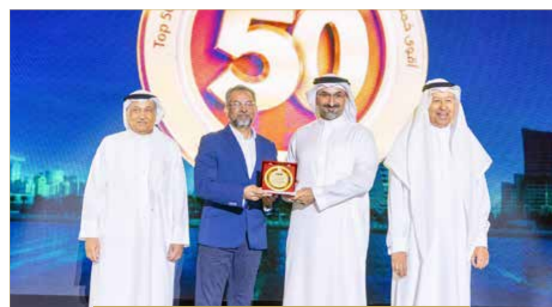
شركة المنامة للصناعات الحديدية