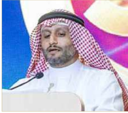
د. عمر العبيدلي

قال رئيس اللجنة المستقلة لمبادرة "أقوى 50 شركة بحرينية" الدكتور عمر العبيدلي إن مشروع "أقوى 50 شركة بحرينية" يُمثل أكثر من مجرد تصنيف سنوي للشركات، فهو مبادرة وطنية تهدف إلى إبراز المؤسسات التي تحقق أداء متميزا، وتسهم في تعزيز تنافسية الاقتصاد البحريني، وترسيخ ثقافة التميز الشفافية، والاعتماد على البيانات في تقييم الإنجاز. وأضاف: إننا نحرص كل عام على تطوير منهجية التقييم بما يعكس الأولويات الوطنية والمنتغيرات الاقتصادية، ومن هذا المنطلق يأتي هذا العام إدراج غرفة تجارة وصناعة البحرين، ولجنة التقييم، والرعاة، وجميع الشركاء، على جهودهم في إنجاح هذه المبادرة، وإبراز قصص النجاح الوطنية، وترسيخ ثقافة التميز، وتحفيز الشركات البحرينية على مواصلة التطور والابتكار.