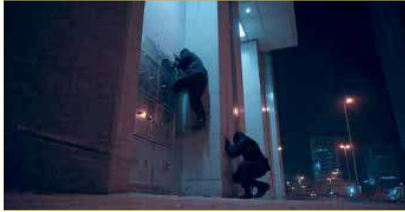
صورة تعبيرية مؤيدة باستخدام الذكاء الاصطناعي

الآخرين. كما تم استدعاء متهم آخر، وأقر بإخفاء جزء من المسروقات في مزرعة يملكها بمنطقة كركزان، حيث تم ضبط بعض المسروقات عقب تفتيش المزرعة بإرشاده وموافقته.