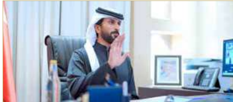
ناصر بن حمد يترأس اجتماع مجلس إدارة مجموعة “بابكو إنرجيز”

مجلس إدارة المجموعة للربع الثاني من العام 2026، الذي عقد عبر تقنية الاتصال المرئي. واعتمد مجلس الإدارة البيانات المالية لمجموعة “بابكو إنرجيز” للعام 2025، إضافة إلى إقرار ميزانية المجموعة للعام 2026، في إطار الحرص على تعزيز الاستدامة المالية ودعم خطط التوسع والنمو.