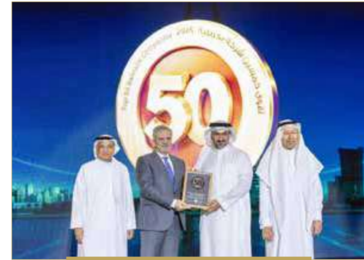
بنك اليوباف العربي الدولي ش.م.ب (م)