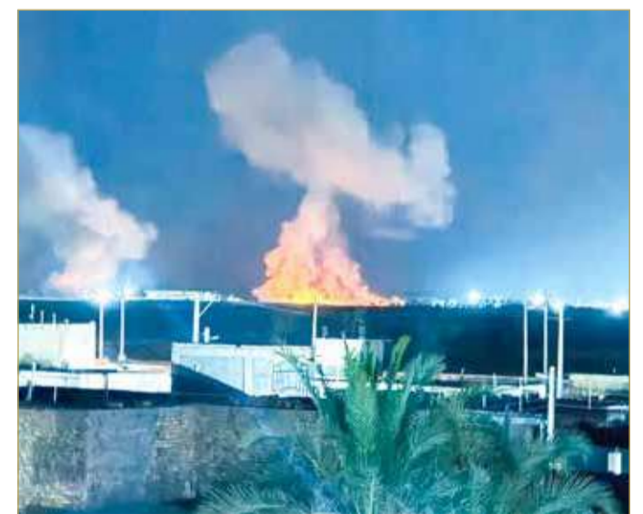
دوي انفجار بمدينة إيران شهر فجر الخميس

وسّعت الولايات المتحدة ضرباتها على إيران، الخميس، في جولة ثانية قالت القيادة المركزية الأميركية ”سننكوم“ إنها استهدفت نحو 90 موقعا عسكرياً، غداة قصف نحو 80 هدفاً آخر، لترتفع حصيلة الأهداف الأميركية خلال اليومين الماضيين إلى نحو 170 هدفاً، في تصعيد أعاد مذكرة التفاهم المؤقتة بين واشنطن وطهران إلى حافة الانهيار. وجاءت الضربات الجديدة بعد ساعات من قول الرئيس الأميركي دونالد ترامب إن الهجمات الإيرانية الأخيرة على سفن في مضيق هرمز تشير إلى نهاية