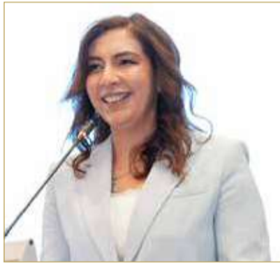
ريهام خليل سفيرة جمهورية مصر العربية

التعاون المشترك خلال المرحلة المقبلة. وأضافت أن ثورة 23 يوليو 1952 شكلت نقطة انطلاق لدور مصر الإقليمي القائم على الإيمان بالهوية العربية ووحدة المصير، وعلى أن أمن مصر لا ينفصل عن أمن محيطها العربي، وفي مقدمته أمن منطقة الخليج العربي. وأكدت أن ثورة 23 يوليو 1952 جسدت إرادة الشعب المصري في بناء دولة مستقلة، وأطلقت مسيرة وطنية ما زالت مبادئها حاضرة في جهود التنمية والبناء وتحقيق الإنجازات في مختلف المجالات، مشيرة إلى أن ما تشهده مصر اليوم من مشروعات وإنجازات متسارعة يعكس استمرار أهداف الثورة ورؤيتها للمستقبل.