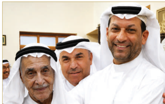
عرف الراحل بحضور اجتماعي مميز بين أهل البحرين