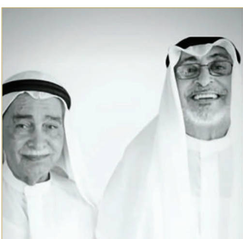
الراحل مع المغفور له الشيخ عيسى بن محمد آل خليفة

عضويته في نادي الإصلاح، حيث شهدت تلك المرحلة نشاطاً فكرياً وثقافياً واسعاً، وكان الراحل يؤمن بأن الوحدة الوطنية، ولهذا كان يكرر دائماً بأن أبناء الوطن في الماضي كانوا على قلب واحد، داعياً إلى استعادة تلك الروح القائمة على التعاون والاحترام والعمل المشترك.