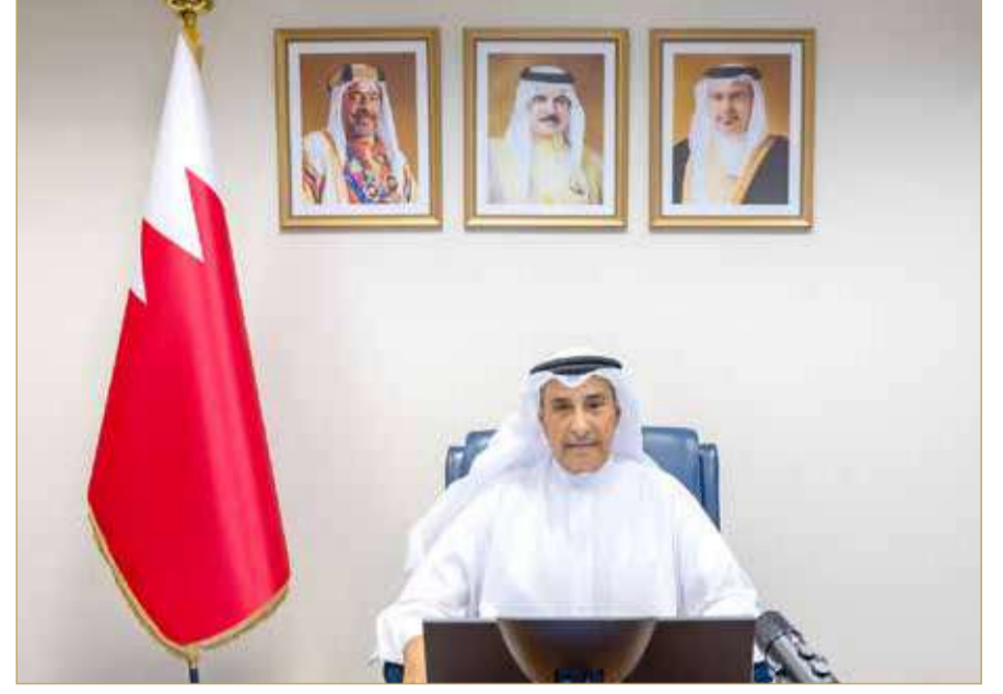
الشيخ خالد بن عبدالله

أكد الشيخ خالد بن عبدالله آل خليفة، نائب رئيس مجلس الوزراء، أن الارتقاء بمنظومة العمل الحكومي وتطوير أداء الكوادر الوطنية يمثلان أولوية ترفد أهداف المسيرة التنموية الشاملة بقيادة حضرة صاحب الجلالة الملك حمد بن عيسى آل خليفة، ملك البلاد المعظم، حفظه الله ورعاه، وتوجيهات صاحب السمو الملكي الأمير سلمان بن حمد آل خليفة، ولي العهد رئيس مجلس الوزراء، حفظه الله. وأشار إلى أن الاستثمار في صقل المهارات القيادية والإدارية ينعكس إيجاباً وبشكل ملموس على جودة وكفاءة الخدمات المقدمة، من خلال تبني ثقافة الابتكار كنهج ثابت يمكن الكفاءات الحكومية من صياغة حلول استباقية تصب في مسار التنمية المستدامة، وتحقق التطلعات المنشودة