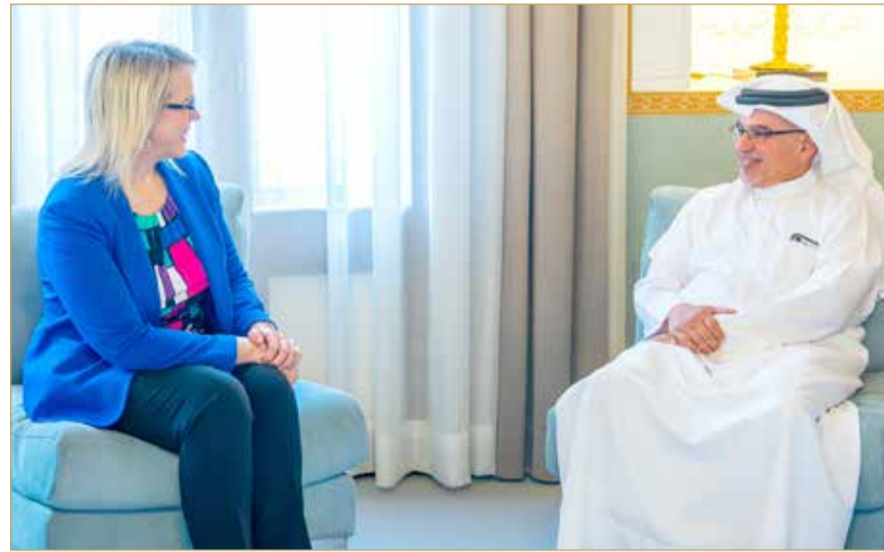
سمو ولي العهد رئيس الوزراء مستقبلا السفارة الأميركية

استقبل صاحب السمو الملكي الأمير سلمان بن حمد آل خليفة، ولي العهد رئيس مجلس الوزراء، في قصر الرفاع أمس، بحضور سمو الشيخ عيسى بن سلمان بن حمد آل خليفة وزير ديوان رئيس مجلس الوزراء، والشيخ سلمان بن خليفة آل خليفة وزير المالية والاقتصاد الوطني، ستيفاني لين هاليت سفيرة الولايات المتحدة الأميركية لدى مملكة البحرين. وخلال اللقاء، أكد صاحب السمو الملكي ولي العهد رئيس مجلس الوزراء، حفظه الله، أن العلاقات التاريخية الراسخة والروابط الوثيقة التي تربط بين مملكة البحرين والولايات المتحدة الأميركية الصديقة تشهد تقدماً ونموً مستمرًا على كافة الأصعدة، بفضل ما تستند إليه من شراكة استراتيجية متينة واتفاقيات مشتركة ومنها الاتفاقية الشاملة للتكامل الأمني والازدهار، وبما يصب في تحقيق التطلعات المشتركة ويعود بالازدهار والنماء على البلدين والشعبين الصديقين. وأكد سموه الدور محوري الذي تضطلع به الولايات المتحدة الأميركية إلى جانب الدول