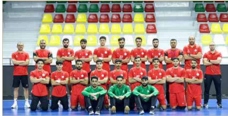
منتخبنا الوطني للشباب لكرة اليد

يخوض منتخبنا الوطني للشباب لكرة اليد يوم السبت المقبل آخر مبارياته التحضيرية للمشاركة في البطولة الآسيوية التاسعة عشر والتي تقام في جمهورية الصين الشعبية خلال الفترة من 15 - 27 الشهر الجاري، والمؤهلة إلى نهائيات كأس العالم 2027. ومن المقرر أن يغادر المنتخب فجر يوم غد الجمعة إلى دولة الإمارات العربية المتحدة الشقيقة للملاحة نظيره الإماراتي في مدينة دبي ومن ثم التوجه مباشرة إلى مدينة شوزهو الصينية لخوض غمار التصفيات بعد انتهاء برنامج المرحلة الأخيرة من الإعداد.