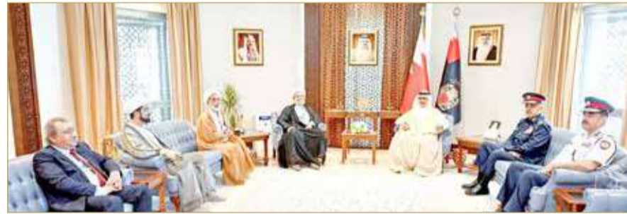
وزير الداخلية أشاد بتعاون رؤساء المآتم والقائمين عليها والخطباء والروايد

استقبل الفريق أول الشيخ راشد بن عبدالله آل خليفة وزير الداخلية، أمس، فضيلة الشيخ ناصر بن الشيخ أحمد خلف العصفور وكيل محكمة التمييز، عضو المجلس الأعلى للشؤون الإسلامية، فضيلة الشيخ الدكتور محمد طاهر الشيخ سليمان المدني القاضي بمحكمة التمييز، فضيلة الشيخ منصور علي حمادة عضو المجلس الأعلى للشؤون الإسلامية، والشاعر محمد هادي الحلواجي، بحضور نائب رئيس الشرطة ومدير عام الإدارة العامة للإعلام والثقافة الأمنية. ونوه وزير الداخلية إلى ضرورة الاستمرار في التعاون والتنسيق في كافة المجالات