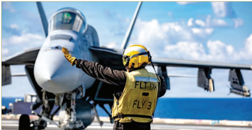
مقاتلة أميركية تستعد للإقلاع من على متن حاملة الطائرات جيرالد فورد الراسية في البحر المتوسط

وقال مسؤول أميركي إن البيت الأبيض يعتقد أن لديه مساحة أوسع للتصعيد، بعد تمكن مئات ناقلات النفط من مغادرة الخليج عبر المضيق خلال الأسابيع الماضية، ما خفف المخاوف داخل الإدارة من أن يؤدي أي اشتباك جديد فوراً إلى ارتفاع حاد في أسعار النفط. وأضاف المسؤول أن التصعيد الحالي يعكس حالة إحباط لدى تيارات أكثر تشدداً داخل القيادة الإيرانية، ترى أن مذكرة التفاهم لم تحقق مكاسب حقيقية لطهران، خصوصاً مع تراجع نفوذها في المضيق، وصعوبة بيع النفط رغم الإغفاءات الأميركية المؤقتة من العقوبات، وختم التقرير بأن موقف واشنطن بات واضحاً، وهو أن يبقى مضيق هرمز مفتوحاً أمام الملاحة التجارية، إذ قال نائب الرئيس الأميركي جي دي فانس إن أي محاولة إيرانية لإغلاقه ستقابل برد من الجيش الأميركي.