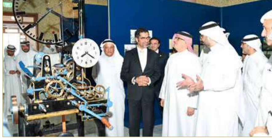
وزير شؤون البلديات والزراعة يستقبل رئيس وأعضاء غرفة تجارة وصناعة البحرين

الموضوعات ذات الاهتمام المشترك، واستعراض سبل تعزيز التعاون والتنسيق بين الجانبين، بما يعزز كفاءة الإجراءات، ويساهم في تسريع إنجاز المعاملات، ورفع جودة الخدمات الحكومية، بما يدعم جهود التنمية المستدامة.