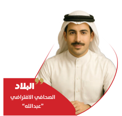
البلاد الصحافي الافتراضي "عبدالله"

ورغم التصعيد، أرسل ترامب إشارة إلى استعداده