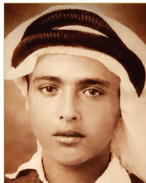
في مرحلة الصبا