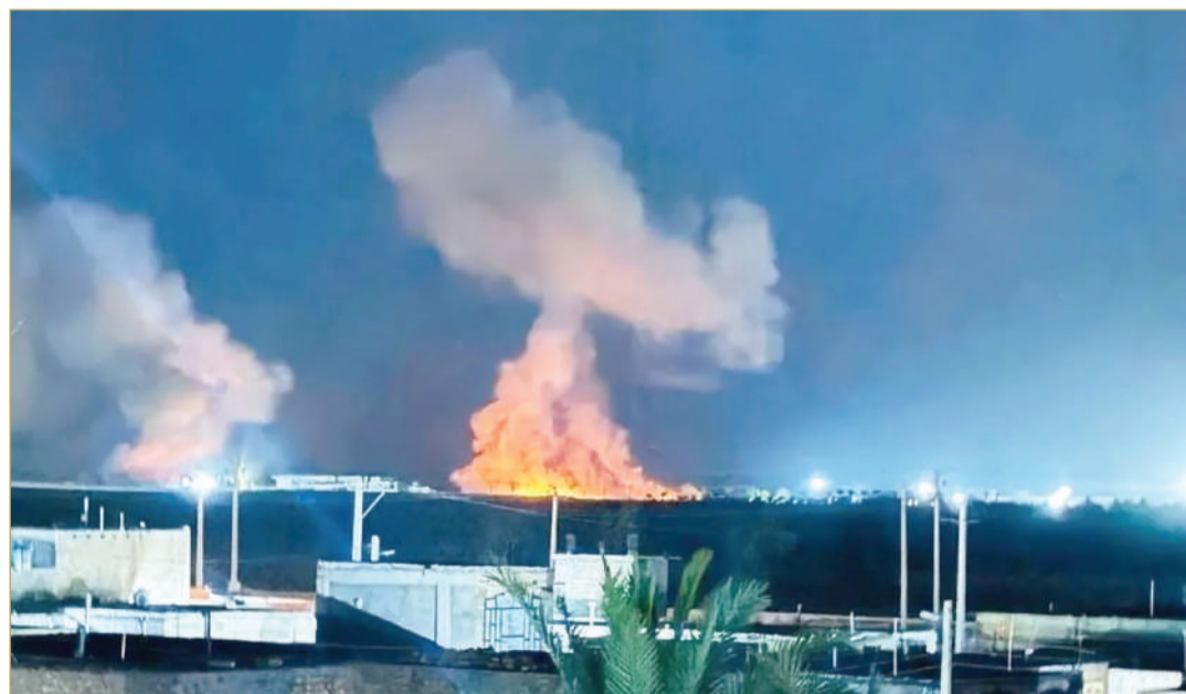
دوي انفجار بمدينة إيران شهر القريبة من الحدود الباكستانية في جنوب شرق فجر الخميس "تلغرام"

ليشمل مواقع في العمق الإيراني، بينها جسور وسكة حديد في مسارات ذات أهمية اقتصادية ولوجستية. وفي تطور عكس انتقال الضربات من الساحل إلى العمق، ذكرت وكالة "فارس" أن هجمات أميركية خلال الليل استهدفت جسراً للسكك الحديدية في محافظة غلستان شمال شرقي إيران، وألحقت أضراراً بطريق تجاري مع الصين وروسيا الشريكتين الاستراتيجيتين لطهران. وهذه المرة الأولى منذ أبريل، تظال الضربات الأميركية جسوراً داخل إيران. وأفادت وسائل إعلام رسمية أيضاً بضربة على جسر للسكك الحديدية في محافظة غلستان.